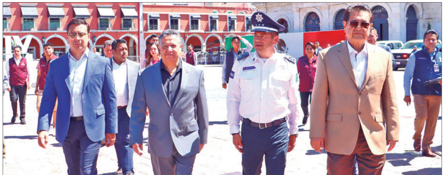
RITMO. Julio Menchaca Salazar encabezó entrega de 145 patrullas, vehículos, uniformes y certificado único policial a elementos, además conminó a evitar tentaciones y no cometer actos de corrupción pues a la fecha dieron de baja a casi 50 agentes por estas causales.

"El hecho de que en las evaluaciones considere la población un grado rango alto de buena percepción es muy estimulante, desafortunadamente por algunos malos elementos se perjudica la percepción y la confianza en instituciones y cuerpos de seguridad, a veces no entendemos lo difícil que significa el trabajo que desempeñan, en donde está la adre-