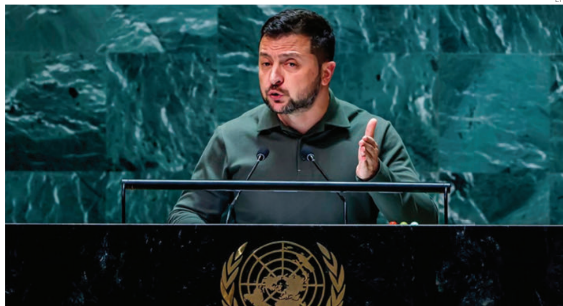
Zelenski ha pedido que Rusia sea despojada de su derecho a veto.

Propuso que, ante la dificultad de reformar la estructura de los propios órganos de la ONU, el derecho a veto sea sorteado de la siguiente manera: cada vez que un Estado lo aplica, el tema llega a la Asamblea General, que podría anularlo