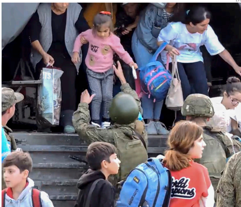
Mujeres y niños karabajíes son ayudados por soldados rusos a abandonar "zonas de peligro" en el enclave armenio de Nagorno Karabaj, en Azerbaiyán.