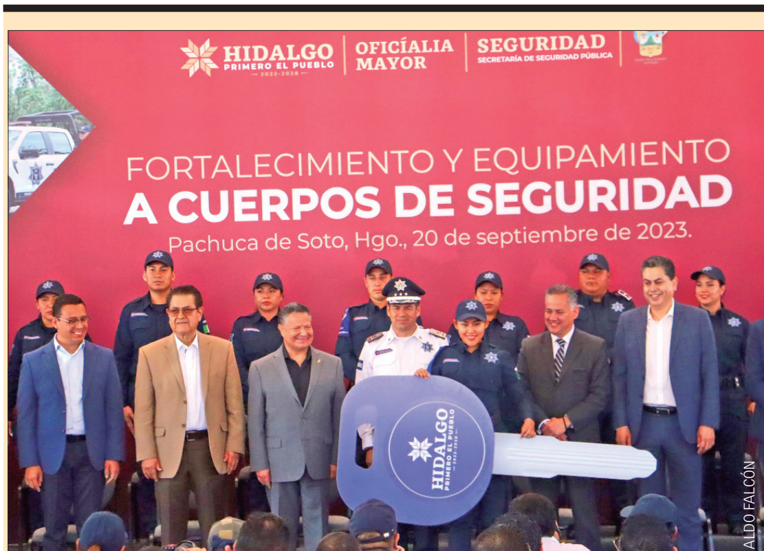
RITMO. Julio Menchaca Salazar encabezó entrega de 145 patrullas, vehículos, uniformes y certificado único policial a elementos, además conminó a evitar tentaciones y no cometer actos de corrupción pues a la fecha dieron de baja a casi 50 agentes por