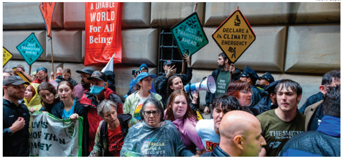
Activistas climáticos exigen que la Reserva Federal deje de financiar combustibles fósiles.

El secretario general también delineó medidas concretas para abordar la crisis climática. Destacó la importancia de limitar el aumento de las temperaturas a 1.5 grados centígrados por en-