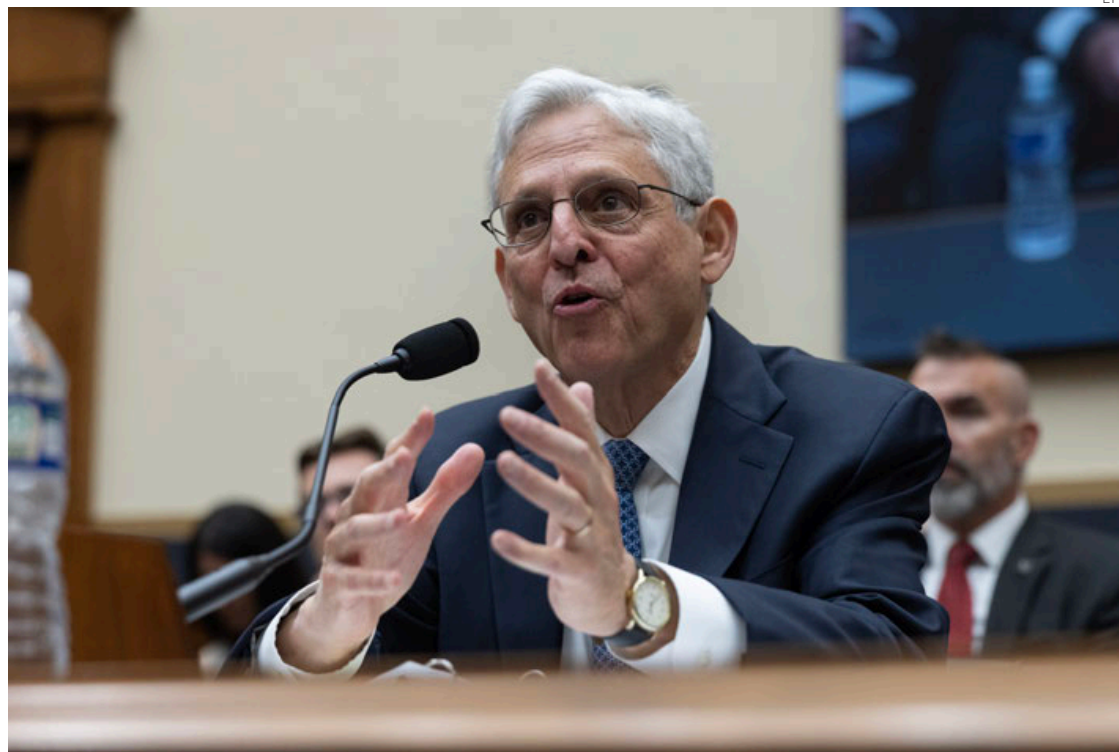
El fiscal general de EU, Merrick Garland.

Todos los “Chapitos han sido inculcados públicamente y por