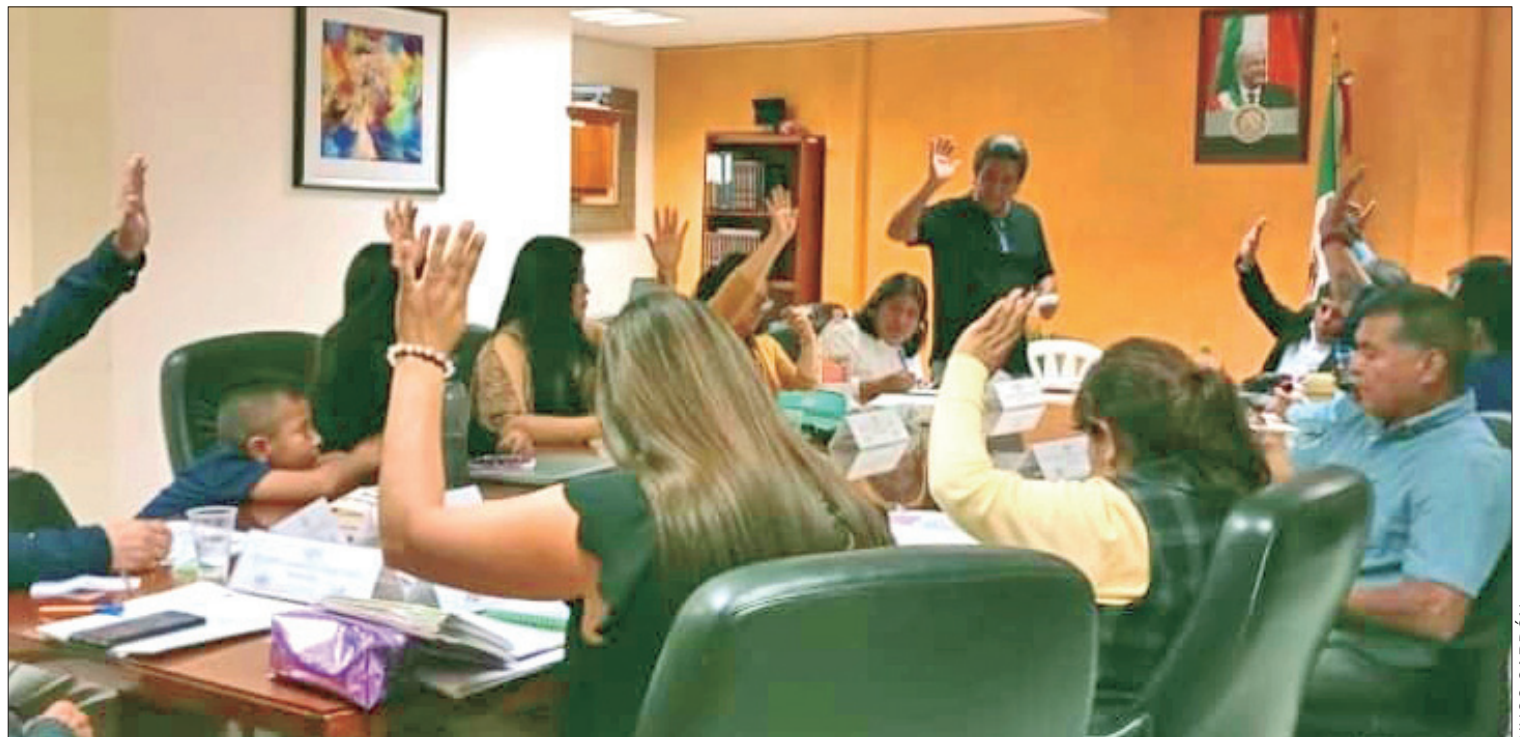
POSTURA. Los regidores de oposición señalan que está violando la ley y se debe actuar como corresponde.

De acuerdo con el documento enviado al congreso, el regidor ha faltado a las sesiones de cabildo el 5, 6, 11 y 12 de septiembre de este 2023.