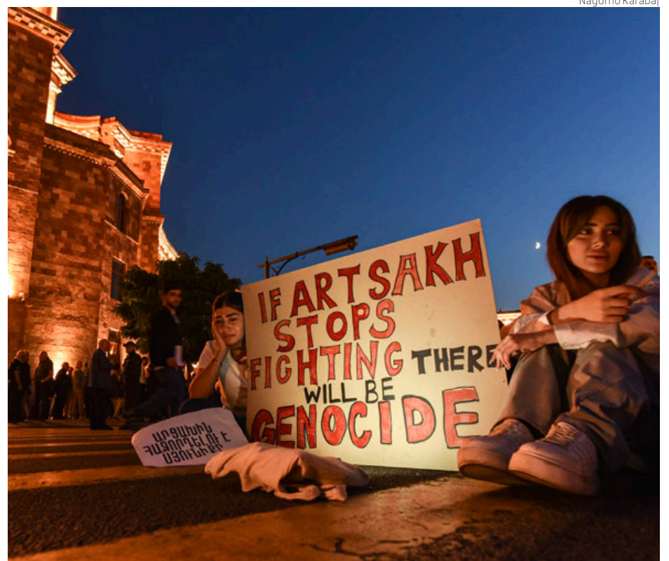
Armenias se manifiestan en Ereván, la capital armenia, contra la amenaza de genocidio en Artsaj.