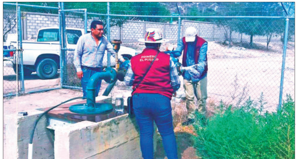
ACCIONES. Rehabilitaron 766 metros de tubería de agua potable.

En este mismo sentido, mencionan que se rehabilitó un total de 766 metros de tubería de agua potable y se ha mejorado 845 metros de drenaje sanitario, invirtiendo 240 mil 690 pesos para beneficiar a más de 28 mil 500 habitantes que hacen uso de los servicios de Capasmi.