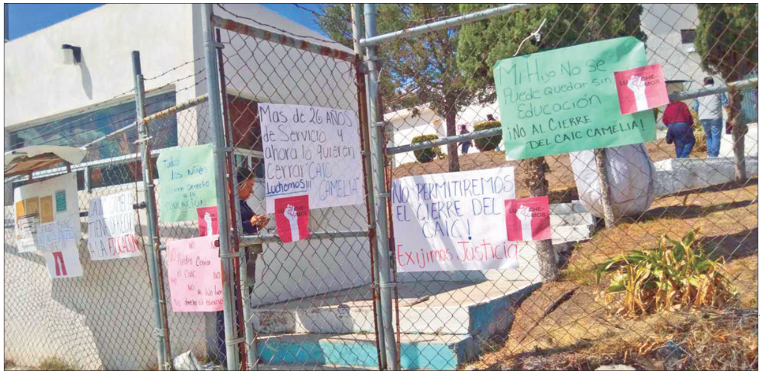
DESESPERACIÓN. Manifestación sobre la avenida Juárez fue para solicitar la intervención de la Comisión de Derechos Humanos del Estado Hidalgo.

Permitiendo diferentes formas de inscripción, estas se podrán realizar de manera presencial en el Centro de Integración Juvenil Pachuca, el cual se encuentra ubicado en la Calle San Martín de Porres, No. 100, Fracc. Canutillo, o virtual a través del enlace https://docs.google.com/forms/d/e/1FAIpQLSc3bAMa7ZNe4mm4c4zR37tUGD60deRbFDkuFecz7WY03Njiaw/viewform?usp=sf_link (Staff Crónica Hidalgo)