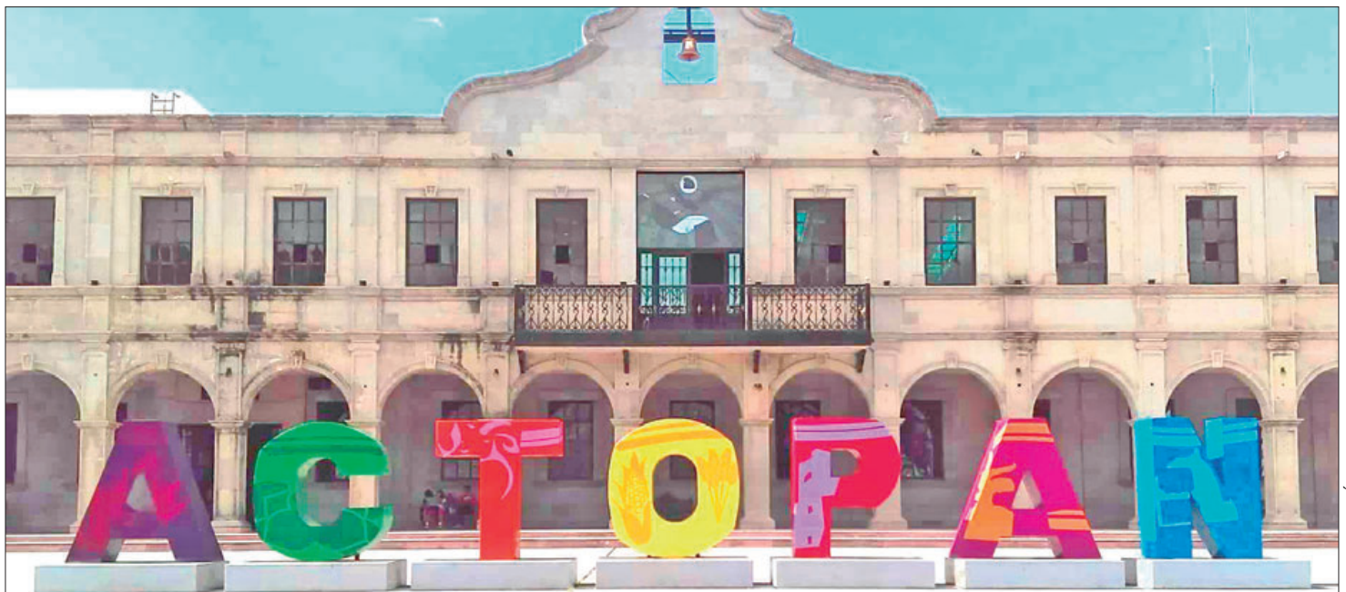
LA QUEJA. Fueron 35 uniformados quienes protestaron porque para atender más de 50 comunidades, sólo cuentan con tres unidades.