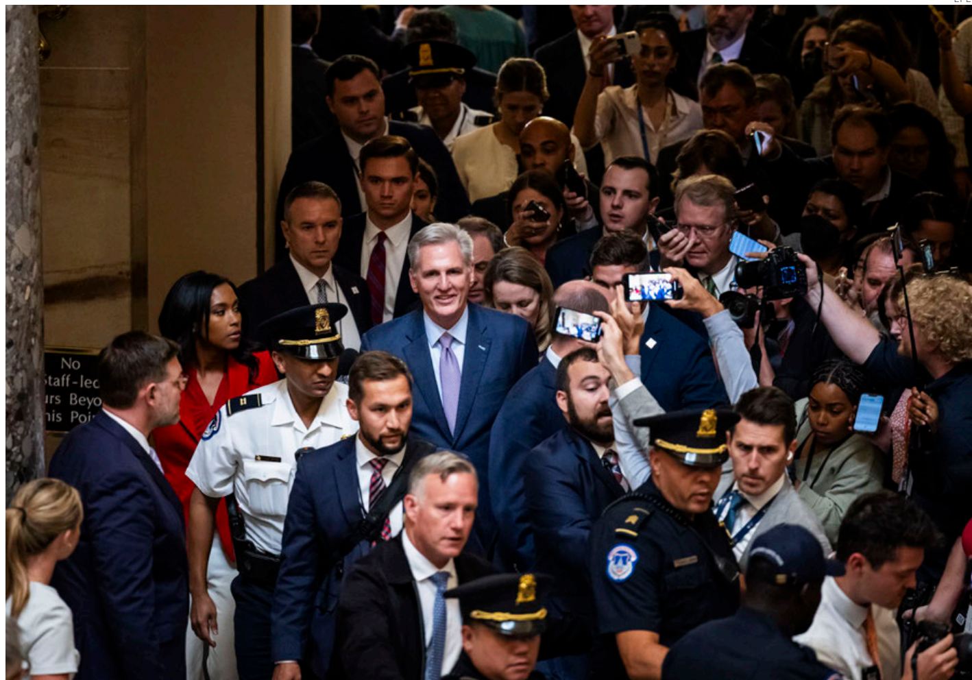
Kevin McCarthy sonríe con cara de circunstancia mientras abandona el hemiciclo rodeado de un enjambre de periodistas.

En su defensa de la moción de censura contra su propio compañero de partido, Gaetz dijo que “mis colegas y yo no podemos apoyar a nuestro partido en la tarea de llevar al país al caos. El caos es