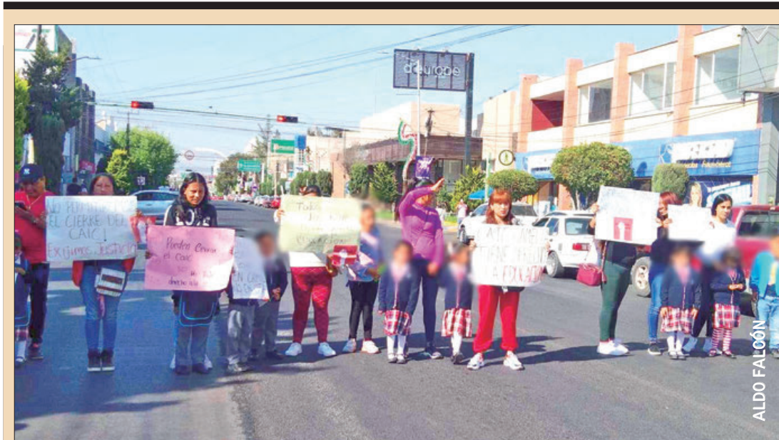
Elementos de Protección Civil y del DIF Municipal realizaron un recorrido con medios de comunicación para mostrar las afectaciones del CAIC, del barrio Camelia, donde ya imposible realizar actividades y requiere atención inmediata, pues la edificación corre el riesgo de colapsar.

Según los datos del organismo estadístico, las empresas hidalguenses exportaron más de 644.7 millones de dólares, de enero a junio del presente año, a diferencia del mismo lapso del año pasado, lo cual posiciona a la entidad en primer lugar a escala nacional por mayor incremento. .3