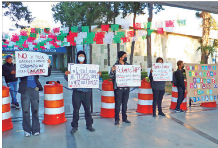
ACTIVIDADES. El pasado lunes, el cuerpo jurídico del Tecnm visitó a los estudiantes en paro y constató las condiciones de las instalaciones.

"Conocemos el miedo de muchos compañeros que por el temor a tener alguna represalia no se atreven a levantar la voz y hacer valer sus derechos, por ello, reiteramos la invitación para apoyar al movimiento estudiantil que lo único que busca es mejorar las condiciones educativas en la institución".