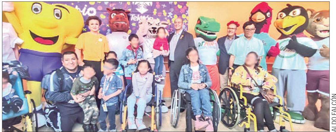
APUESTA. La SEPH se sumará a la campaña Boteo Teletón 2023.

Agregó que los equipos entregados son de alta calidad y permitirán la elaboración de proyectos para el desarrollo de infraestructura en los 84 municipios, lo que abonará al cumplimiento de metas y objetivos institucionales, acorde al presupuesto sin precedentes que este año ejerce la SIPDUS. (Staff Crónica Hidalgo)