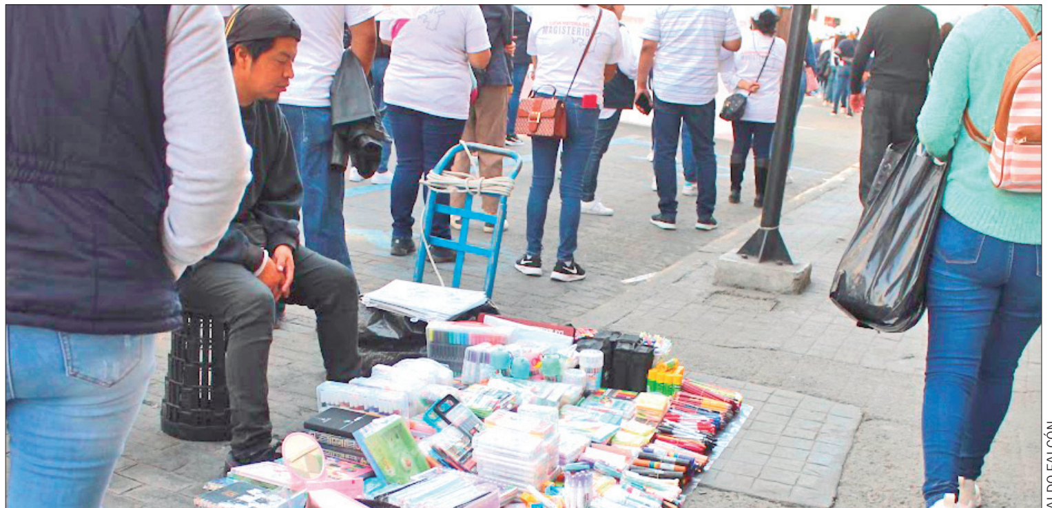
ACCIONES. La primera estrategia que se aplicará será el "Buen Fin 2023" para trabajar de manera conjunta, conocer los puntos más críticos de ambulantes.