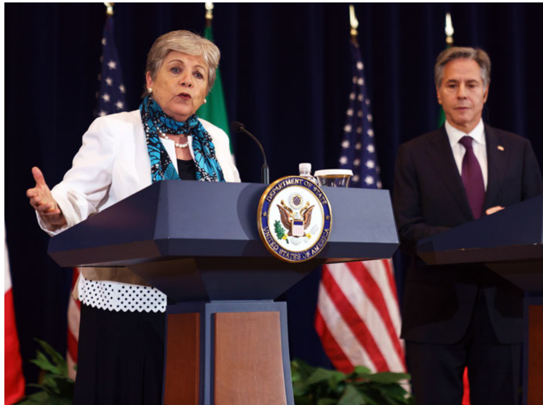
El secretario de Estado de EU, Antony Blinken, recibió el viernes pasado en Washington a la canciller mexicana Alicia Bárcena.

El fiscal general puso como ejemplo una de estas compañías, que vendía xilazina, utilizada para aumentar los efectos del fentanilo e incrementar así su valor.