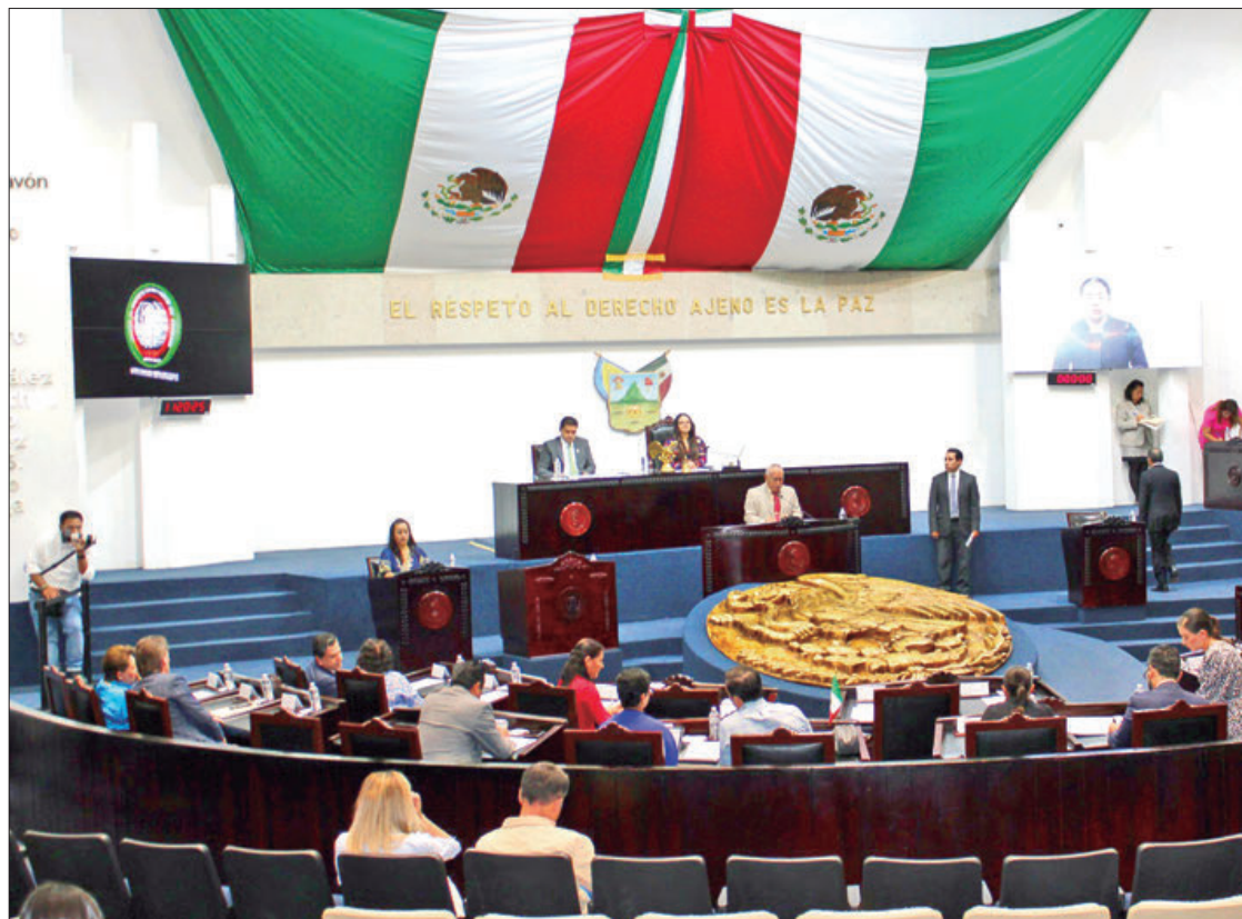
ACTIVIDADES. Este martes 3 de octubre de 2023 se llevó a cabo la sesión ordinaria 161 del Congreso del Estado de Hidalgo.

Además, se propone asignar un presupuesto municipal específico para campañas de esterilización y vacunación gratuitas, con el objetivo de controlar la procre-