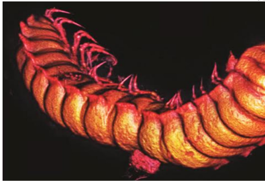
Es difícil y delicado estudiar los fósiles de insectos; en 2015 se logró reconstruir en 3D la imagen de un milpiés hallado en ámbar en Chiapas.

Las arañas violinista y viuda negra son estudiadas con mayor interés por Riquelme Alcántar, debido a su importancia médica y el interés en las potentes