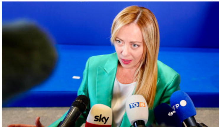
Georgina Meloni, primera ministra de Italia, país que urge por un acuerdo migratorio.

Su postura impidió una declaración final sobre el tema; presidente del CE publica una propia