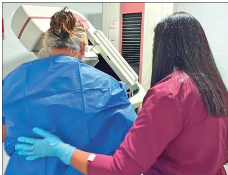
UMF. Labores son en la Unidad de Medicina Familiar No.37, ubicada en Doxey, Tlaxcoapan.

Indicó el IMSS que la importancia de realizarse una mastografía radica en que ésta permite detectar anomalías, como tumores o quistes, en sus prime-