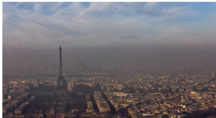
Una ciudad contaminada y con temperatura alta.

«¿Queremos que las plantas produzcan más isopreno para que sean más resistentes, o queremos que produzcan menos para no empeorar la contaminación del aire? ¿Cuál es el equili-