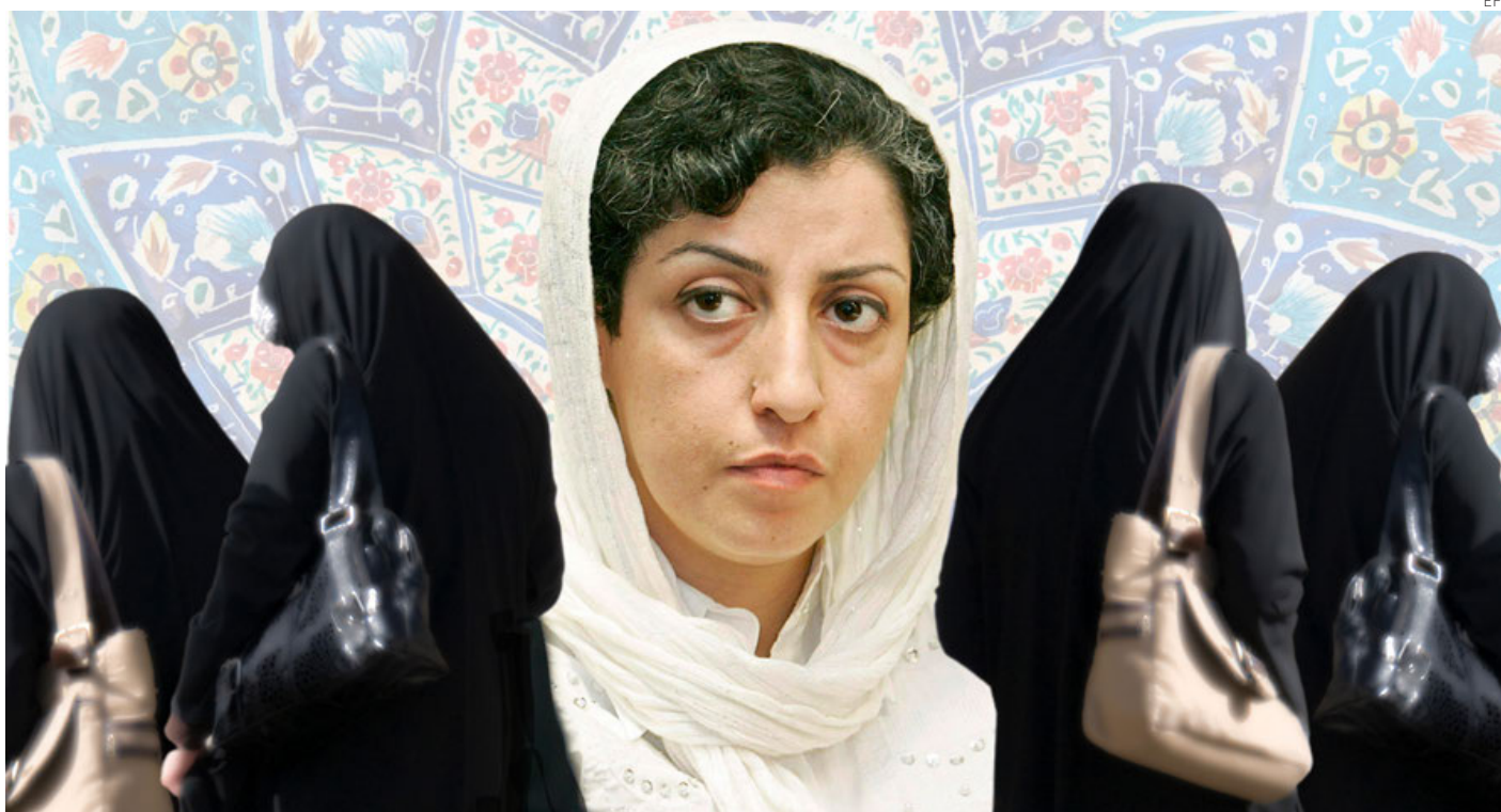
Narges Mohammadi, un símbolo de resistencia contra un régimen que reprime brutalmente a las mujeres.

Activista y periodista, fue reconocida por combatir la opresión y promover los derechos humanos pese a su reclusión