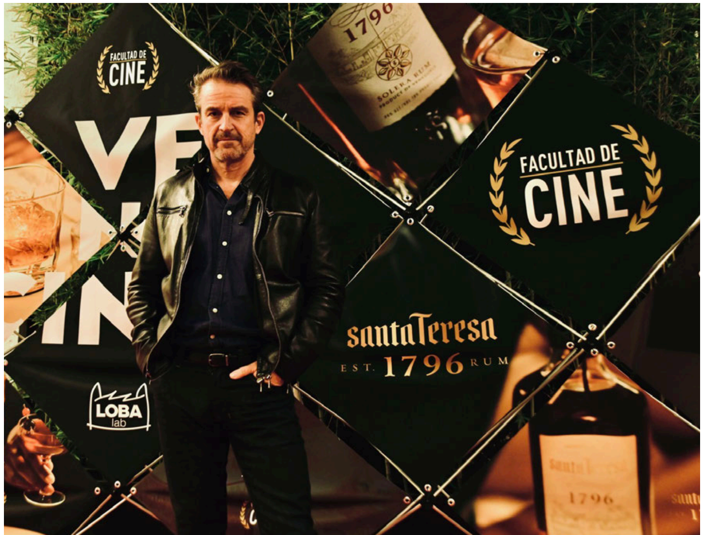
Imagen del cineasta en la muestra de Venezcine.

rector y guionista que este intercambio ha producido frutos para ambas naciones. “Creo que hay una cosa del venezolano que llega a México y se enriquece con la cultura de aquí, pero es curioso porque también le ofrece al país toda esa cosa del caribe que trae Venezuela, esa mezcla afroindígena que es también muy rica. Es una situación donde todos ganamos pues nos han recibido acá muy generosamente”, señaló.