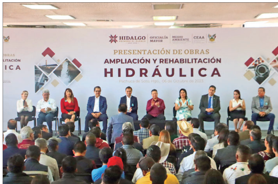
ECOS. Presentación de obras de ampliación y rehabilitación hidráulica para nueve municipios gracias a una inversión de más de 100 millones de pesos.

► Al diseñar Plan Estatal de Desarrollo la directriz fue que este Gobierno Estatal no tendría monumentos a la frivolidad; cambios