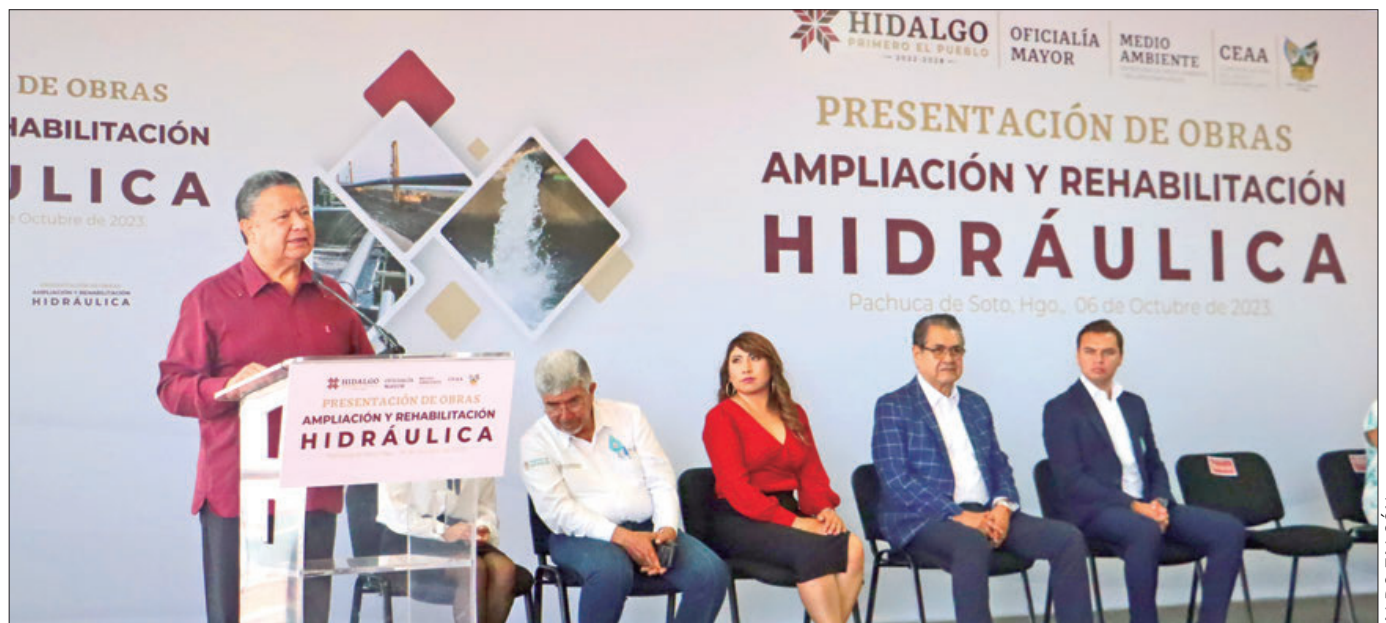
Presenta gobernador obras de ampliación y rehabilitación hidráulica para nueve municipios, gracias a una inversión de más de 100 millones de pesos.