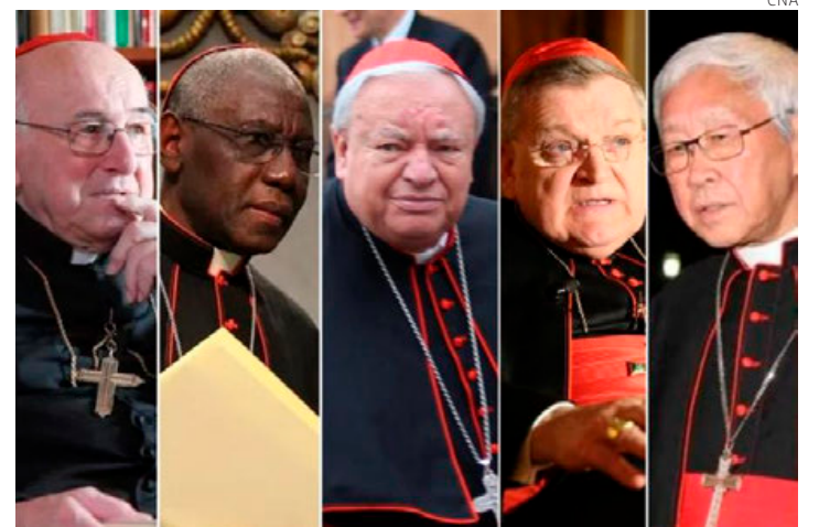
De izquierda a derecha, los cardenales ultras: Walter Brandmüller (Alemania), Robert Sarah (Guinea), Juan Sandoval Íñiguez (México), Raymond Burke (Estados Unidos) y Joseph Zen (China).