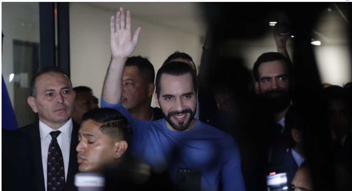
El presidente de El Salvador Nayib Bukele sale del Tribunal tras inscribirse como candidato a la presidencia.