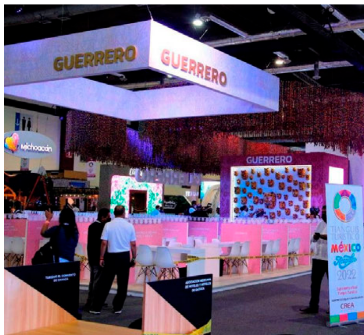
Será todo un reto la realización del evento, luego del paso de Otis y la destrucción que dejó en la infraestructura.

“Con el Tianguis Turístico México 2024 en Acapulco, mostraremos al mundo la capacidad de sobreponernos ante situaciones adversas y así tener la oportunidad de resaltar las bellezas y atractivos del país, a pesar de las dificultades”, afirmó.