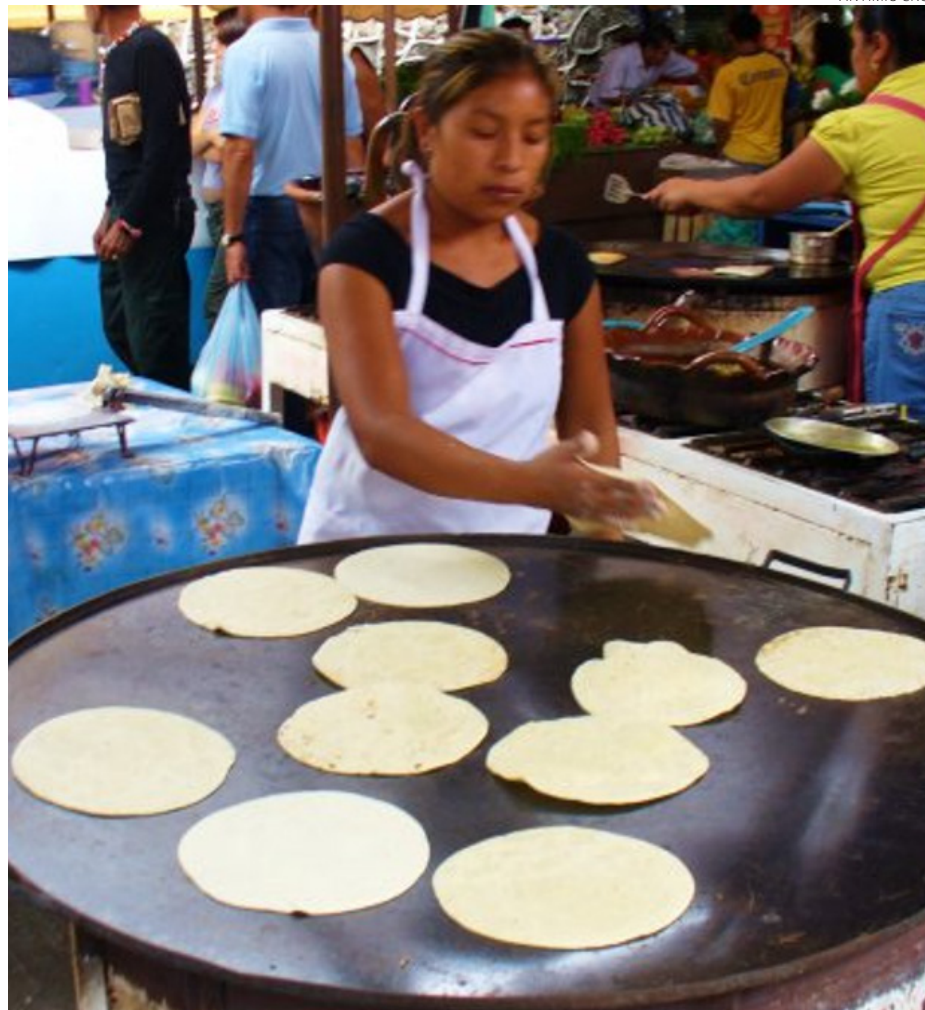
Estudiar el perfil nutricional de la tortilla de maíz es importante por ser un componente central en la dieta de la mayoría de los mexicanos.

Entre los datos más destacables del reporte de la investigación se pueden destacar los siguientes: 1) Las tortillas hechas con granos de maíces de alto rendimiento, híbridos y variedades, así como las tortillas hechas con granos de variedades criollas presentaron las mayores capacidades antioxidantes. 2) En cuanto al contenido de vitaminas: las tortillas elaboradas con harina de masa de maíz seca contenían entre 11.2 y 3.5 más veces vitamina B1, entre 18.6 y 7.8 más veces vitamina B2, y entre 2.7 y 5.3 más veces vitamina B3 que la de maíces híbridos y las variedades autóctonas, respectivamente. 3) Sólo en las tortillas