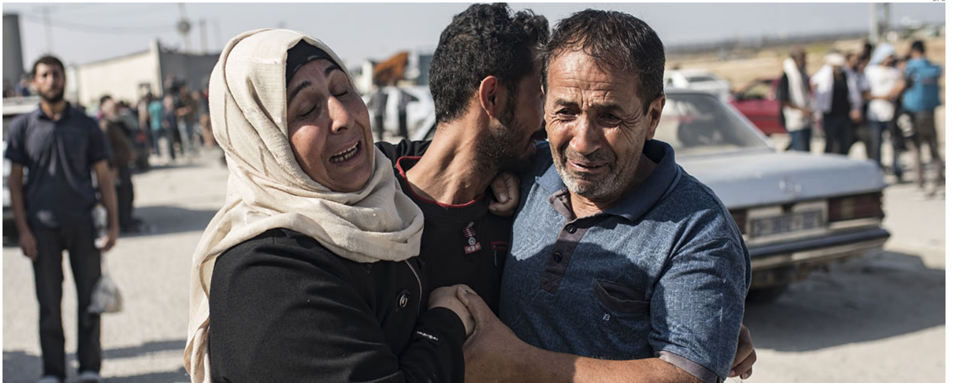
Palestinos llegando al cruce de Kerem Shalom después de haber sido devueltos a Gaza por Israel.