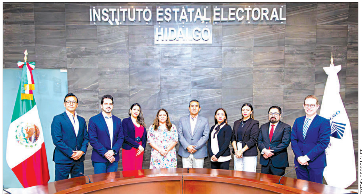
ACCIONES. La Junta Estatal Ejecutiva designará y supervisará al personal encargado que vigilará la aplicación del examen en el territorio estatal.

A la etapa de registros asistieron más de 900 hidalguenses, pero tras la revisión de los requisitos legales, administrativos y subsanar omisiones, dieron a conocer quienes aplicarán el examen general de conocimientos y habilidades