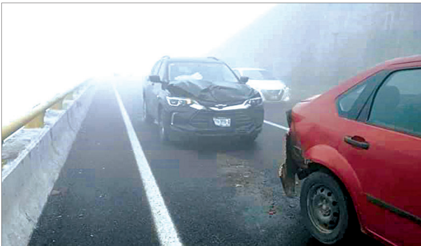
Un denso banco de neblina originó la poca visibilidad a los conductores quienes fueron protagonistas de un accidente múltiple en el puente Texcapa 1, de la autopista México-Tuxpan, en dirección a la Ciudad de México, entre los límites de Hidalgo y de Puebla.