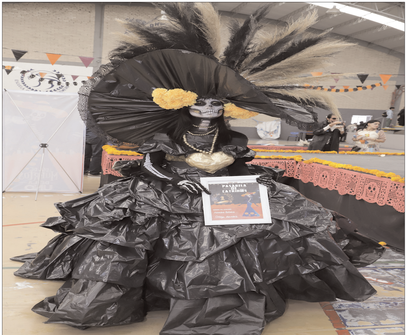
MENSAJE. Se invitó a las y los estudiantes a ser parte de este tipo de eventos que tienen como premisa la enseñanza de las tradiciones de México.

Con un total de 16 participantes es que se llevó a cabo la pasarela, donde cada una de las integrantes modeló el traje de su propia creación y tuvo que exponer al público asistente su inspiración, descripción e historia de la conformación del mismo, además de cómo se ligó a la temática "Elegancia mexicana en el Día de Muertos".