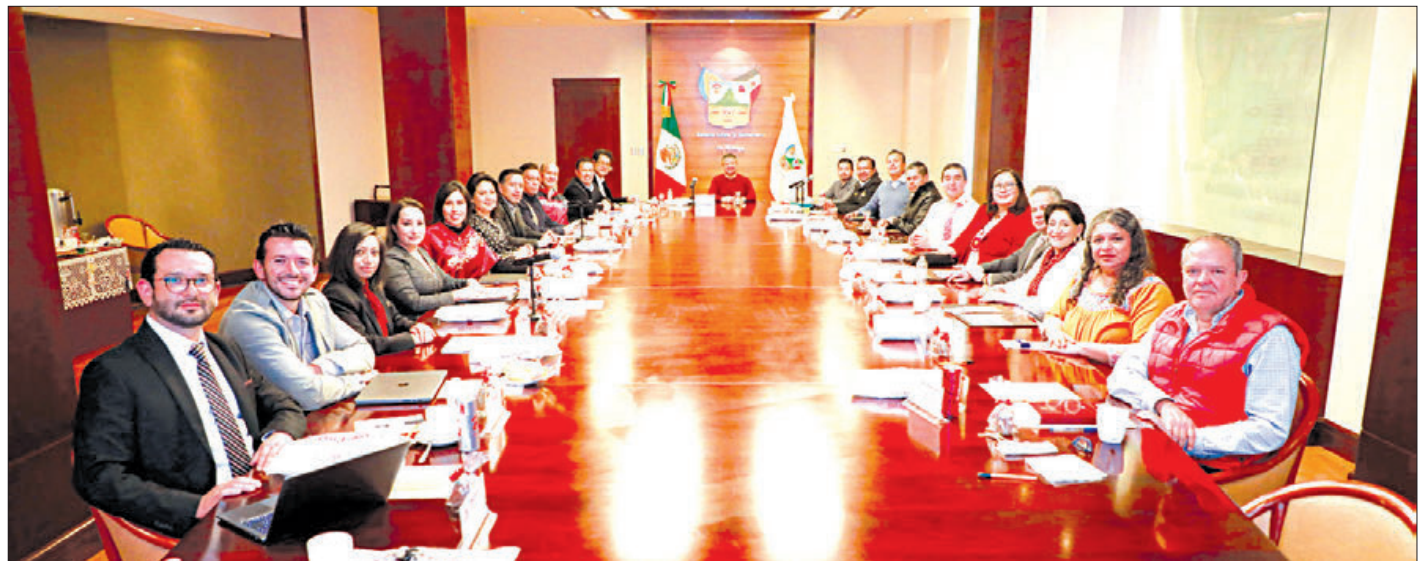
LEVANTAN MANO. Tras la última reunión de gabinete que sostiene el mandatario mensualmente, algunos secretarios formalizaron su pretensión de participar en el proceso interno.