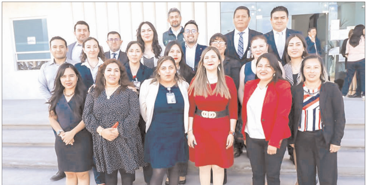
DATOS. El CCLEH atendió a 14 mil 484 trabajadores que solicitaron asesoría jurídica.

La directora general del organismo comentó que en el CCLEH se atendieron a 14 mil 484 trabajadores que solicitaron asesoría jurídica, con 6 mil 368 asesorías presenciales; 988 asesorías virtuales y 7 mil 128 asesorías telefónicas, desde el inicio de operaciones.