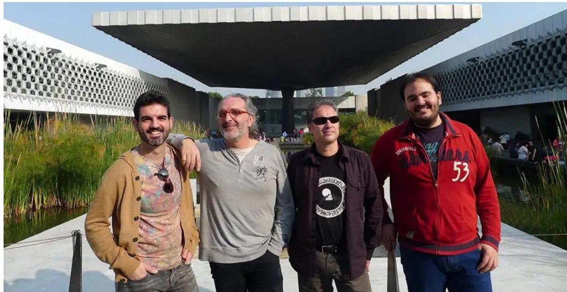
El cuarteto de saxofones SIGMA.

El propósito, según anuncia la agrupación en su comunicado oficial, es reivindicar a las compositoras, sobre todo las contemporáneas.