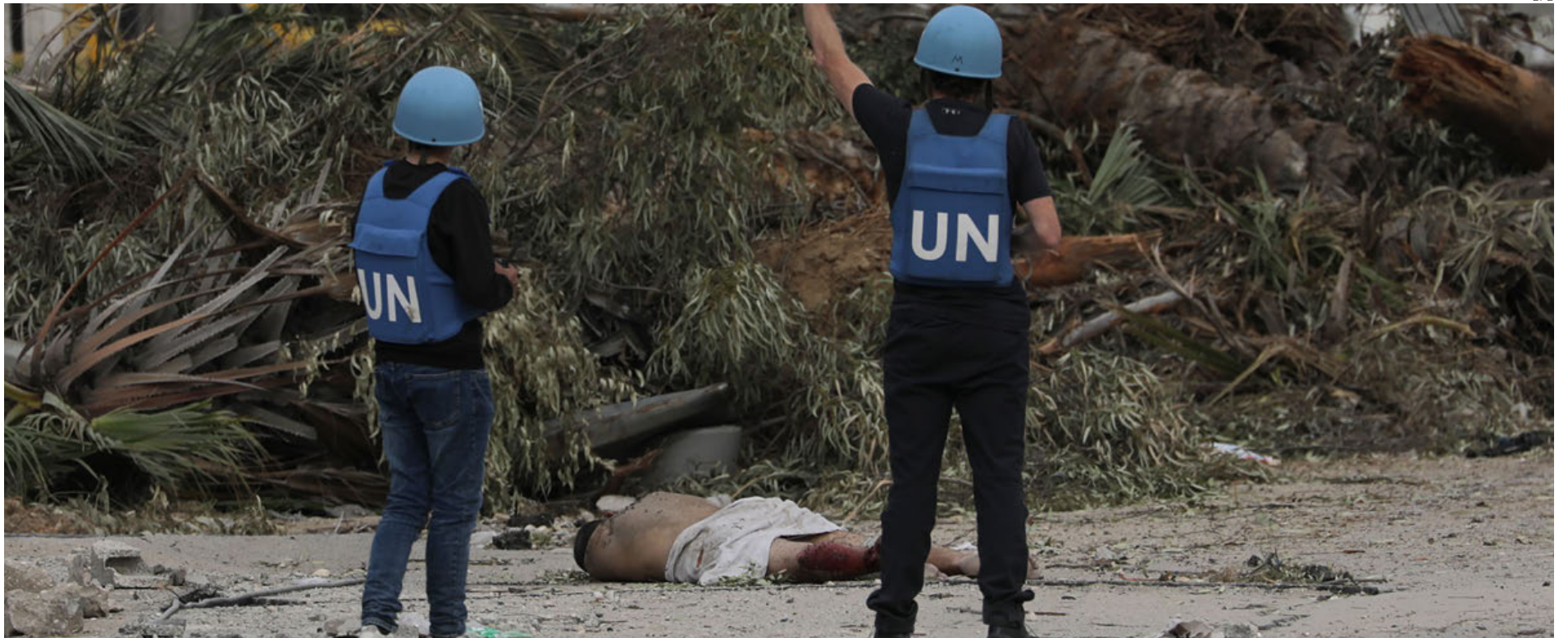
Trabajadores de la ONU ayudan a un herido. Hamás denunció operaciones de tiro contra muchos ciudadanos durante la tregua.