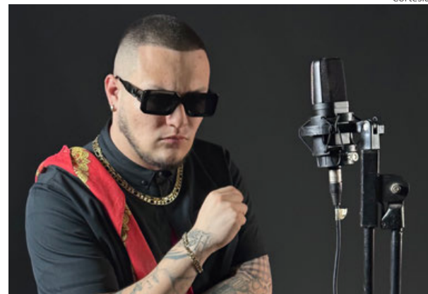
El rapero mexicano.

El rapero mexicano se encuentra estrenando este tema que habla sobre las modernas relaciones tóxicas