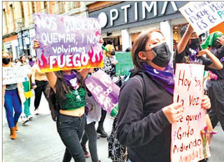
DENUNCIA. En Hidalgo se trabaja en todas las regiones para convencer a las mujeres de la importancia que es recurrir a las autoridades.

trabaja en todas las regiones para convencer a las mujeres de la importancia que es recurrir a las autoridades para la reducción de las agresiones tanto a menores como a mujeres desde adolescencia hasta edad avanzada e indicaron que por ello se tiene que ser firme en la difusión de mecanismos que les ayude recurrir a la herramienta jurídica con la que cuentan.