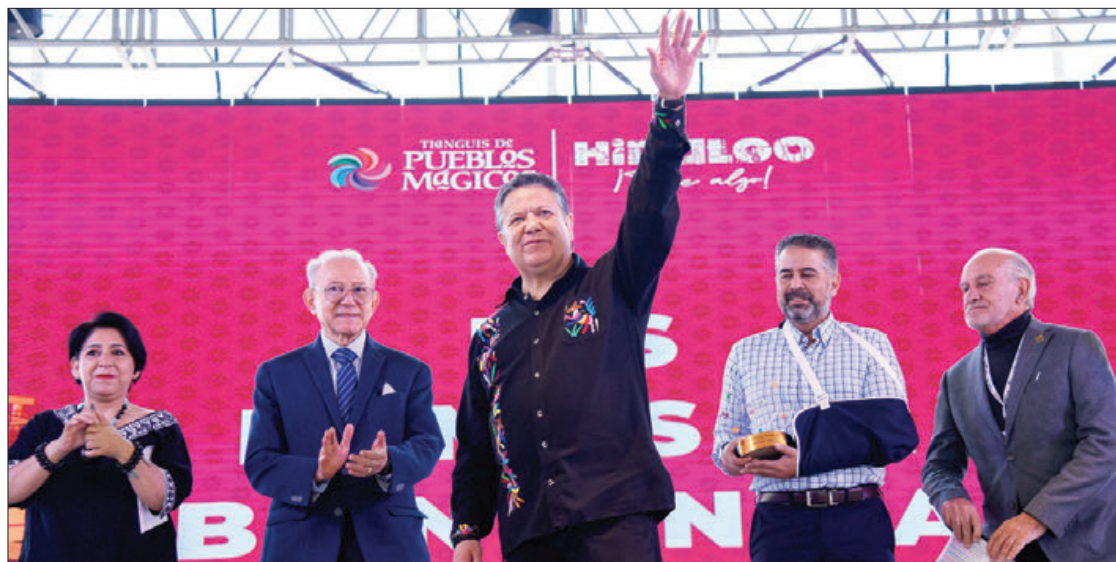
ACCIONES. Existen temas relevantes para establecer sinergias entre los gobiernos de Hidalgo, Ciudad de México y Estado de México.