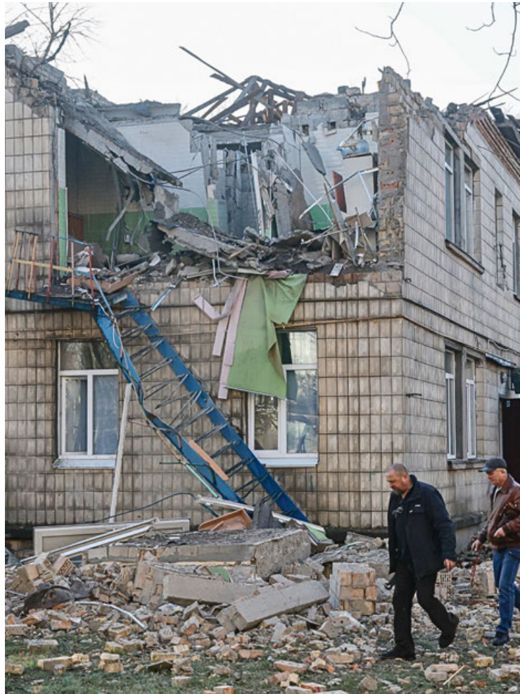
Escombros de una guardería tras los ataques con 60 drones en Kiev.

A pesar del número récord de drones utilizados, las defensas ucranianas lograron derribar la mayoría de ellos, interceptando 71 de los 75 drones