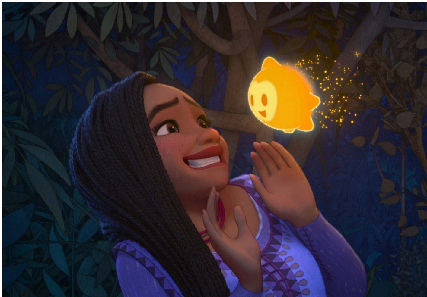
Fotograma del filme.

El guión, a cargo de Jennifer Lee y Allison Moore, nos sumerge en un mundo donde la animación 2D y 3D se fusionan, una técnica que ha sido recurrente en producciones recientes. Aunque esta combinación visual aporta una estética única, hay quienes podrían argumentar que no se aprovecha plenamente para