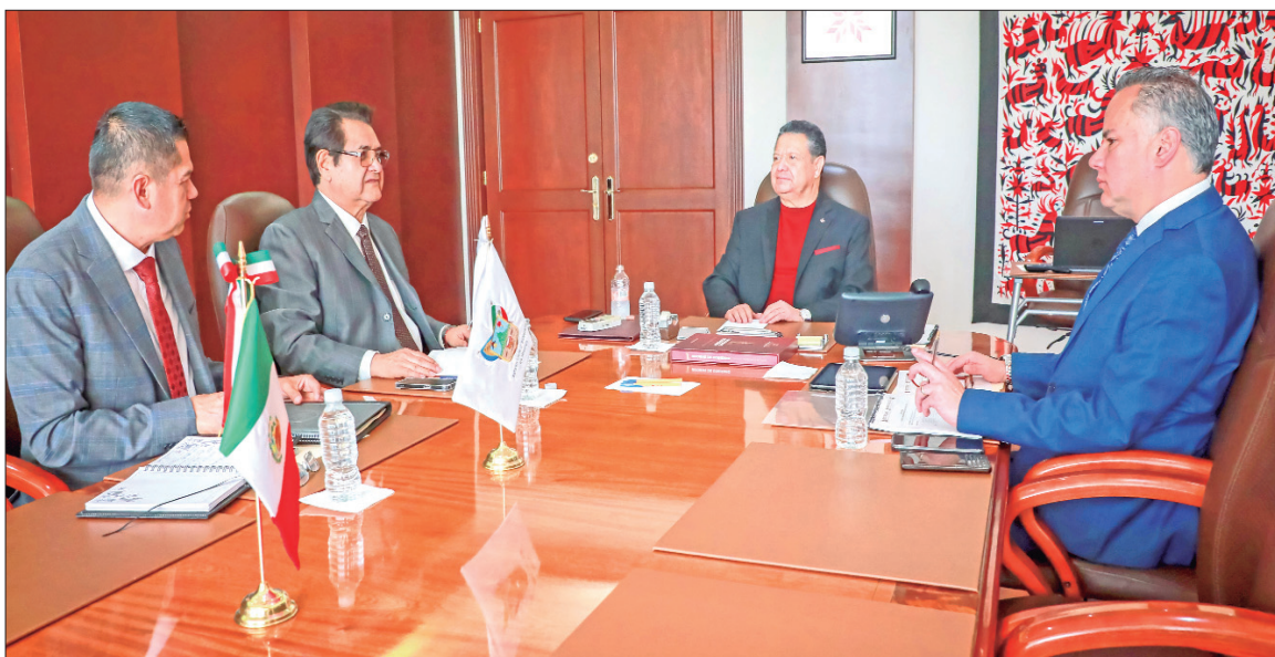
REUNIÓN SEMANAL. De la mano de la Guardia Nacional logramos coordinar de manera exitosa distintos operativos que nos permiten avanzar en la estrategia que busca garantizar la paz de Hidalgo. Estamos comprometidas y comprometidos con poder garantizar espacios seguros y

■ Para el próximo año, según información del Instituto Federal de Telecomunicaciones para la entidad una será para AM y otra FM, de uso comercial (de las 84 disponibles)