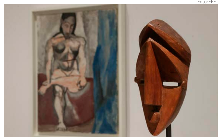
Una vista de la muestra.

«Se ha exagerado «Las señoritas de Avignon» con respecto a su aportación a la modernidad», señaló el comisario, cuando 1906 fue cuando Picasso transformó el concepto de «desnudo» por el de «cuerpo» y dio un papel relevante al masculino. (EFE en Madrid)