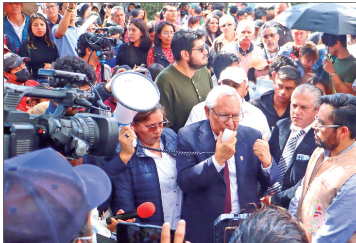
TONO. Presidencia del director general del Tecnológico Nacional de México, Ramón Jiménez López, con alumnos paristas del campus Pachuca no tuvo resultados.

En tanto los estudiantes inconformes del Tecnm, Campus Pachuca, señalaron que la exigen-