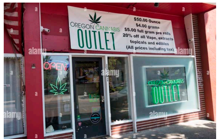
Dispensario de Marihuana en Oregon.

Uno de cada 20 adultos de 18 años o más tuvieron pensamientos suicidas serios (13.2 millones o 5.2%), de los que 1.6 millones (0.6%) intentaron quitarse la vida. El porcentaje entre adolescentes (de 12 a 17 años) es incluso mayor: 3.4 millones tuvieron pensamientos serios de suicidio (13.4%), mientras que unos 953 mil (3.7%) lo intentaron.