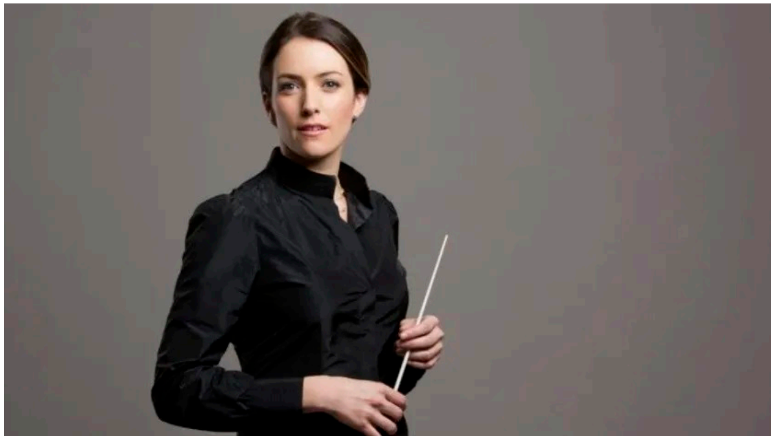
La directora de orquesta, Alondra de la Parra, presentó la tercera edición del festival.