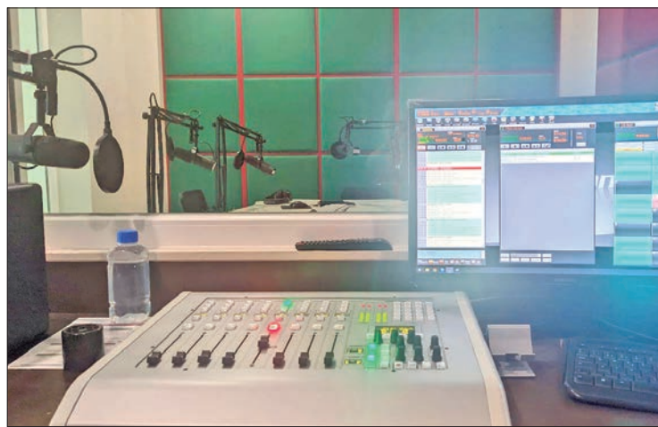
BALANCE. Rumbo al próximo año ya son al menos 99 postulaciones de la entidad de 477 del país, aunque sólo disponen de 84 frecuencias y únicamente dos corresponden al territorio hidalguense.

La Unidad de Espectro Radioeléctrico (UER) de la Unidad de