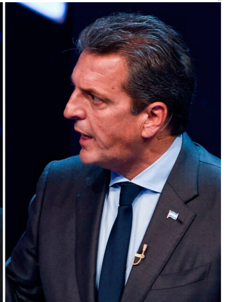
Javier Milei y Sergio Massa durante el debate; sus rostros lo dicen todo.

Thatcher es tu ídola?”, preguntó Massa a un titubeante Milei, refrescando así la memoria a los argentinos sobre aquella vez que el candidato ultra declaró que uno de sus personajes favoritos de la historia es la Dama de Hierro, la misma que ordenó el hundimiento del buque Belgrano durante la guerra de las Malvinas, matando a más de 300 marinos argentinos.