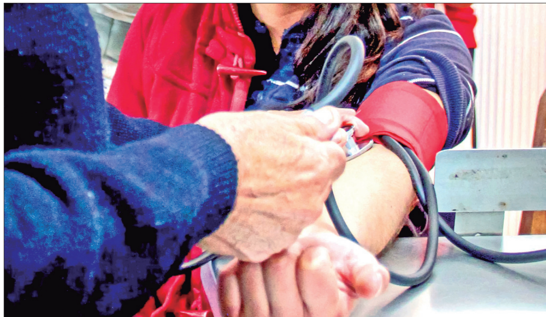
ACCIÓN. SSH mantiene acciones de atención integral a personas con este padecimiento.

Según datos de la Subdirección de Epidemiología de la SSH, al corte de septiembre 2023, de forma preliminar se han realizado 143 mil 952 estudios de detección de diabetes, de las cuales 17.95% resultaron positivas, es decir, en lo que va del año en Hidalgo, se han detectado 8 mil 649