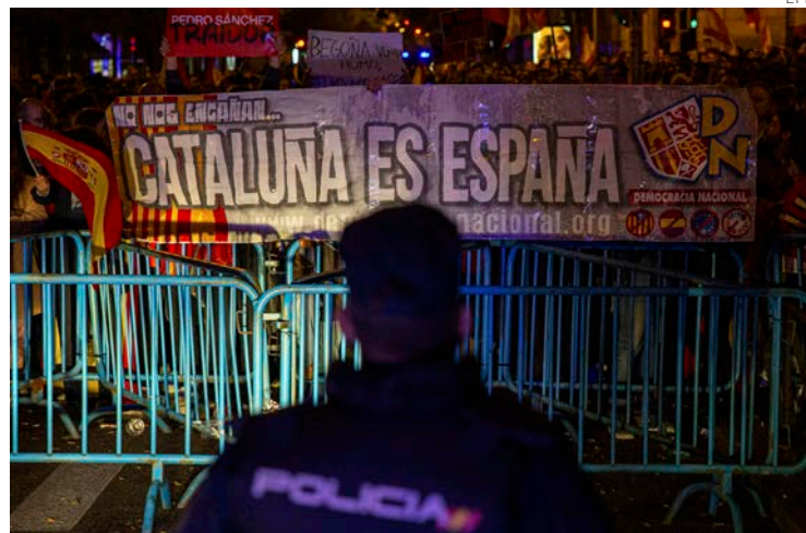
Manifestantes de organizaciones franquistas y de extrema derecha se manifiestan en Madrid contra la amnistía a los separatistas catalanes.

Tal y como pedían los partidos independentistas de Cataluña, el gobernante ERC y Junts, del prófugo Carles Puigdemont, para apoyar un nuevo mandato de cuatro años de Sánchez, el proyecto de ley de amnistía se