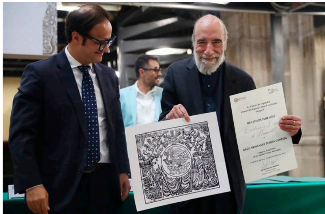
Raúl Zurita recibió el reconocimiento a la Excelencia en letras y humanidades, distinción que por primera vez entrega el poder legislativo.

El poeta recibe homenaje y el reconocimiento a la Excelencia en letras de la Cámara de Diputados