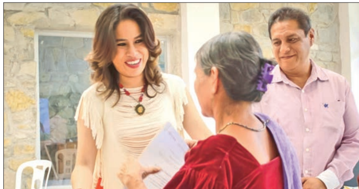
COBERTURA. Participaron 197 personas en las categorías de Alfarería y Cerámica, Fibras Vegetales, Textiles y Talla en Madera.

cada rama hubo participación, por lo que se repartirán 140 mil pesos divididos en 38 premios de las categorías de: Alfarería y Cerámica, Fibras Vegetales, Textiles y Talla en Madera.