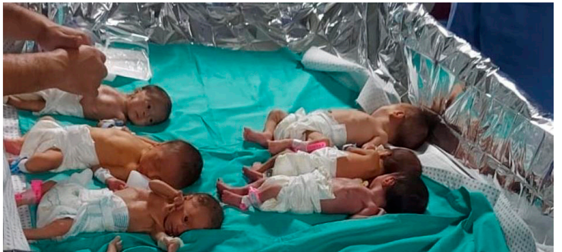
Bebés prematuros en el Hospital de Al Shifa, asediado por el Ejército israelí.

"Algunos desplazados internos, personal y pacientes han conseguido huir, pero otros siguen atrapados dentro", subraya el documento, recordando que está en