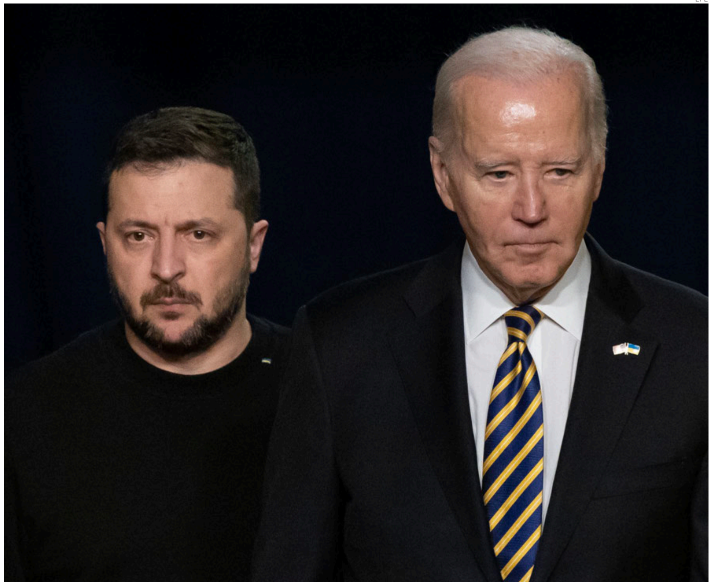
Biden y Zelenski, con cara de haber perdido la guerra, tras escuchar el "no" republicano a la liberación de fondos para ayudar a Ucrania.

"Lo que la Administración de Biden parece estar pidiendo son miles de millones de dólares adicionales sin una supervisión adecuada, sin una estrategia clara para ganar", dijo Johnson tras reunirse con Zelenski, en un claro gesto de que el