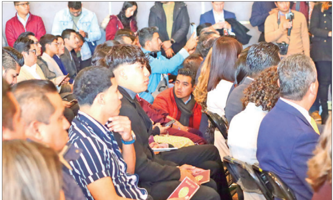
MARCOS. Durante la entrega del Premio al Mérito Deportivo 2022 y 2023, el gobernador dio a conocer que en este encuentro galardonaron a 63 atletas y 20 instituciones del año 2022, mientras que 76 deportistas recibieron este reconocimiento en 2023, llevando el nombre de Miguel Ángel Cruz Moreno para el año 2022 y el de Gabriel Cuéllar Valdez para el 2023.

Añadió que el camino al éxito requiere disciplina, dedicación y constancia, por lo que exhortó a las y los integrantes de la comunidad deportiva a seguirse esforzando para defender a nuestro estado y a nuestro país en cada competencia, ya sea ésta local, nacional o internacional.