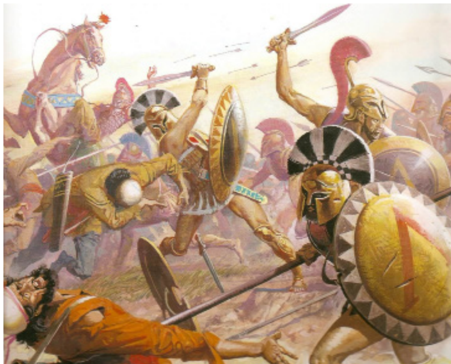
Las guerras y disputas eran por la conquista de territorios y el poder.

Un fanático tiende a ser adverso al conocimiento, la ciencia y la inteligencia porque éstos se abren paso a través de la duda, del cuestionamiento