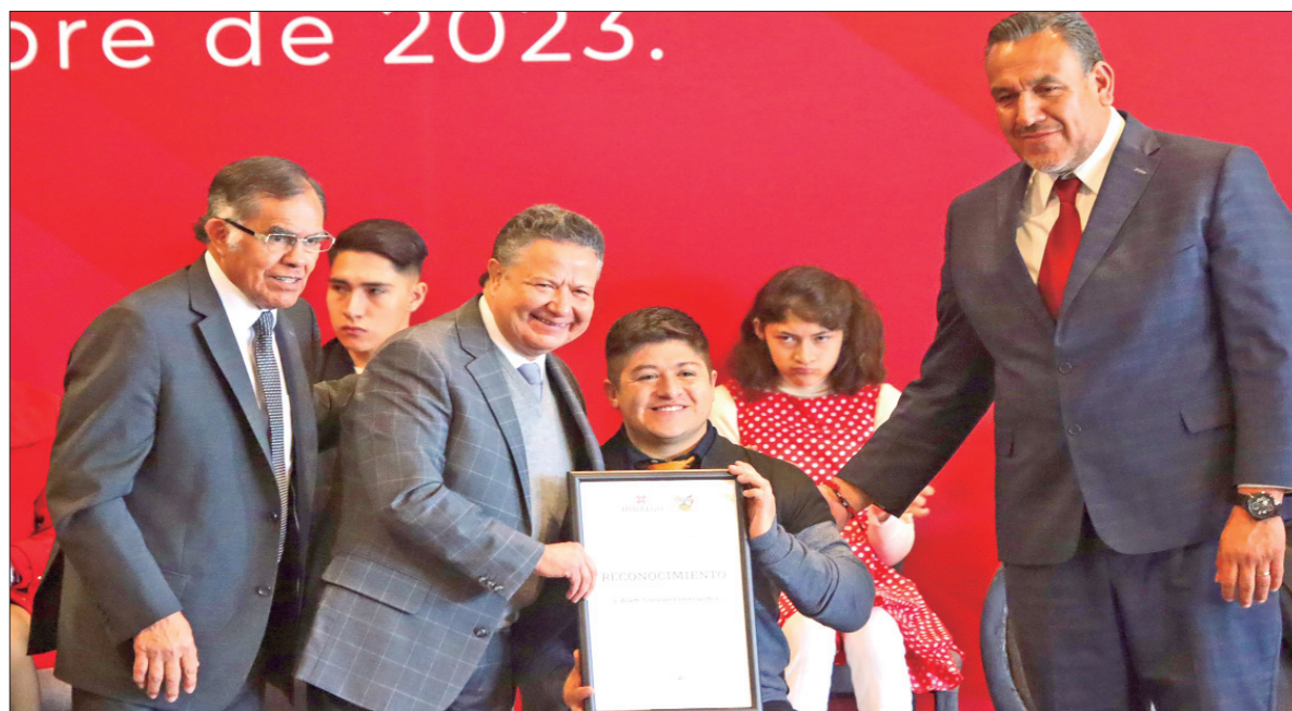
Encabeza jefe del Ejecutivo entrega del Premio al Mérito Deportivo 2022 y 2023.

■ Indica gobernador que en el pasado ciertos sectores fueron considerados como de 2ª, hoy el reto es incorporarles a la dinámica que maneja la estructura gubernamental