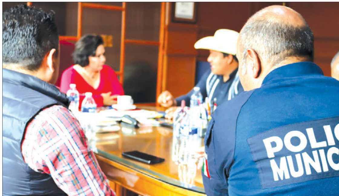
SITUACIÓN. En la región de Valle del Mezquital, no son los únicos municipios donde se han visto rebasado por el tema de inseguridad.

A fin de dar atención a esta demanda ciudadana, los alcaldes de ambos municipios se reunieron con el propósito de dar seguimiento a los acuerdos en materia de seguridad, donde revisaron y reafirmaron los compromisos para el trabajo coordinado entre ambas demarcaciones.