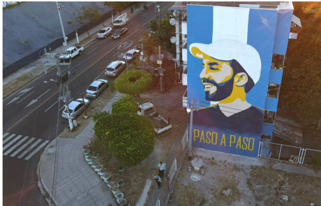
Foto aérea de un mural alusivo al presidente Nayib Bukele.

Con el régimen de excepción, una medida de seguridad implementada por el Gobierno de Bukele desde marzo de 2022 para combatir a las pandillas, se suspende el derecho a la defensa de las personas detenidas, la inviolabilidad de las telecomunicaciones y se extiende el plazo de la detención administrativa a un máximo de 15 días.