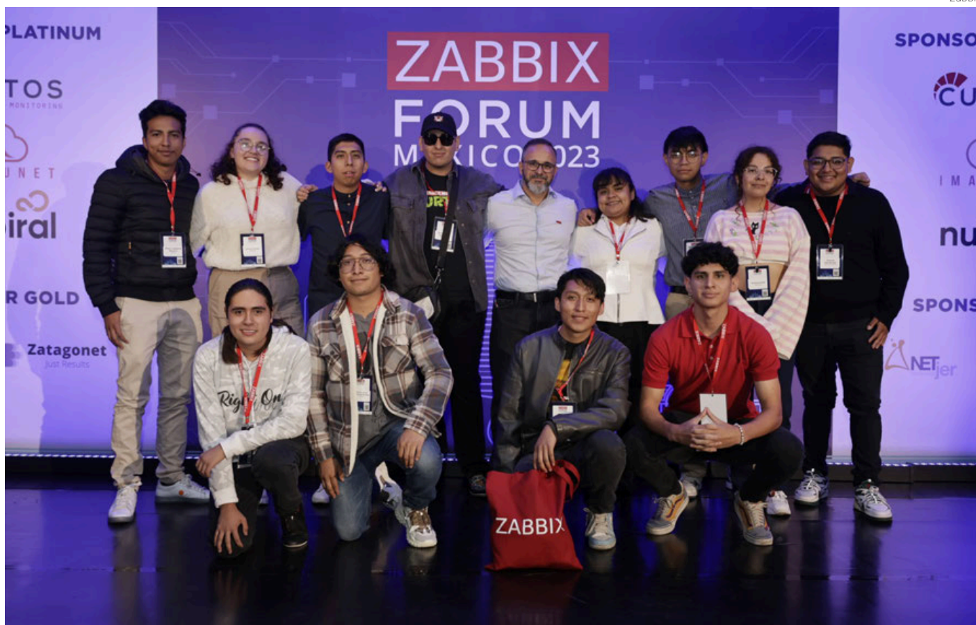
Desde 2023 Zabbix ha organizado eventos para fomentar el uso de software de código abierto entre jóvenes mexicanos que desarrollan programas.

El evento promueve entre las nuevas generaciones uso de software sin costo para resolver problemas industriales, tecnológicos y sociales