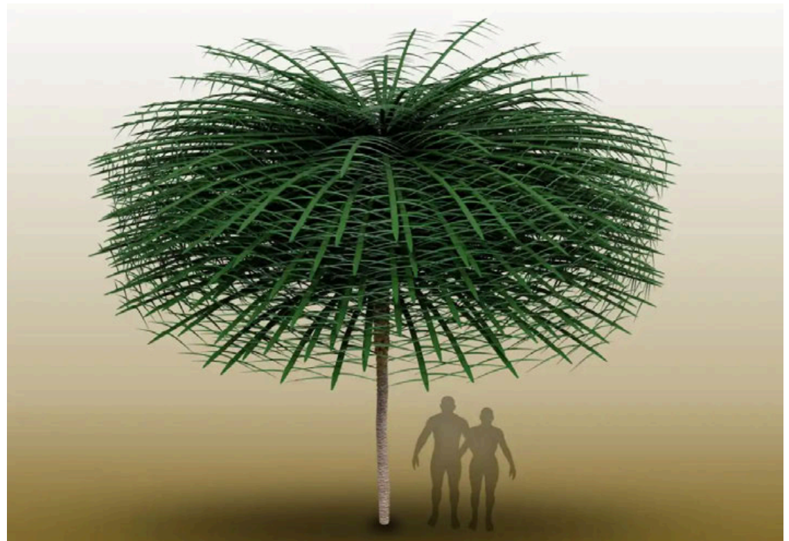
Modelo de Sanfordiacaulis con estructura de ramificación simplificada para una visualización más sencilla. Tenga en cuenta que los humanos se proporcionan para la escala, pero no existieron al mismo tiempo que el árbol.

Es uno de los pocos en un registro fósil que abarca más de 400 millones de años en el que