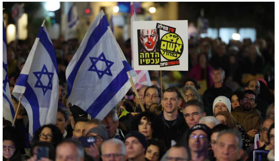
Israelíes con un cartel que representa a Netanyahu, y que lo denuncia como “culpable”.

De las 136 personas que se estima siguen en manos de Hamás tras el brutal ataque que perpetró el grupo islamista en suelo israelí el pasado 7 de octubre, al menos 27 de ellos ya estarían muertos, según datos de inteligencia, algunos incluso a causa de fuego israelí du-