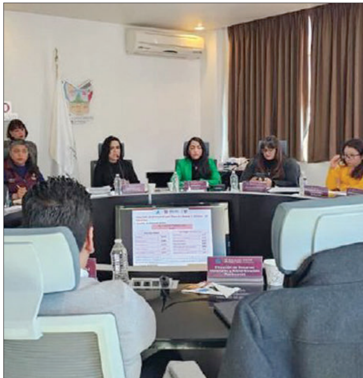
PROCESOS. Los Comisarios Públicos realizarán una exhaustiva revisión de la carpeta ejecutiva de los organismos descentralizados.

políticas públicas, garantizar la racionalidad y transparencia en la aplicación de los recursos, pues dichas medidas están orien-