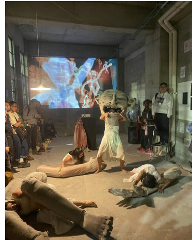
Tres de las propuestas que ha presentado la feria de arte colectiva e independiente QiPO.

Del 5 al 11 de febrero habrá exposiciones, performances, venta de obras, instalaciones y música en distintos recintos