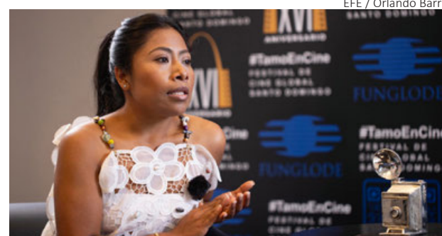
La actriz Yalitza Aparicio.

Por ello, subrayó la importancia de permitirse soñar, luchar por