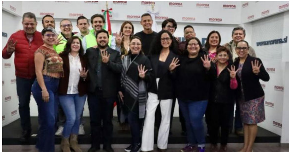
Morena presentó a sus nueve candidatos para las nueve alcaldías de la CDMX

A unos días de que se cumpla el plazo para que los partidos registren sus candidatos a las alcaldías, Morena publicó sus candidatos para Azcapotzalco, Coyoacán y Tlalpan, con lo que suman nueve demarcaciones con perfiles definidos rumbo a las elecciones del 2 de junio.