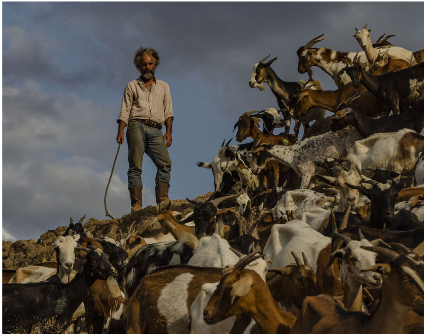
Fotograma del filme.