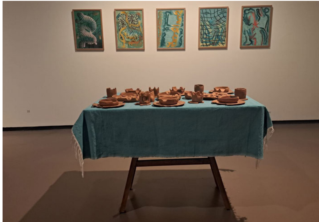
Una sala de la exposición en San Ildefonso.

Con esta exposición, la Fundación Casa Wabi comienza su festejo de 10 años, a lo largo de los cuales ha presentado exhibiciones, residencias, introducción al barro,