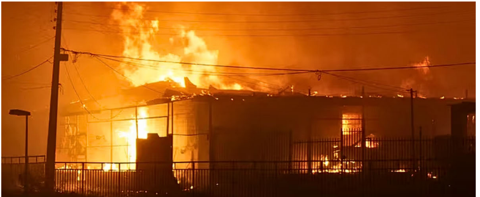
Chile vive la ola de incendios más mortífera de los últimos tiempos.