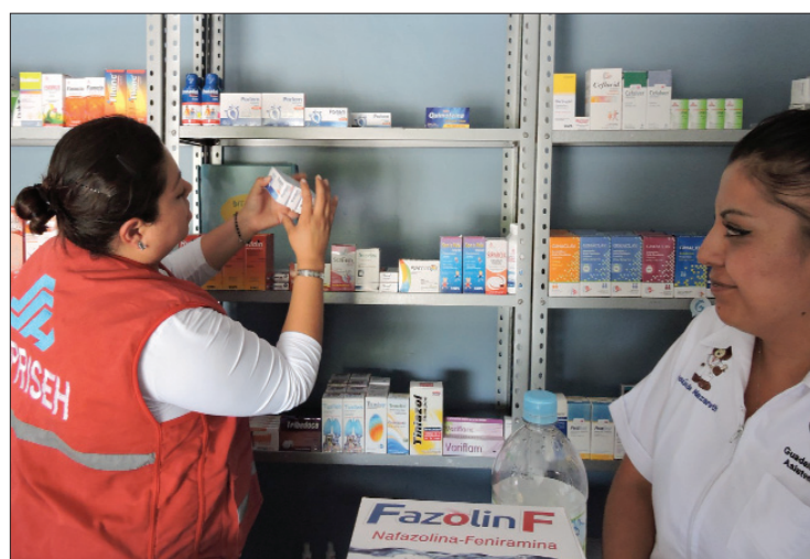
ACCIONES. Se procedió al aseguramiento y destrucción de productos decomisados en 170 establecimientos.

De acuerdo con la dependencia, en total se incautaron 38 mil