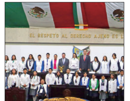
Durante la sesión ordinaria del Segundo Congreso Juvenil Hidalgo 2024, el titular del Poder Ejecutivo en Hidalgo, reconoció el esfuerzo de las y los participantes, a quienes conminó a seguir incursionando en la vida pública y política de la entidad.

■ Requieren inversión económica importante: más de 400 millones (lo doble de lo inicial) .5