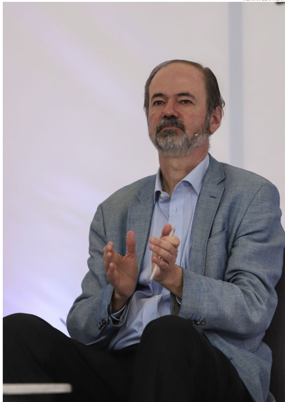
Juan Villoro la conferencia “Conquista y contraconquista: los recursos del idioma” que inauguró la Fiesta del libro y la rosa 2024.

“Aun así existen 68 sistemas lingüísticos, lo sorprendente no es que la diversidad lingüística esté desapareciendo, es que siga existiendo”, agregó en referencia a que existe un lingüicidio desde el momento en que se buscó unificar al país a través del español.