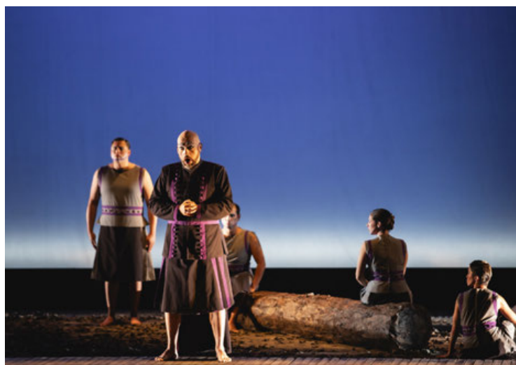
Una de las escenas de la ópera “Parsifal”.

En conversación previa al anunciado estreno, Sergio Vela indicó que “Parsifal” fue pieza clave en la consolidación del Festival de Bayreuth –“que además es la piedra fundacional de los festivales del mundo moderno”- fundado por el mismo Wagner para difundir su obra.