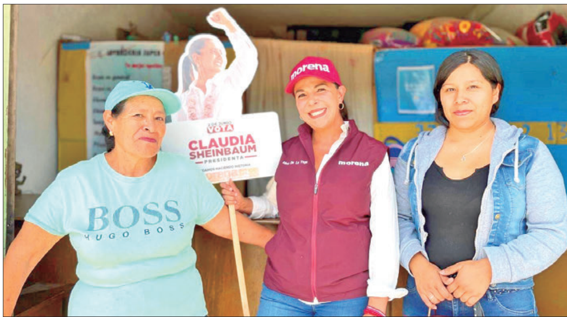
ICONO. Ratificó su compromiso de llegar al Congreso de la Unión: legislar en favor de las mujeres.

"Vamos de la mano con las propuestas de la futura presidenta de México, Claudia Sheinbaum, para abordar la violencia de género desde la prevención y la denuncia, mediante el seguimiento de procesos de impartición de justicia y la instauración de un programa nacional de apoyo legal hacia la mujer en las agencias del Ministerio Público", indicó la aspirante.