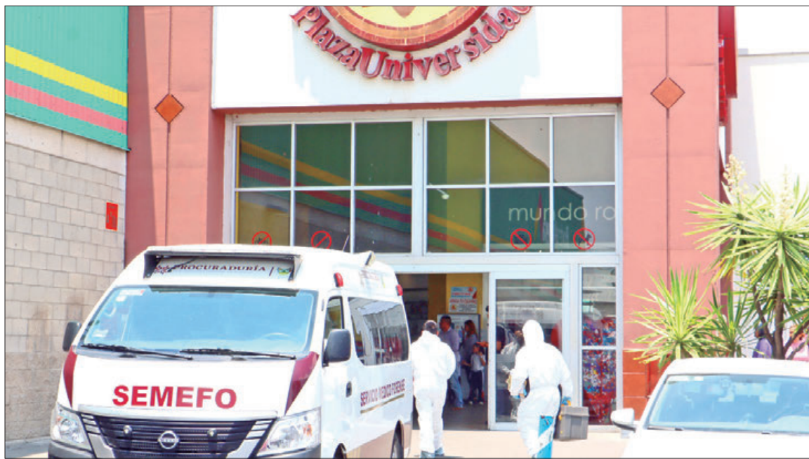
Un sujeto, aparentemente, decidió quitarse la vida, al interior de Plaza Universidad. De acuerdo con la Policía Municipal Mineral de la Reforma, mediante una llamada de emergencia, avisaron sobre un sujeto agresivo en el área de Electrónica, quien en sus pertenencias llevaba un cuchillo y amenazaba con matarse.

■ Aunque este 20 de abril inician campañas, muchos contendientes esperaban todavía aprobación del pleno ■ IEEH determinará procedencia o no de las más de 400 planillas