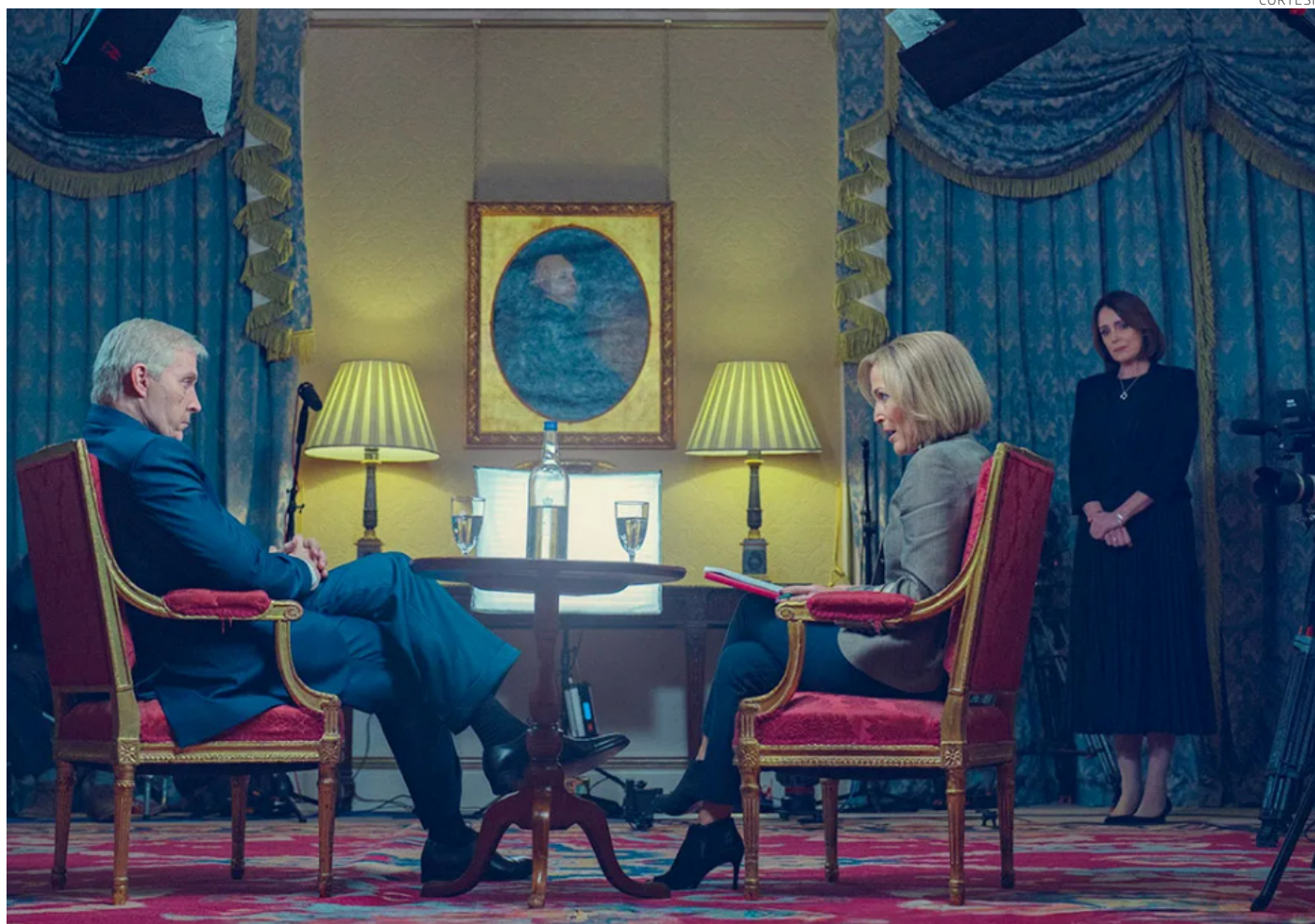
Fotograma del filme.