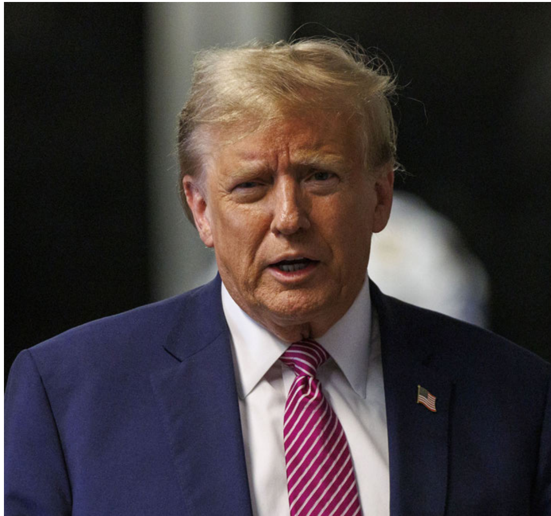
Donald Trump en el Tribunal Penal de Manhattan en Nueva York.

Sin embargo, hubo otros candidatos que fueron descartados tras asegurar que sufrían ansiedad o "dudas" ante