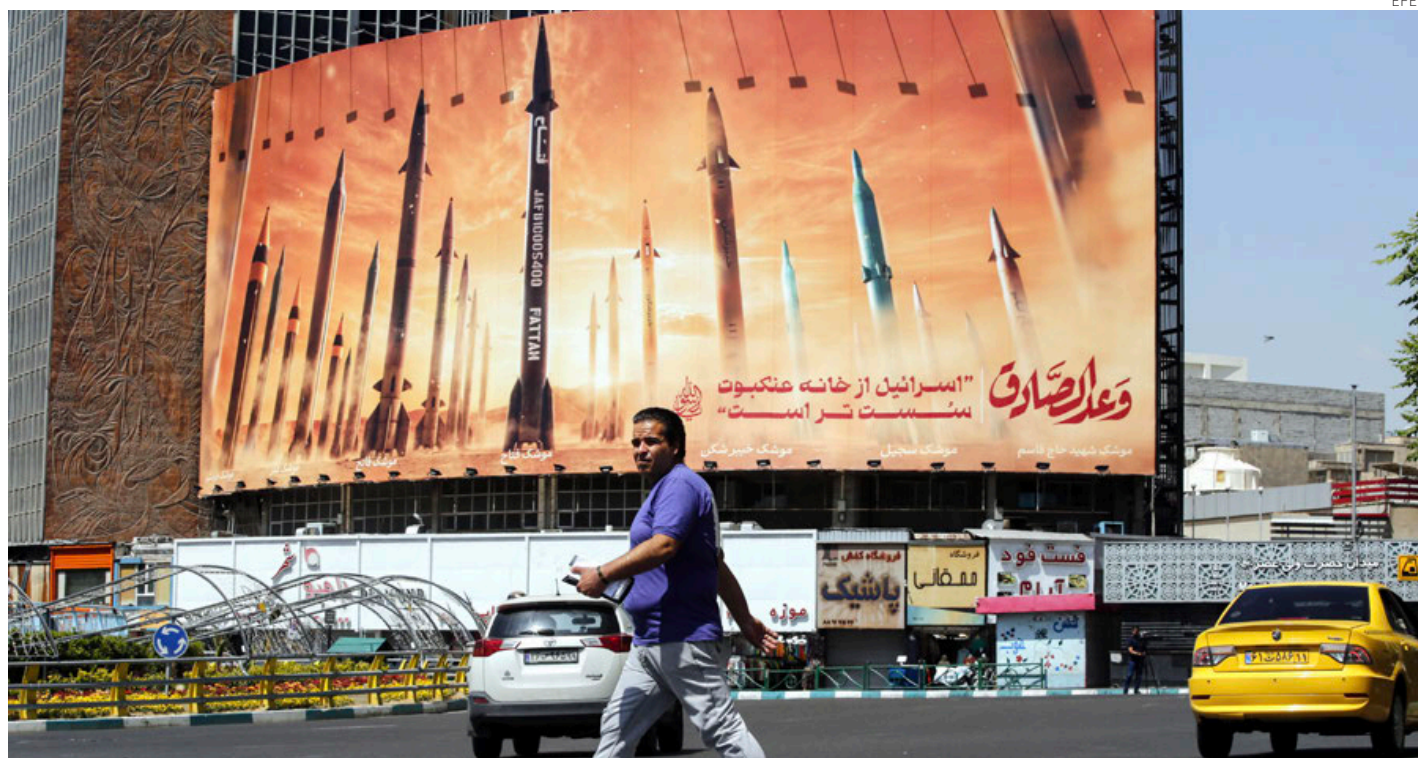
Un hombre iraní frente a un cartel antiisraelí con la frase: “Israel es más débil que el hogar de una araña”.

Por su parte, el Organismo Internacional de Energía Atómica (OIEA) confirmó este viernes que no se han producido daños en las instalaciones nucleares de Irán tras el ataque realizado por Israel contra el centro del país.