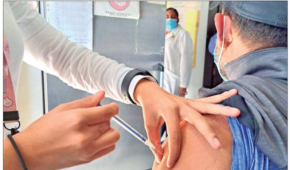
TORRENTE. La Secretaría de Salud de Hidalgo indicó que las actividades iniciaron el 1 de abril y finalizan el 31 de mayo próximo.

Recordó que las personas deben recibir de manera oportuna las vacunas, ya que les permite protegerse de las enfermedades como son sarampión, rubéola y poliomielitis.