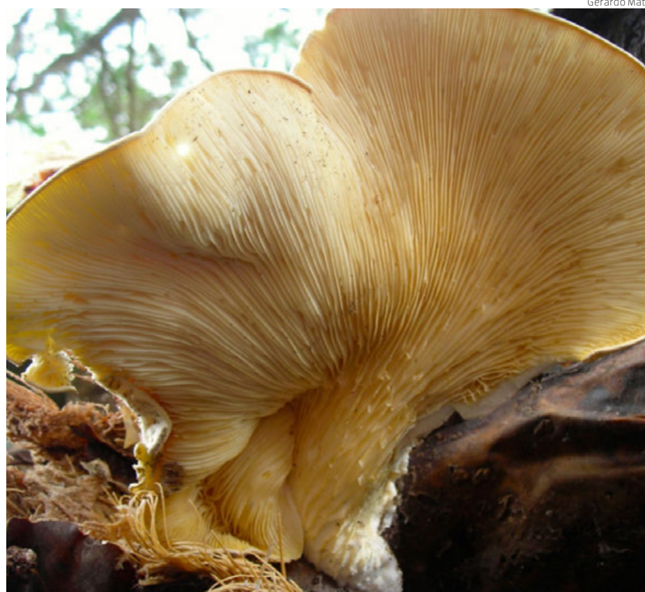
Ejemplar de Pleurotus agaves creciendo silvestre en una penca de maguey pulquero ( Agave salmiana ).

Una de estas especies es Pleurotus agaves , conocido como el “hongo del maguey” en Puebla y Veracruz, “t’axjot’a” en la región ñaño de Hidalgo o “mesonacatl” en Tlaxcala. El hongo del maguey es una especie endémica de México que puede encontrarse en el Altiplano mexicano en regiones de templadas a frías como el Estado de México, Hidalgo, Jalisco, Puebla, Tlaxcala y Veracruz (Figura 1). Suele crecer sobre pencas de Agave salmiana (maguey pulquero) de donde emerge entre las hojas secas de la base de la planta, se caracteriza por tener un estípote (pie) largo de color café-vino, aterciopelado en la base, con láminas delgadas, decurrentes muy juntas entre sí y un píleo (sombrero) liso con escamas ligeramente coloreadas de forma petaloide. Bajo condiciones de cultivo, los hongos presentan características diferentes a aquellos encontrados en estado silvestre, ya que sus cuerpos fructíferos son blanquecinos a ligeramente amarillos y crecen de forma solitaria. Su sabor es atractivo al paladar, sin embargo, al igual que muchas especies silvestres sólo se encuentra y comercializa en mercados locales del centro del país y