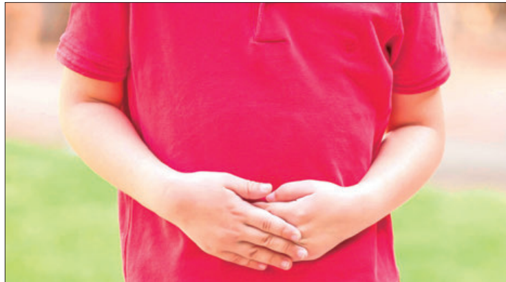
CONDUCENTE. Los padres de familia o personas que tengan bajo su responsabilidad a menores deben prestar especial atención.

Para prevenir las infecciones gastrointestinales en niños, es fundamental fomentar hábitos de higiene adecuados,