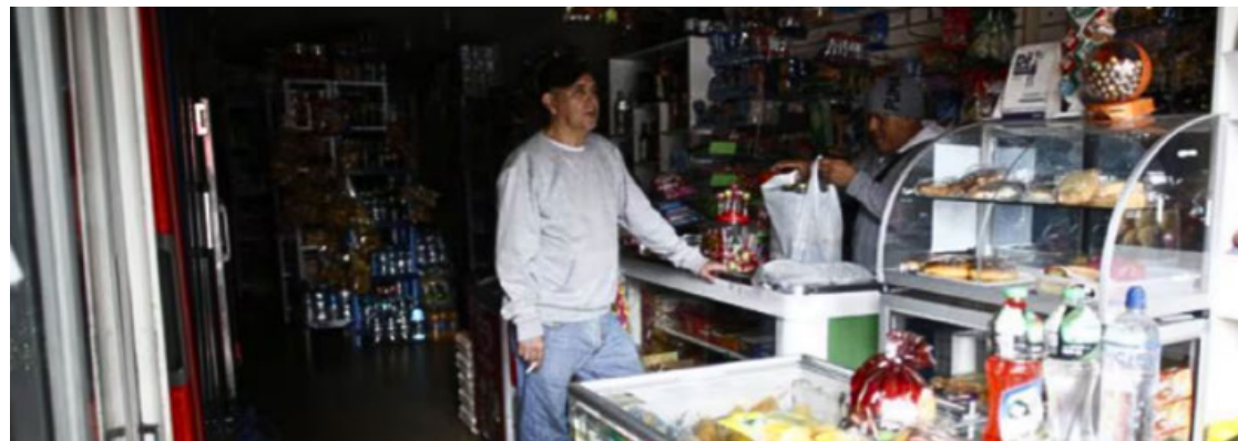
Ecuador sufre apagones diarios en diferentes zonas de hasta ocho horas.

Desde el domingo pasado Ecuador sufre apagones diarios en diferentes zonas de hasta ocho horas de duración, al haberse quedado sin el nivel suficiente de agua el embalse de Mazar, el segundo más grande del país, que permite operar un complejo de tres centra-