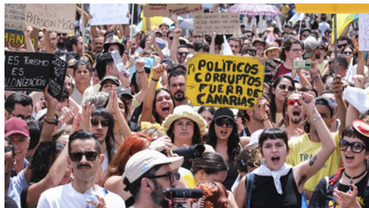
Miles se manifestaron contra el turismo irresponsable bajo el lema "Canarias tiene un límite".

Las calles en las ocho islas de Canarias (Atlántico) se vieron repletas de inconformes por el turis-