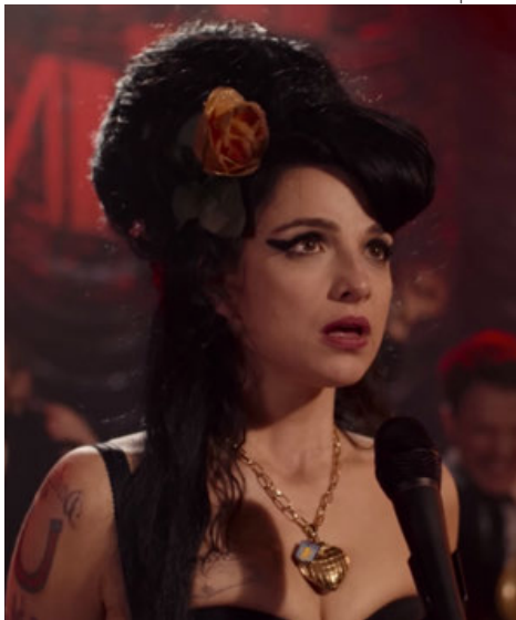
Fotograma del filme.