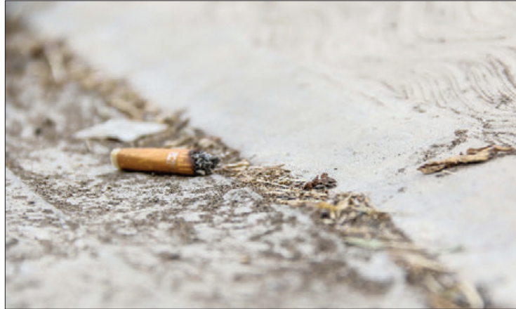
MECÁNICA. Existe un protocolo que deben cumplir ciertos establecimientos para acceder a dicho reconocimiento.

- Contar con letreros en las entradas que indiquen la prohibición de fumar o tener encendidos productos de tabaco o nicotina.