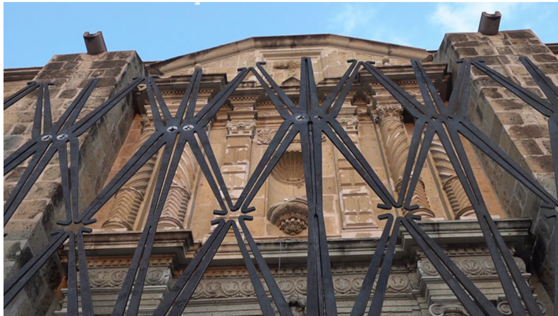
La reja que protege el templo de San Felipe Neri.

“El maestro siempre hace falta en Oaxaca, cuando terminamos y continuamos con los pro-