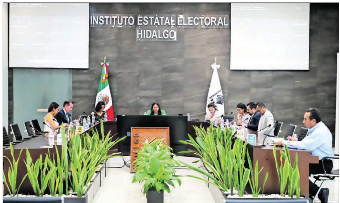
GASTO. El Consejo Electoral se integra de una presidenta que percibe 70 mil pesos mensuales (de forma bruta), así como de seis consejeros electorales que cada uno recibe 60 mil pesos mensuales (de forma bruta).

Sin embargo, esto no ocurrió y las y los consejeros electorales decidieron levantar la sesión del pasado viernes 19 de abril y decretar un receso para las 18:00 horas de ayer 20 de abril, aunque