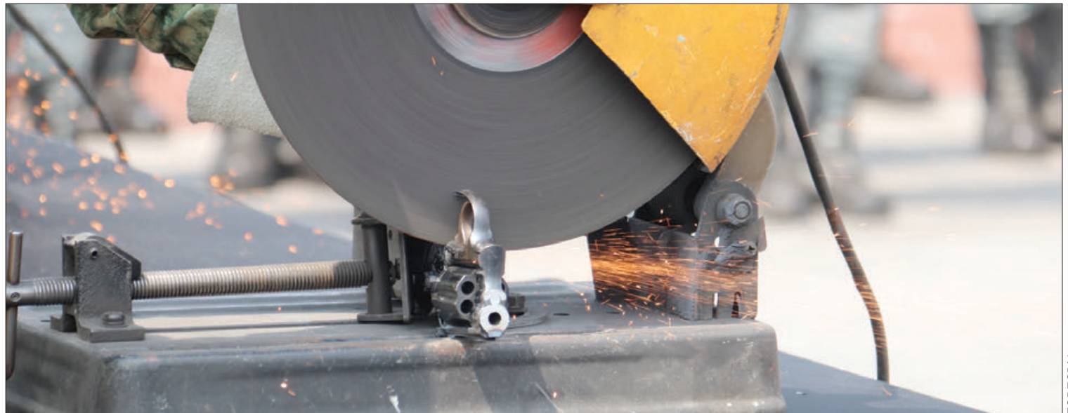
PRESENCIA. El evento contó con la participación de instancias de los tres niveles de gobierno.

El evento contó con la participación de los titulares de la Secretaría de Gobierno, Seguridad Pública Estatal, Secretaría de la Defensa Nacional y Guardia Nacional, así como estudiantes de la escuela primaria General Felipe Ángeles, quienes fueron instruidos sobre el peligro que representan dichos objetos en la sociedad.