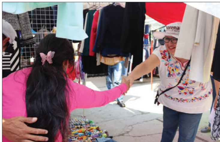
PROPUESTA. Dijo que cualquier nuevo desarrollo inmobiliario público debe ser autorizado bajo la condición de construir la correspondiente accesibilidad para las personas con discapacidad motriz.

La candidata de la coalición "Sigamos haciendo historia en Hidalgo" expresó que es necesari-