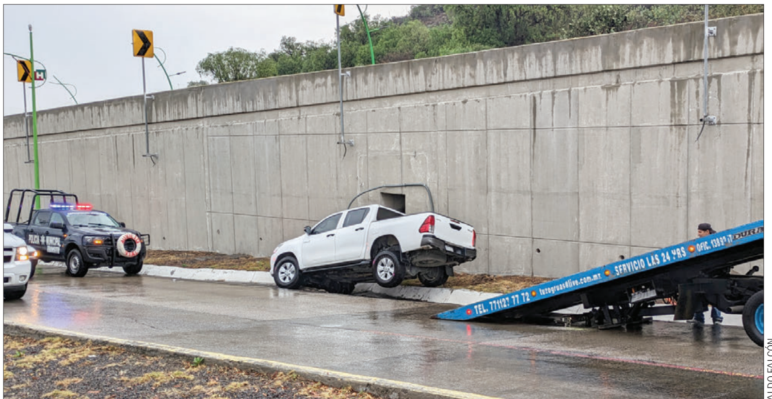
La tarde de este sábado, al menos dos accidentes viales se registraron en el bulevar Colosio, entre Pachuca y Mineral de la Reforma. El primero fue a la altura de la colonia San Javier, dónde una pipa de gas LP y una camioneta particular impactaron. Mientras que a la altura de plaza Q, una camioneta impactó contra un objeto fijo y terminó dentro de la cuenta.

La razón es porque las y los consejeros de dicho órgano electoral no cumplieron en tiempo y forma con la verificación, validación y aprobación de la totalidad de las candidaturas postuladas por los partidos políticos con registro, así como las coaliciones y alianzas vigentes. 3