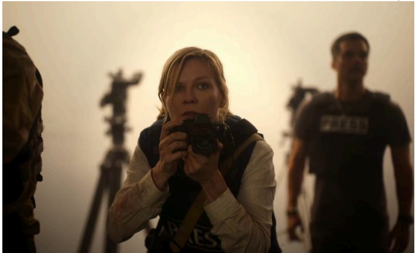
Fotograma del filme.

Si bien el tema de un enfrentamiento armado es algo que pareciera ser una referencia directa a los Estados Unidos, parte del difícil encanto de Garland es encontrar en algo como el MAGA (Make America Great Again) difundido hasta el cansancio por Donald Trump en su polí-