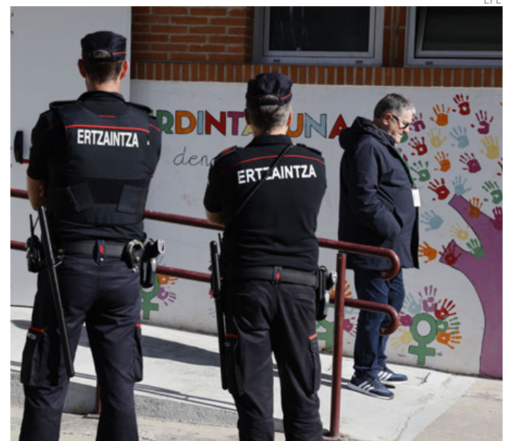
Dos ertzainas en un colegio electoral en Bilbao.

Con orígenes próximos a las tesis de ETA, esta formación ha experimentado una evolución para centrarse más en las políticas sociales y una trayectoria ascendente, con una importante implantación entre la población más joven, que no vivió la violencia terrorista etarra que causó 850 muertos ●