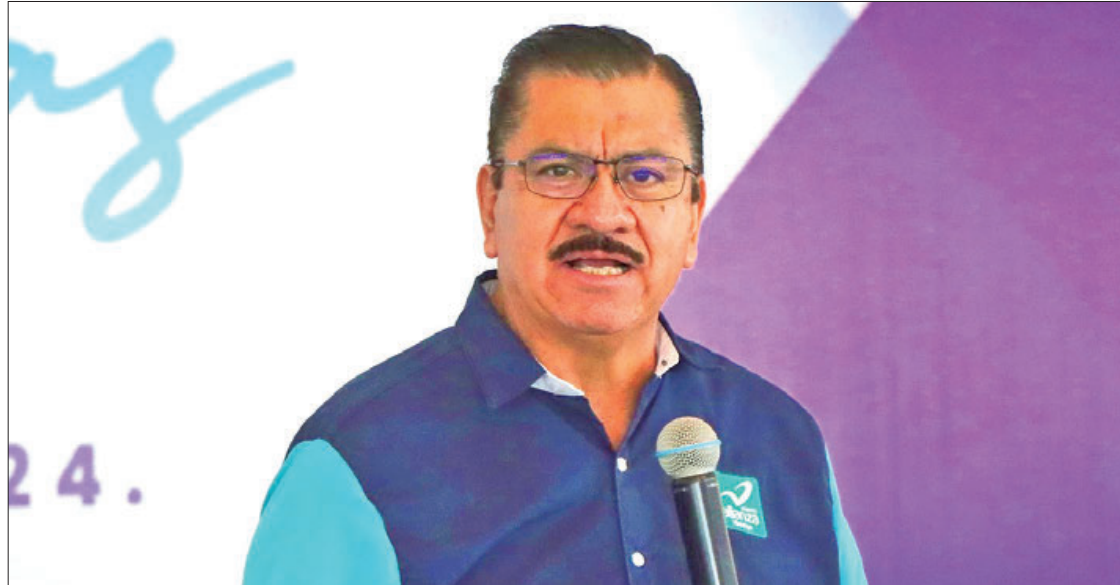
HISTORIA. Desde su creación a nivel nacional en 2005 hasta la pérdida de registro en 2018, este partido exhibió vinculaciones con la entonces lideresa sindical, Elba Esther Gordillo Morales.

Del proceso electoral 2017-2018, Nueva Alianza no logró