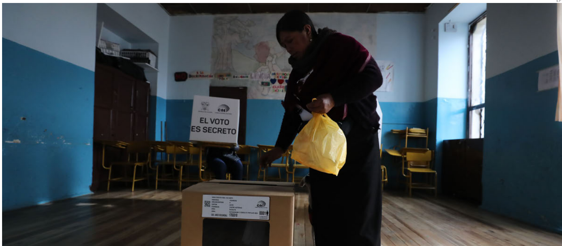
Una ecuatoriana emitiendo su voto en el referéndum de 11 preguntas este domingo en Quito.