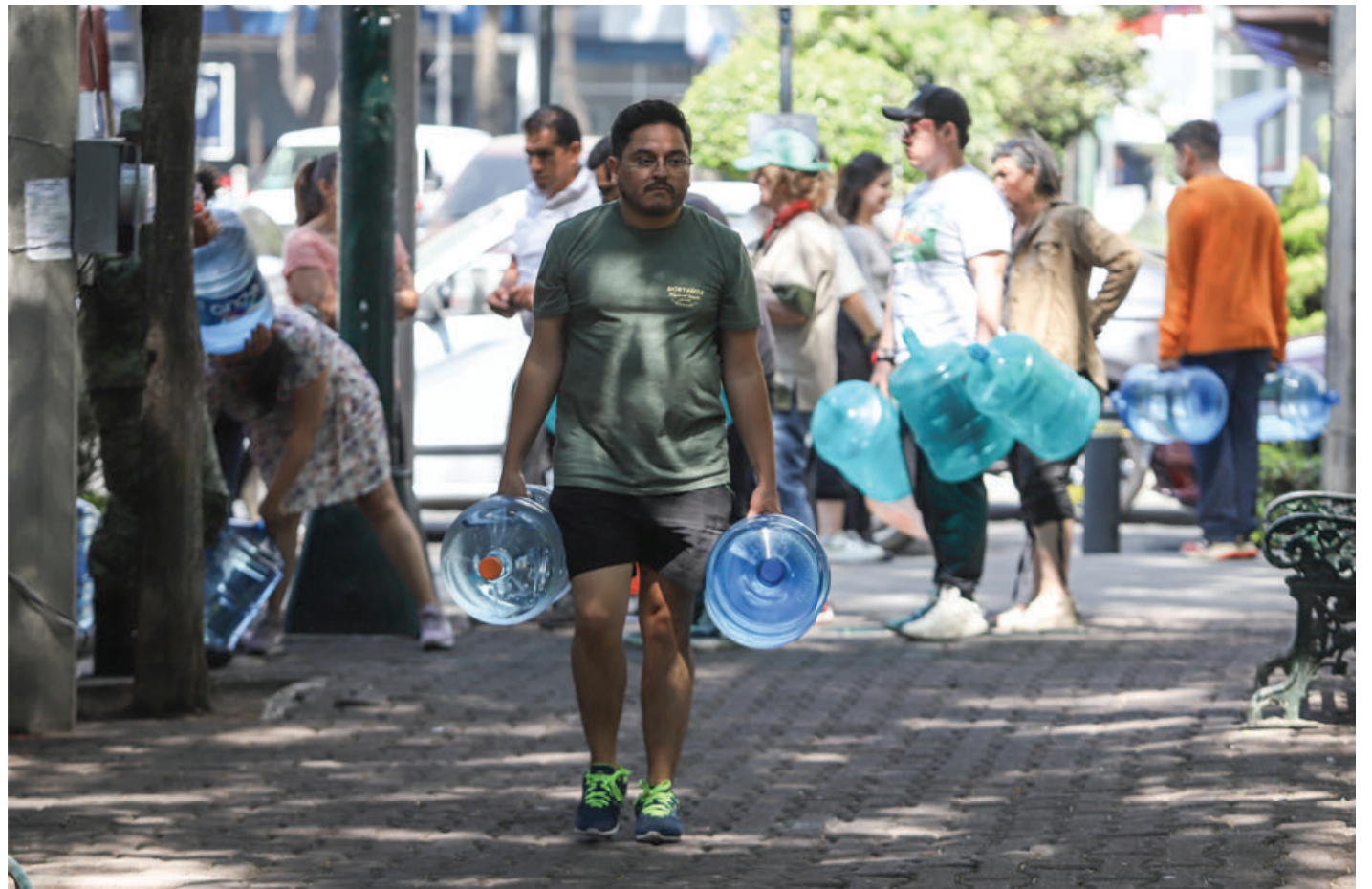
Recolección de agua en el Parque San Lorenzo

Información insuficiente. El lunes 8, Batres reconoce que el agua sí está contaminada. Lo hace en confusos términos coloquiales: “al parecer la sustancia a la que se refieren los diversos reportes de es-