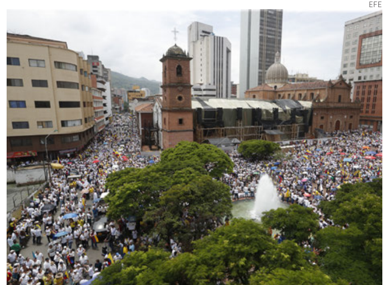
La jornada de protesta este domingo en las calles de Cali.

La movilización fue convocada por la Asociación Colombiana de Cirugía y luego se unieron la Asociación Colombiana de So-