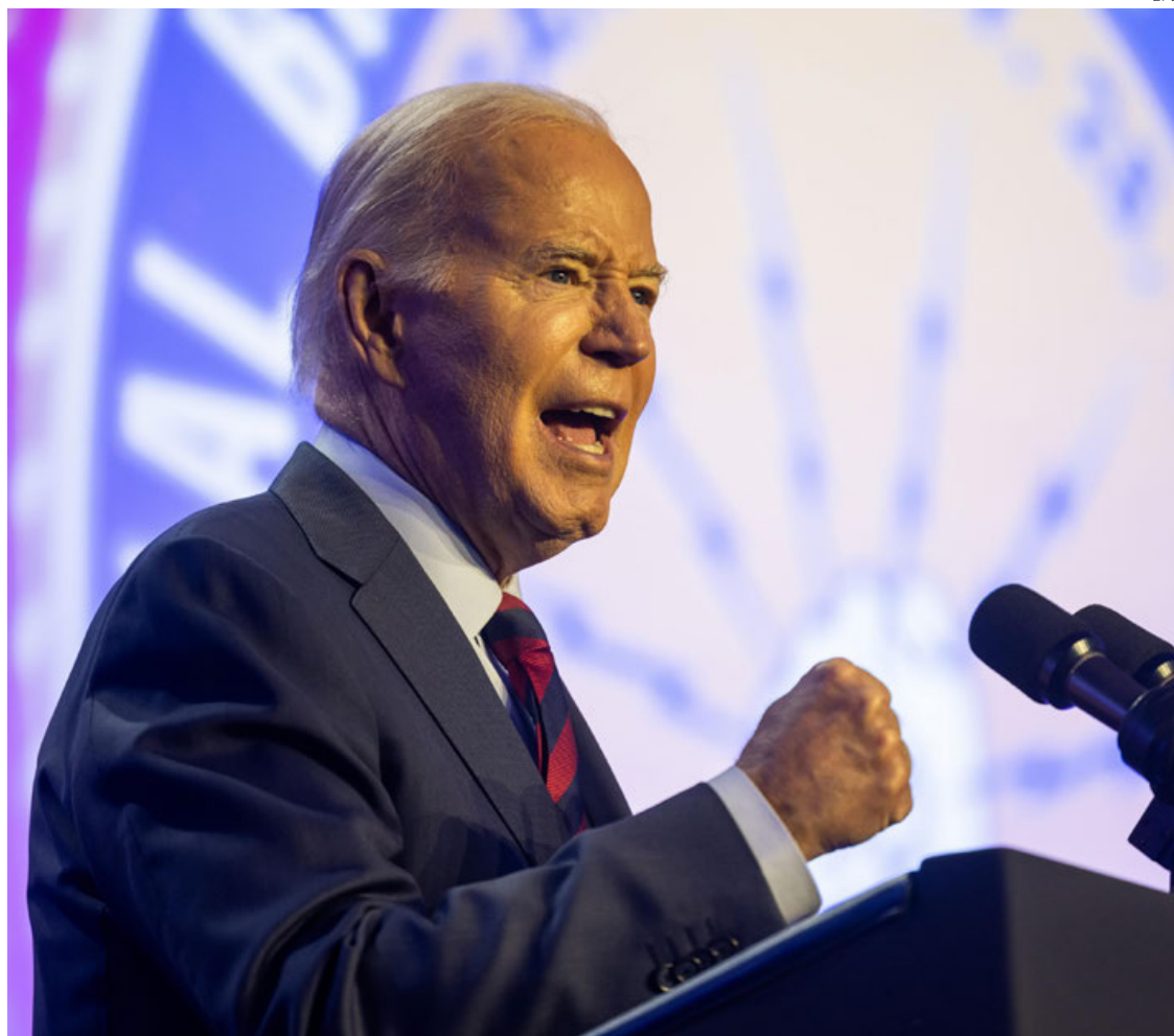
Joe Biden repunta entre las preferencias electorales para presidente de EU.