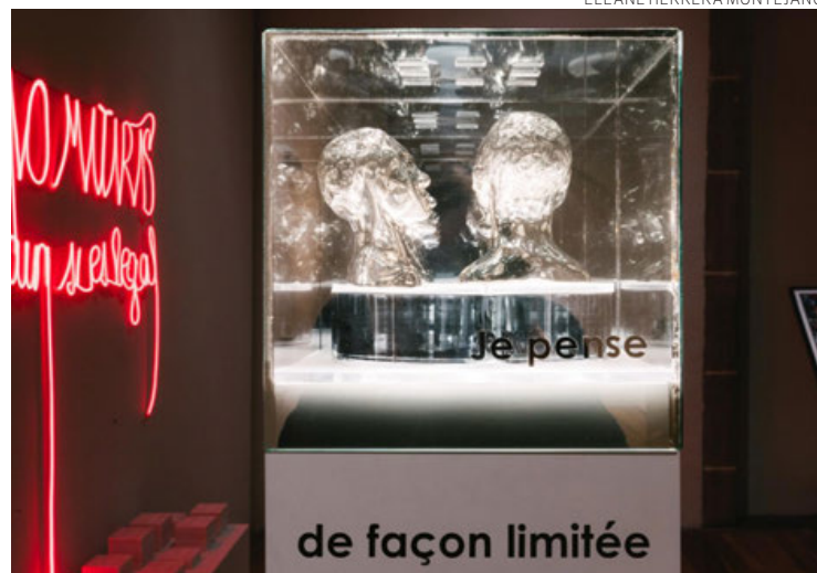
Una vista de la muestra de Claire Becker.

“Más que interactivas -porque no se mueven, ni se transforman-