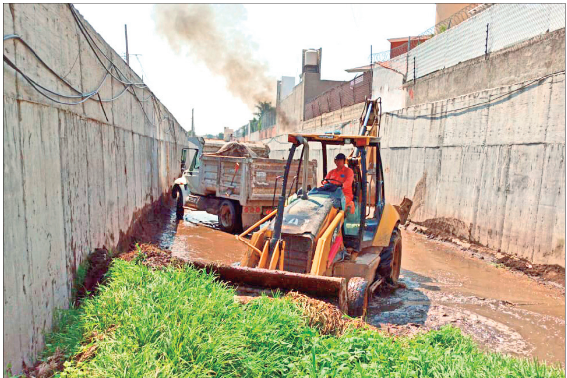
PLANTEAN. La Comisión de Agua y Alcantarillado de Sistemas Intermunicipales y presidencias municipales de Pachuca y Mineral de la Reforma deben concretar acciones.

Las presidencias municipales deben reforzar los programas de recolección de basura, ya que actualmente las unidades no pasan de manera regular y genera focos de contaminación en la vía pública.