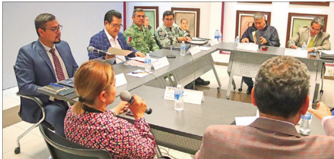
MARGEN. Este esquema considera aspectos como el desarrollo de los actos de campaña, antecedentes de amenazas contra la integridad personal, así como de atentados o ataques contra la vida o la libertad.

Las y los candidatos de los diferentes partidos políticos que busquen una representación local, podrán solicitar protección ante el Instituto Estatal Electoral de Hidalgo (IEEH), mientras que aquellos que contienden por un espacio en el ámbito federal deberán presentarla a través del Instituto Nacional Electoral (INE).