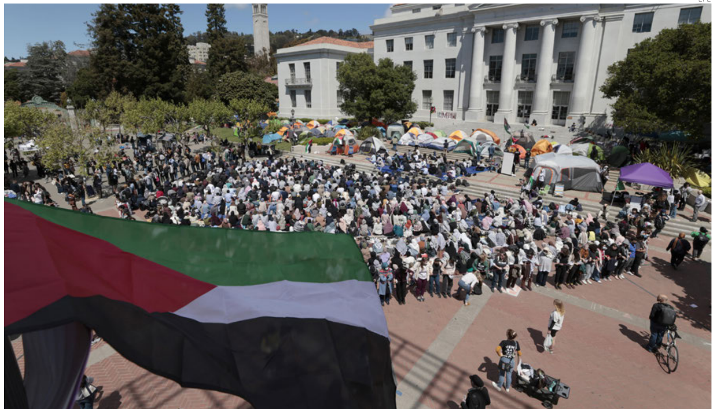
Manifestación propalestina en el campus de la Universidad de California en Berkeley.

Además, la universidad privada George Washington, situada en el centro de la capital estadounidense, advirtió a los estudiantes que el jueves iniciaron una acampada, que cualquiera que permanezca en el campus puede ser suspendido temporal-