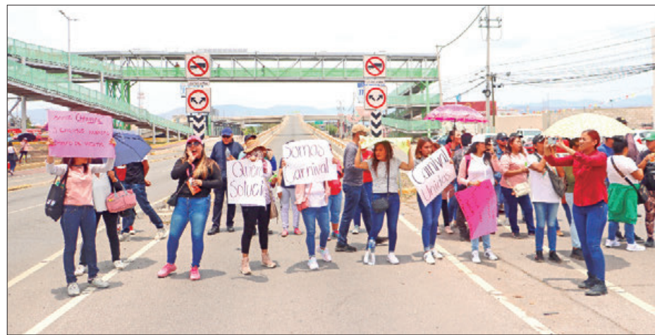
ABRIL 26. Al filo de las 15 horas, los manifestantes liberaron la circulación, luego de concretar mesas de diálogo con las autoridades.

"Todo indica que la empresa se encuentra en medio de una situación de carácter judicial y jurídico que obligó a su cierre afectando a más de 700 trabajadores".