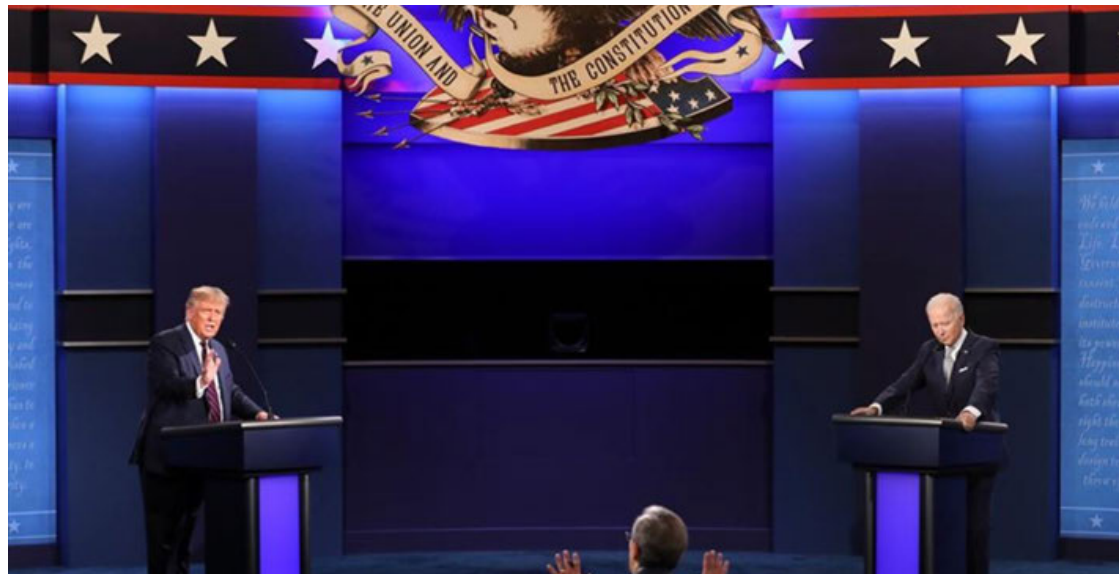
El anuncio del debate llega en medio de una gran presión de grandes medios del país.

Biden hizo el anuncio en respuesta a una pregunta del popular locutor de radio Howard