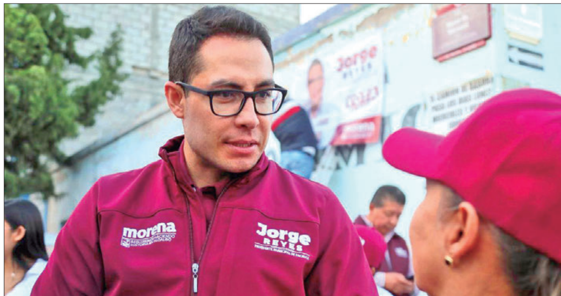
ZONA. Recorrido casa por casa, por la Colonia Morelos.