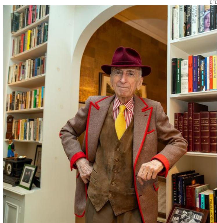
El reportero Gay Talese.

Sigue defendiendo a capa y espada un “periodismo con ambiciones artísticas” que vaya más allá de los hechos desnudos, pero sin desvirtuarlos, pues asegura que siempre ha respetado la exactitud y ha escrito textos verificables • (EFE en Nueva York)