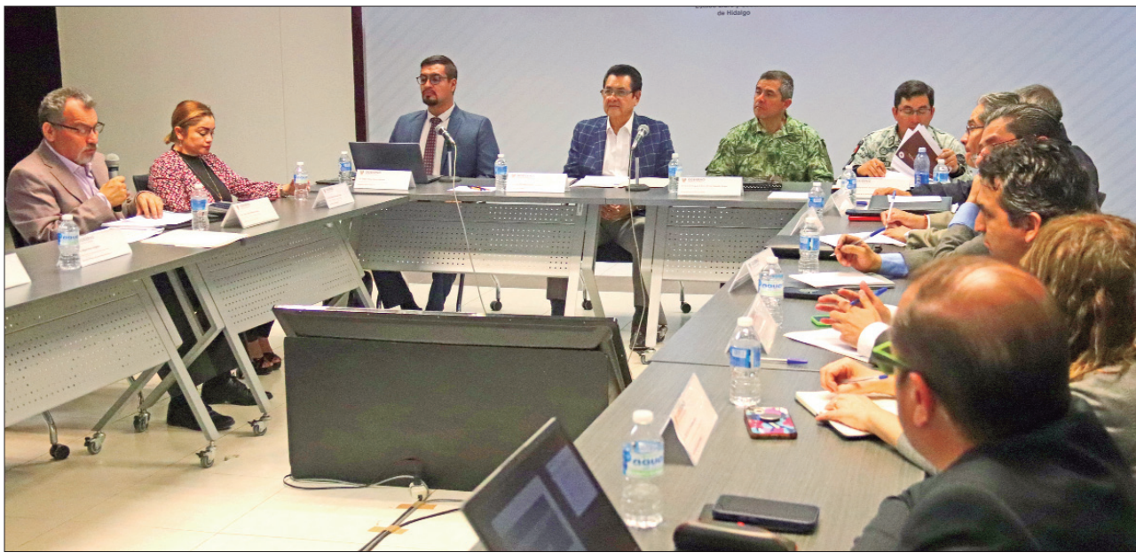
Las y los candidatos de los diferentes partidos políticos que busquen una representación local podrán solicitar protección ante el Instituto Estatal Electoral de Hidalgo; aquellos que contienden por un espacio en el ámbito federal deberán presentarla a través del INE.

■ Gobierno estatal e IEEH elaboraron protocolo que considera: desarrollo de los actos de campaña, antecedentes de amenazas contra la integridad personal, así como atentados u otro tipo de ataques .3