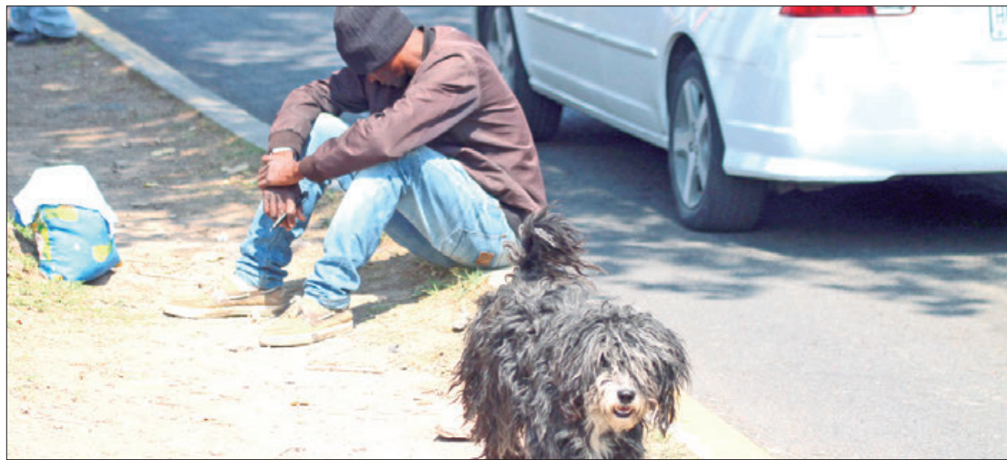
RECURSOS. Los indocumentados han encontrado otras rutas para transitar hacia el norte del país proveniente del sureste de México, disminuyendo también la posibilidad de que algunas personas se quedarán por algún tiempo en la zona de Tepeapulco y municipios cercanos.

"Es un hecho que la migración de esta zona ha ido a menos de manera notoria, es evidente que cuando el tren llega a pasar a bordo viajan máximo 30 personas, cuando anteriormente el tránsito de indocumentados era de 200 a 300 personas".