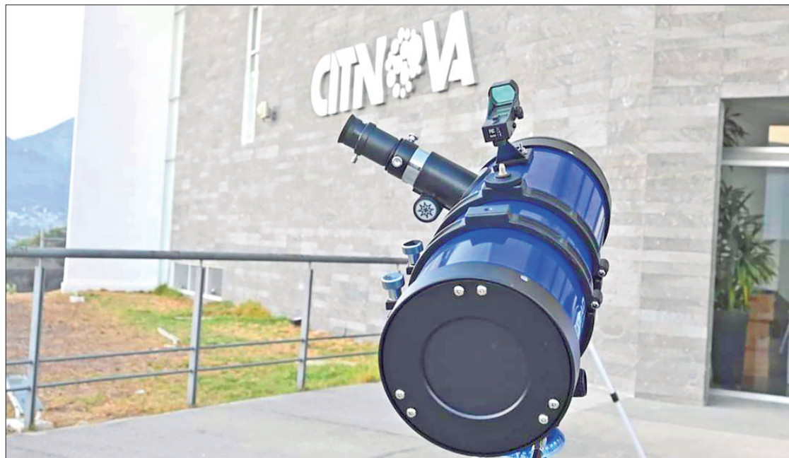
PREVENCIÓN. Para garantizar la seguridad como parte de esta experiencia, se contará con lentes especiales con certificación ISO 12312-2.

Para garantizar la seguridad como parte de esta experiencia, se contará con lentes especiales con certificación ISO 12312-2, esto debido a que el sol produce cantidades inmensas de energía cada segundo. Si bien la luz que se logrará apreciar es apenas una fracción de la radiación total, debe tenerse cuidado particularmente con la radiación ultravioleta, debido a que es una de las que más podría dañar la vista en caso de mirar directamente a la estrella.