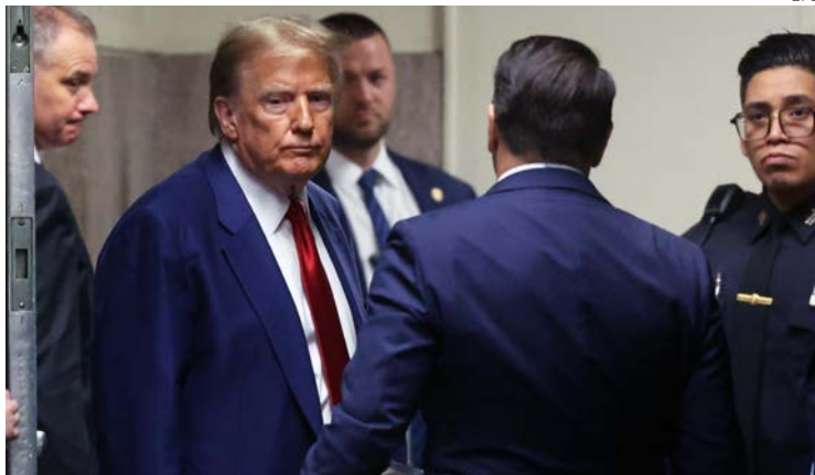
Trump tendrá que enfrentar las acusaciones sobre injerencia política y mal uso de documentos confidenciales.

Jueces de Georgia y Florida rechazaron sus peticiones de desestimar las acusaciones