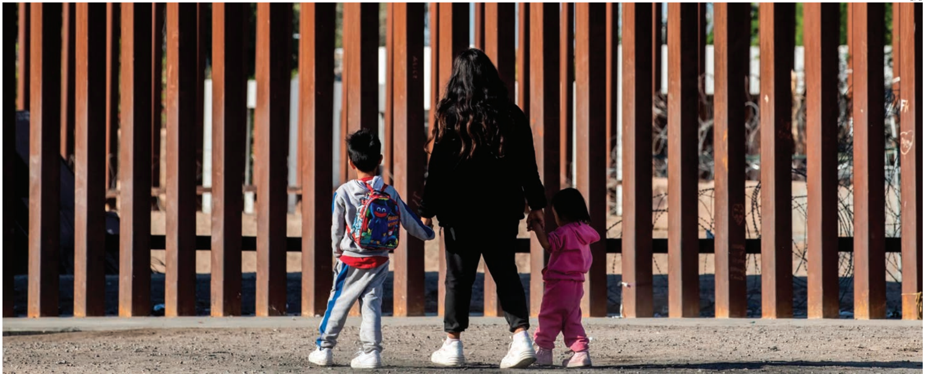
La jueza Dolly M. Gee dispuso que niños inmigrantes irregulares en EU deben recibir ayuda y tratamiento médico de manera inmediata.