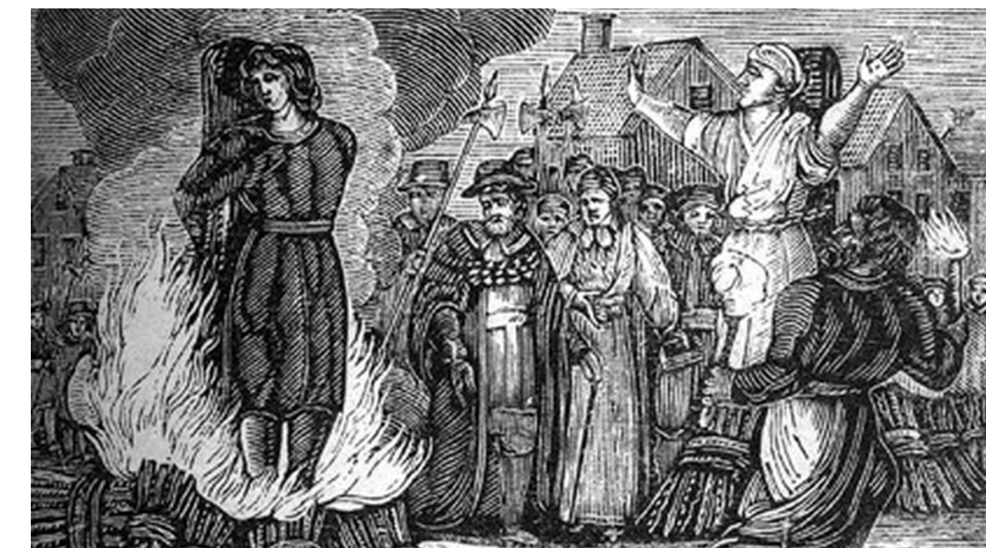
El gran castigo inquisitorial era la hoguera, etapa final de todo el proceso: detención, interrogatorio, a veces aderezado con tortura, confiscación de bienes, y finalmente la muerte, rápida cuando era por garrote, muy lenta y dolorosa cuando era en la hoguera.

Primero, fue el deber de consolidar la fe católica en todos los reinos de la América española lo que movió al Santo Oficio, aún antes de haberse establecido formalmente en estas tierras. Por definición de