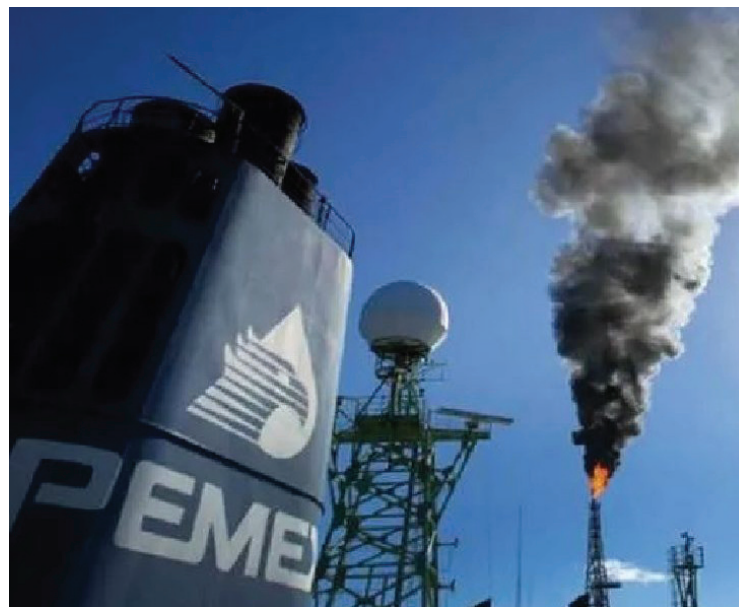
Análisis del centro de estudios InfluenceMap señala que la empresa mexicana aporta el 1.0% de las emisiones; figura en el duodécimo lugar de la lista.

1.0% de las emisiones, figura en el duodécimo lugar de la lista; la brasileña Petrobras, con 0.8%, en el 19; Petróleos de Venezuela, con 0.6%, en el 21, y la colombiana Ecopetrol, con 0.3%, en el 59.