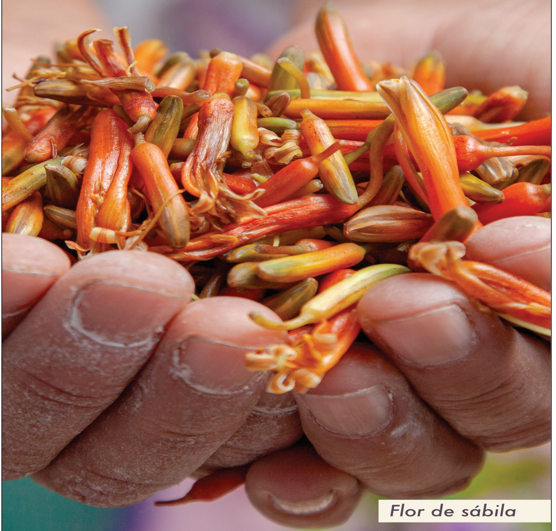
Flor de sábila