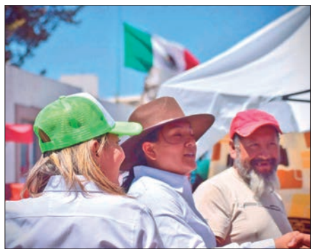
PLAN. Esta fiscalía se pretende sea reconocida por la Constitución Política.

"Uno de los graves problemas en nuestro país es la violencia contra la mujer, ya que el 70% del total de las mujeres de 15 años y más, han experimentado violencia a lo largo de su vida. En cuestión de feminicidios en México, en promedio entre 9 y 10 mujeres son asesinadas, sólo por ser mujeres", explicó la candidata del Partido Verde Ecologista.