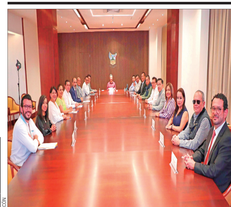
ALDO FALCÓN El titular del Poder Ejecutivo del Estado de Hidalgo tuvo una reunión de trabajo con los secretarios y las secretarías de su gabinete donde intercambiaron puntos relevantes de cada área, a fin de coordinar las labores que se realizan al interior de las dependencias y continuar con las responsabilidades que les atañen.

Avance del 55% para PREP 2024, reporta el IEEH