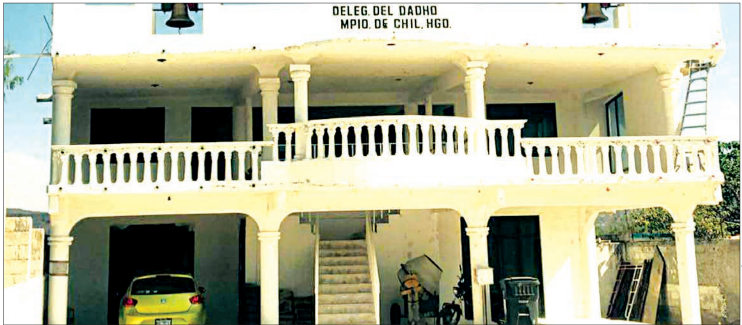
LABOR. En Las Vegas, Nevada, ofrecerán antojitos hidalguenses a fin de reunir fondos para entregarlo a sus familiares.

La organización conocida como la Federación Hidalguense en Las Vegas, Nevadas, Estados Unidos, se sumó y convocó para que todos los migrantes apoyen esta causa en favor del originario de Chilcuautla.