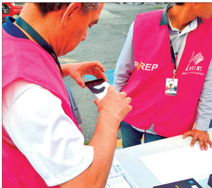
ACTIVIDADES. El plan de continuidad define las acciones a implementar que garantice los procesos de acopio, digitalización, captura, verificación y publicación de los resultados preliminares.

El plan de continuidad define las acciones a implementar que