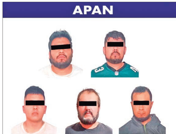
OPERACIÓN. De acuerdo con los informes policiales, dicha banda delictiva operaba en Tlaxcala, Puebla, Veracruz e Hidalgo.

que viajaban a bordo de un automóvil Chevrolet Spark color gris, acompañados de tres personas que conducían una motocicleta y un vehículo Nissan Versa color negro, que portaban placas del estado de Tlaxcala, los cuales fueron intervenidos por elementos estatales con apoyo de policías adscritos al Mando Coordinado y Policía Investigadora.