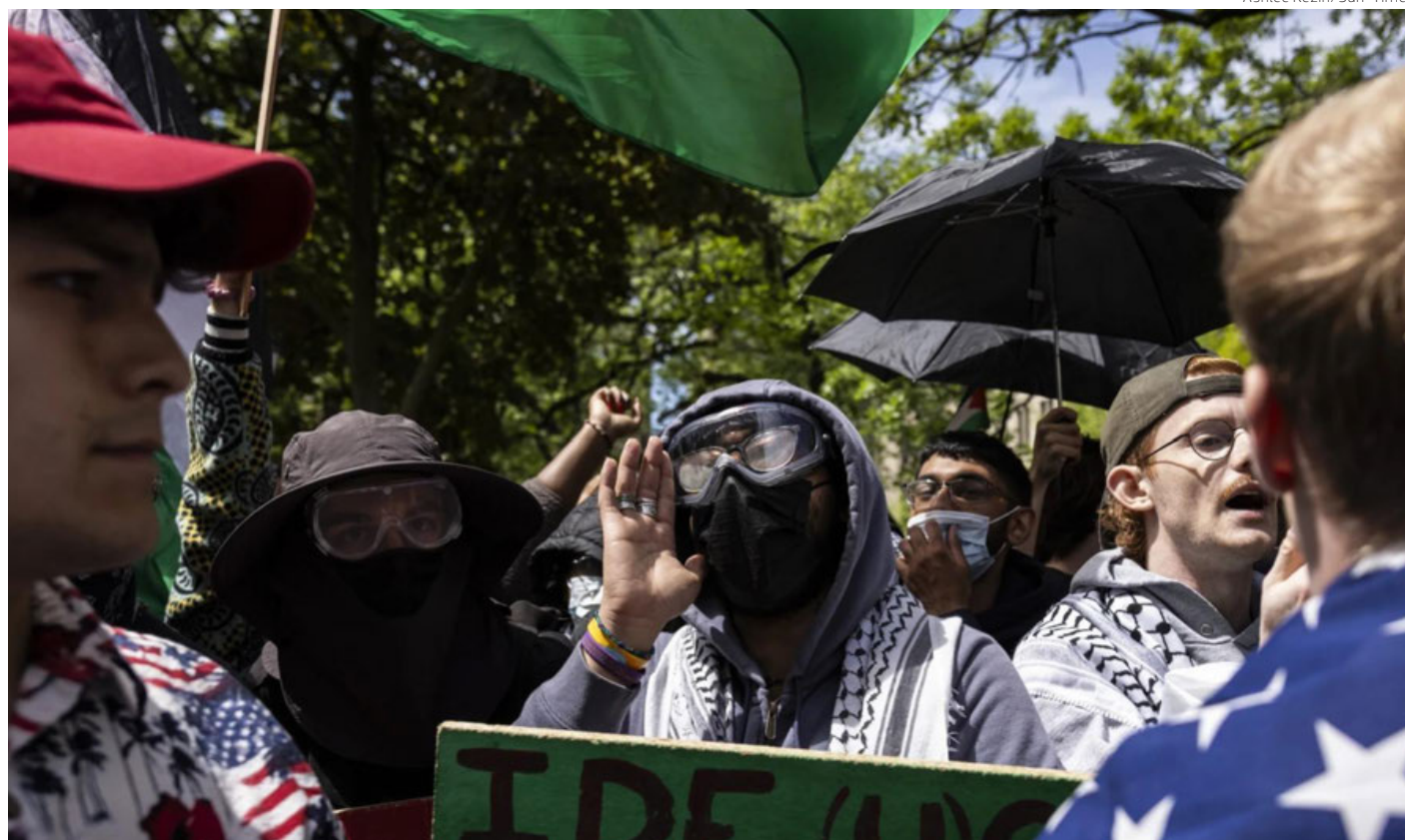
Manifestantes pro palestinos chocan con contramanifestantes en el campamento de la Universidad de Chicago.

A la espera de lo que pueda pasar en Chicago y con el resto de protestas, en Los Ángeles, la Universidad del Sur de California, escenario de protestas en las últimas semanas, anunció nuevos planes para la graduación de sus alumnos después de