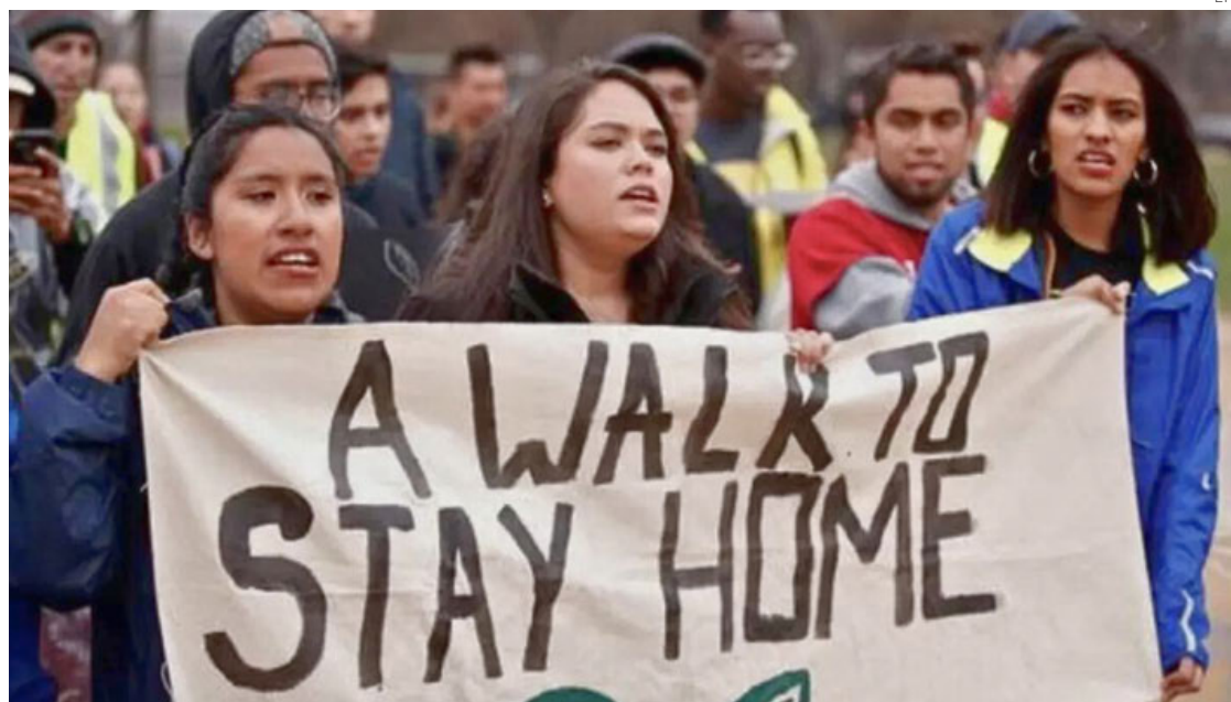
Un grupo de "soñadores" se manifiesta en Washington, DC.

La nueva norma modifica esta definición para garantizar a los beneficiarios de DACA acceso a seguros médicos. Se estima que