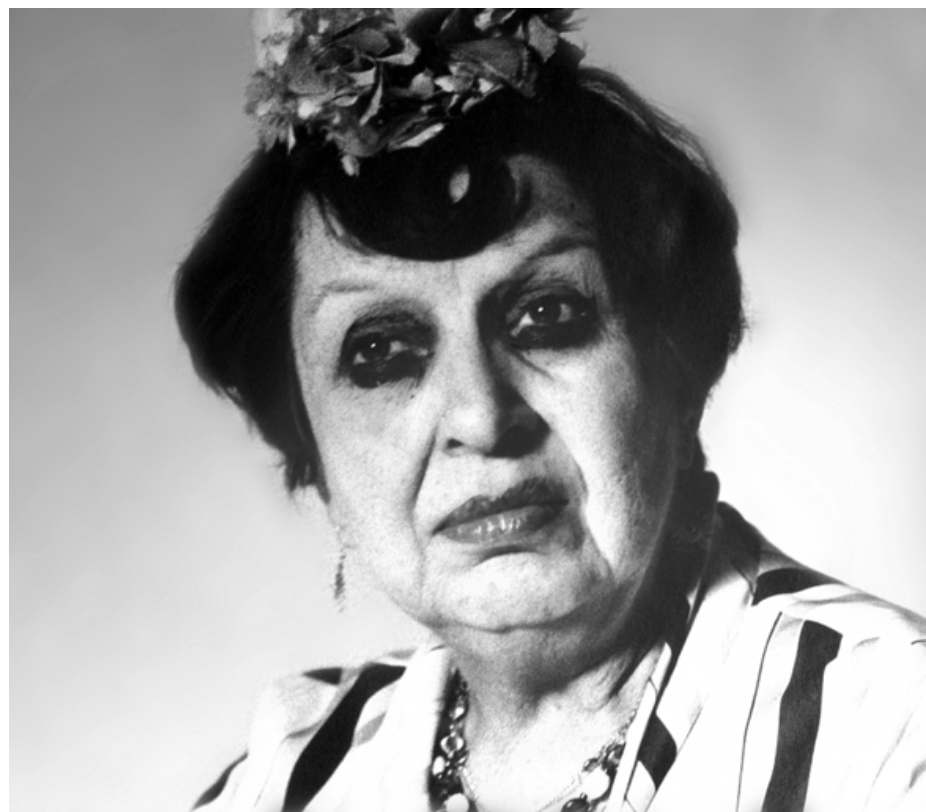
Una de las fotos de Guadalupe “Pita” Amor.

En conversación con Crónica , Blanca Charolet López destaca la intención fotográfica de imprimir fuerza en los labios de la