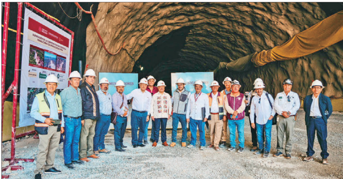
Acompañado por el titular del Poder Ejecutivo del Estado de Hidalgo, el presidente de la República encabezó la supervisión de la carretera federal Pachuca - Huejutla en el tramo Real del Monte - Entronque Huasca.