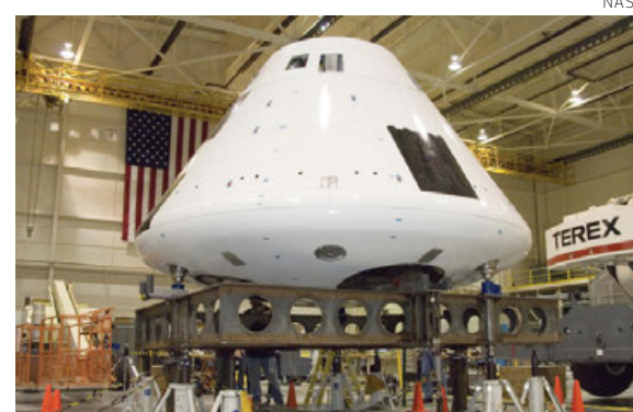
La cápsula Orión.

Scott advirtió sobre estas "anomalías con el escudo térmico de Orión", así como también sobre los pernos de separación, y