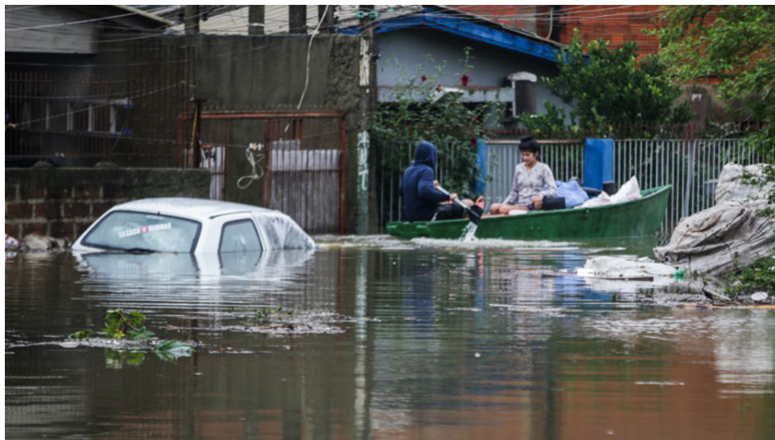
Habitantes en una embarcación durante una inundación en Porto Alegre.

En total ya son 265 municipios afectados, más de la mitad de los que forman el estado, incluida la capital regional, Porto Alegre, cuyo centro histórico quedó completamente inundado después de que el río Guaíba se desbordara, al alcanzar su nivel más alto en ocho décadas.