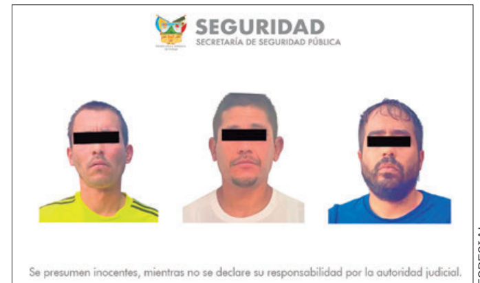
Se presumen inocentes, mientras no se declare su responsabilidad por la autoridad judicial.

Al ser intervenidos para su revisión, les fue hallada una pistola de balines, 29 gramos de droga "cristal" y un arma de fuego corta calibre 9 milímetros con cartuchos útiles,