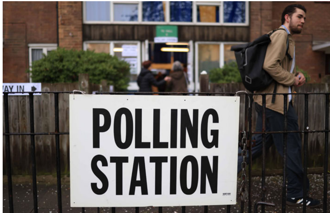
Una persona camina cerca de un colegio electoral en Londres.

día 989 concejales en 107 de las 317 entidades locales de Inglaterra (las demás votan otros años).