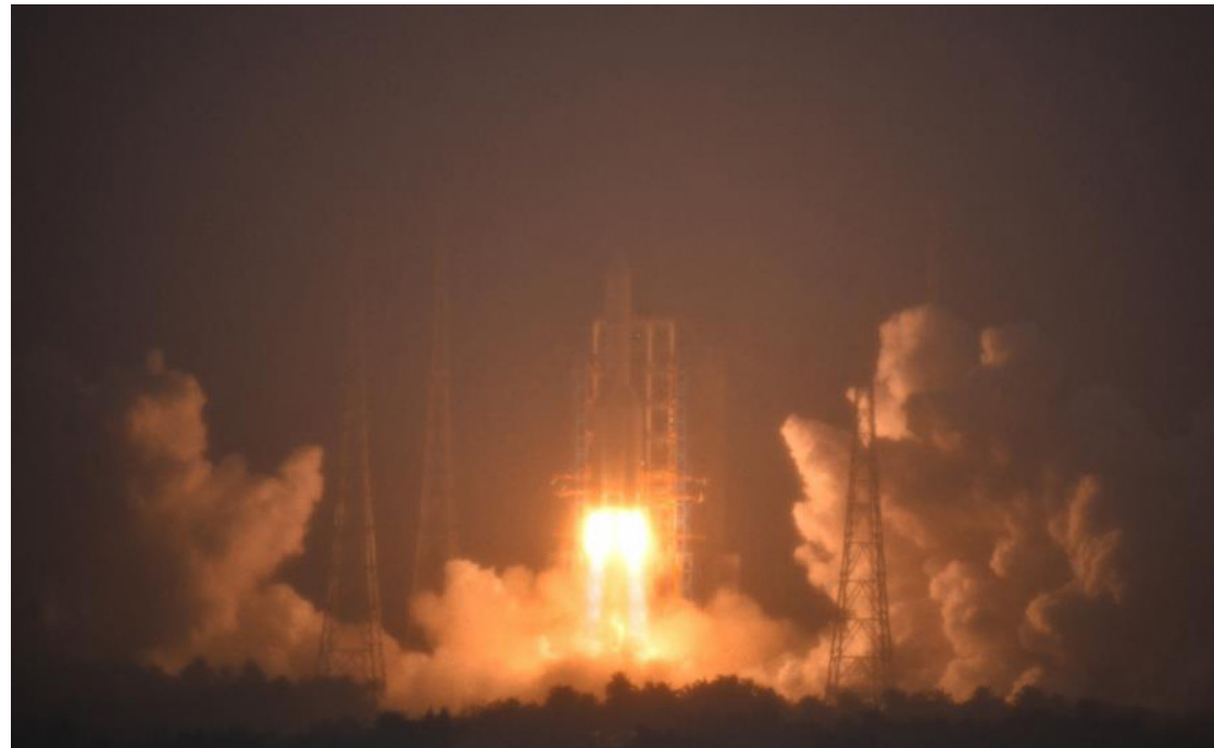
El lanzamiento de la sonda lunar Chang'e-6.

Se espera que la cantidad de muestras lunares que se devolverán esta vez sea también ma-