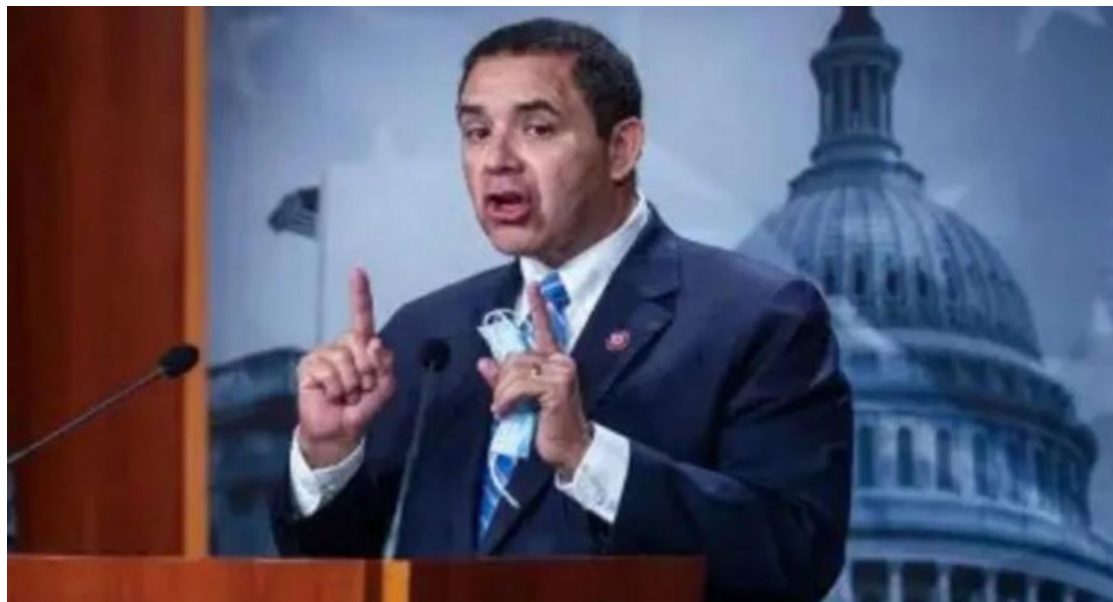
Cuellar es miembro del Congreso por el estado de Texas.

miembro del Congreso estadounidense por el estado de Texas desde 2005. Su casa y la oficina de su campaña en la ciudad texana de Laredo, de donde es originario, fueron allanadas