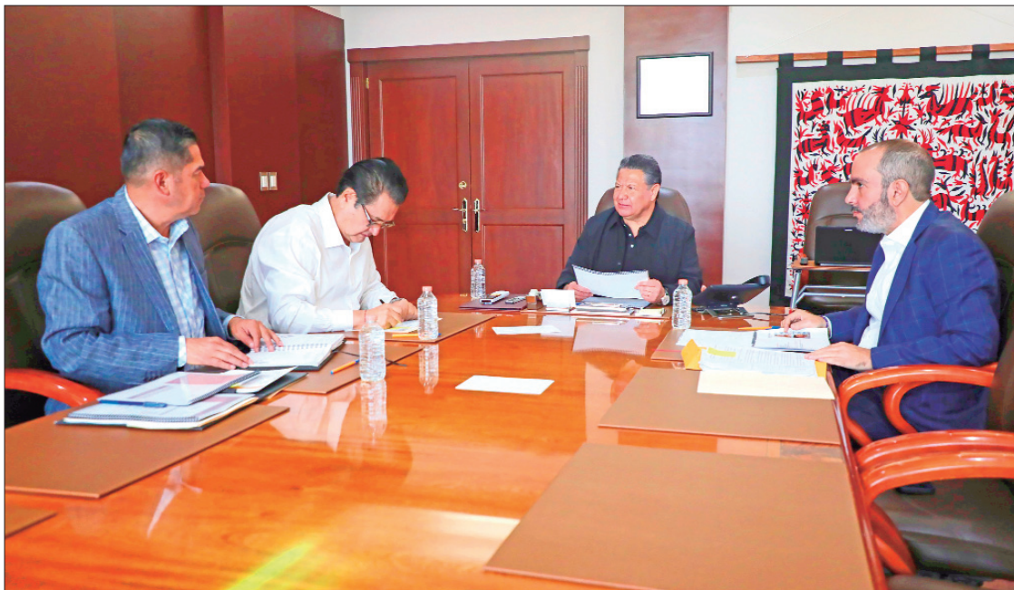
TÓPICOS. Igual detallaron que en Ixmiquilpan rescataron siete personas provenientes de Venezuela, Nicaragua, El Salvador, Colombia y Ecuador

► Ahondan en los primeros resultados del combate a incendios forestales de últimos días en la entidad