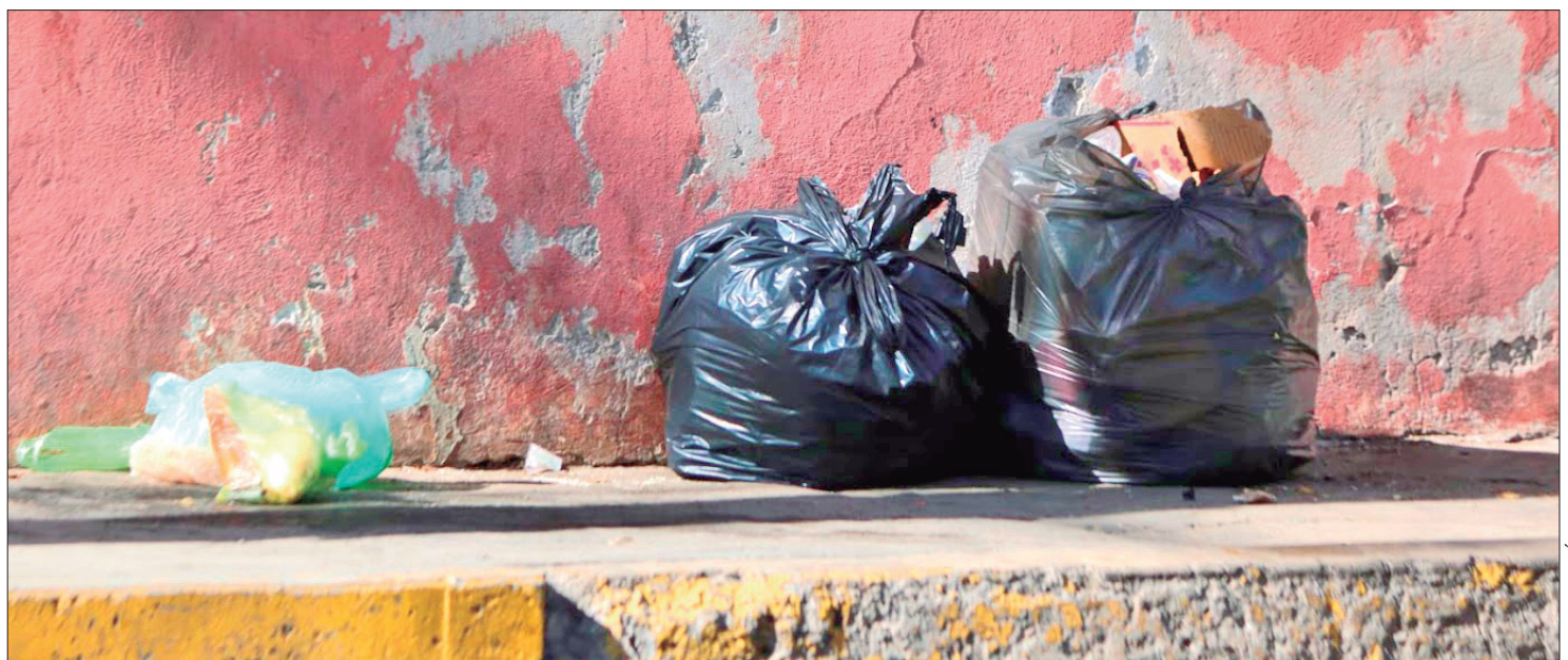
LLAMADO. Es necesario tomar otras medidas preventivas en los hogares para que las lluvias no sorprendan a las familias.

Se exhorta a la población a atender los avisos del Servicio Meteorológico Nacional (SMN), de la Comisión Nacional del Agua (Conagua), y seguir las recomendaciones de Protección Civil.