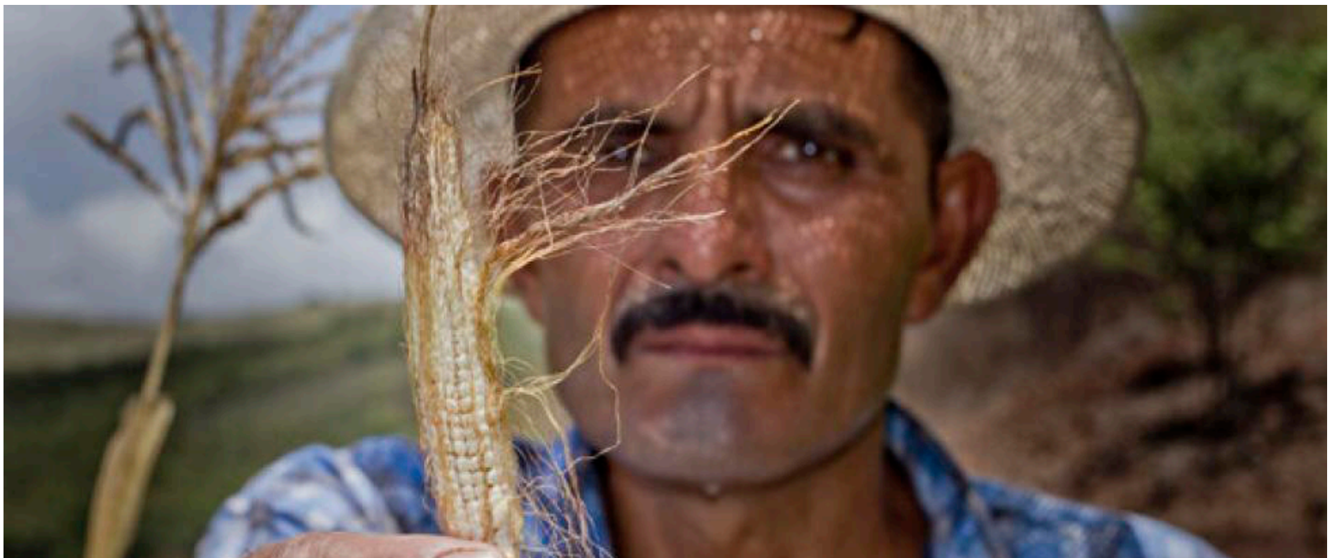
El Corredor Seco centroamericano sufre una grave sequía tras la llegada de El Niño, el verano pasado WFP.