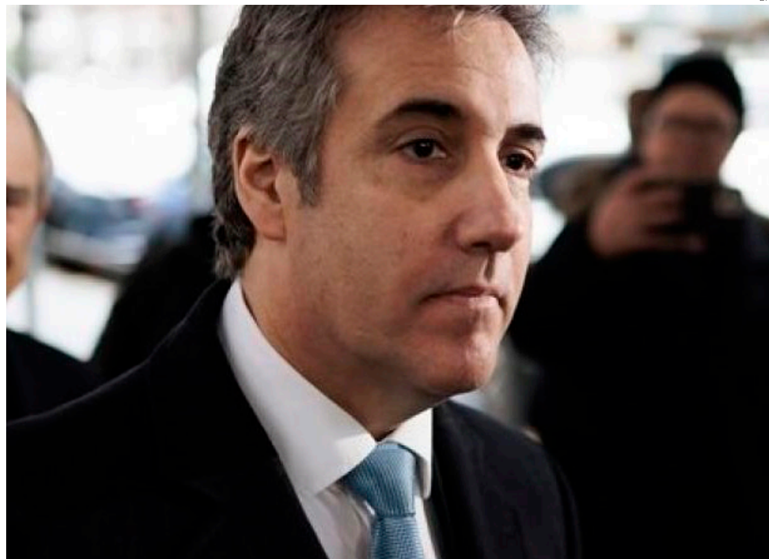
Foto de archivo del exabogado de Donald Trump, Michael Cohen.

Cohen, condenado a tres años de cárcel en 2018 por financiación