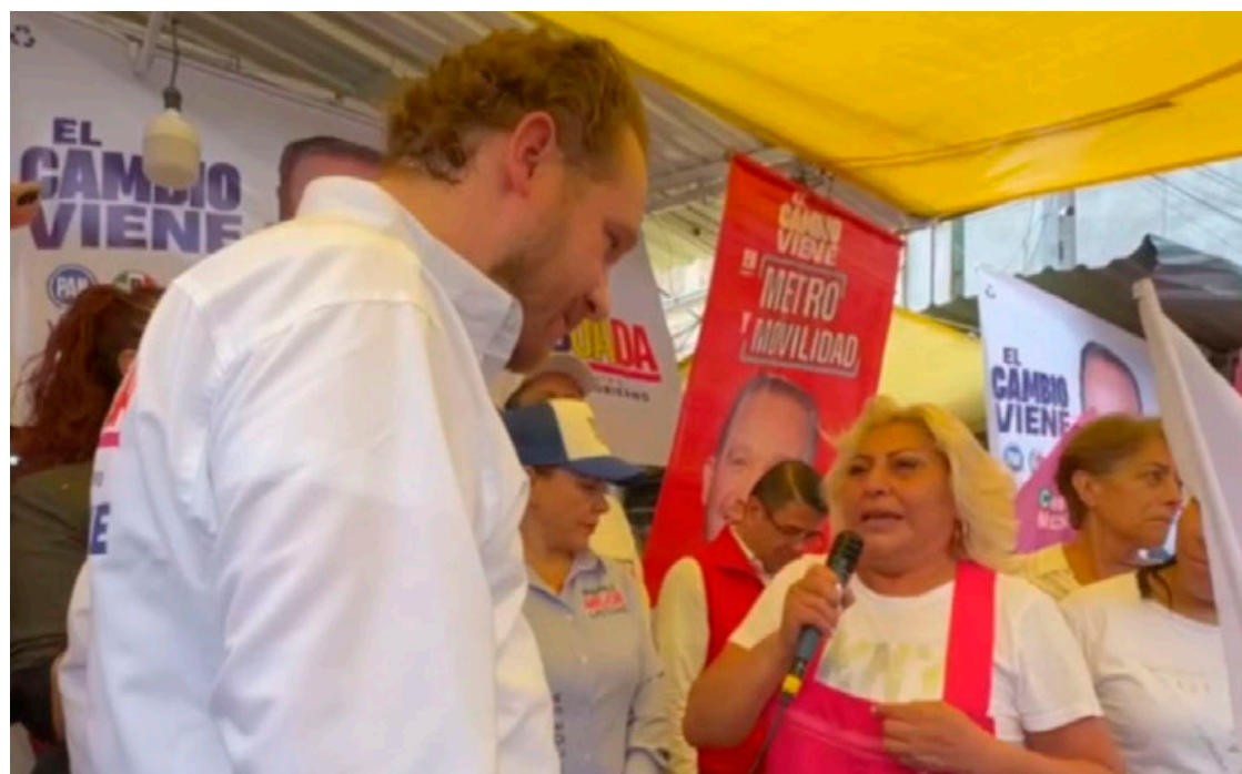
Según Taboada, la aprehensión de la comerciante se debe a una persecución de la SSC y la FGI.

aprehensión de la comerciante se debe a una persecución del titular de la policía, Pablo Vázquez y del fiscal Ulises Lara, para amedrentar a todos los que están en contra del partido Morena; funcionarios a quienes aseguró que denunciará por meter a la seguridad pública en el proceso electoral.