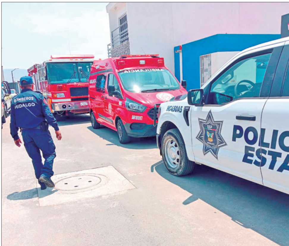
Sofocaron elementos de Bomberos del estado un incendio al interior de una vivienda del Fraccionamiento Charvarría, en Mineral de la Reforma. No reportaron personas lesionadas, únicamente pérdidas materiales de aproximadamente 20 mil pesos.

■ Tras sentencias del TEEH, IEEH acató ordenamientos y asumió los criterios para validar aspirantes reservados o rechazados por incumplir pertenencias a grupos vulnerables