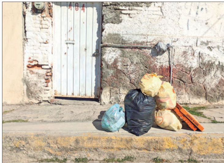
EVIDENCIA. Por medio de las redes sociales los internautas evidenciaron los problemas que atrae la gran cantidad de basura en las calles.

Criticaron que, si bien la ciudad requiere del fomento turístico y promoción de muchos as-