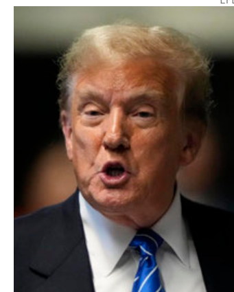
Donald Trump, este lunes.

Aun así, el expresidente republicano tendrá que sortear varios escollos, entre ellos el aborto, que es "una de sus mayores vulnerabilidades", afirma el diario. Así, el 64% de los votantes en los estados disputados dijeron que el aborto debería ser siempre o en su mayor parte legal, entre ellos el 44 % de quienes se declaran partidarios de Trump •