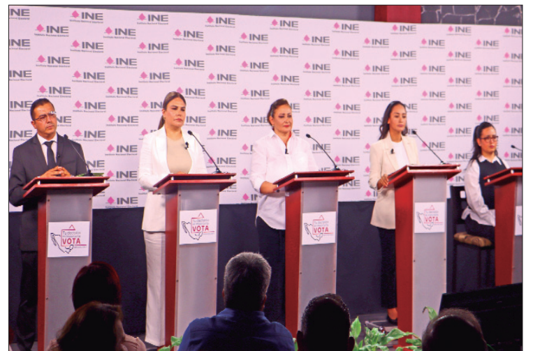
DEMOCRACIA. Debatieron los candidatos a la diputación federal por el distrito de Tepeapulco, en actividad organizada por el Instituto Nacional Electoral.

Sobre el agua, insistió en una reforma a la ley de agua para la regulación en la transferencia de títulos, proteger los cuerpos de líquido vital, tratar aguas residuales, crear nuevas condiciones para otorgamiento de vigencia, vigilancia, cancelación o revisión de