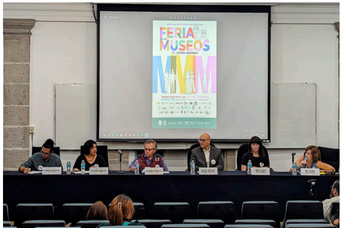
Con motivo del Día Internacional de los Museos, la Autoridad del Centro Histórico reunirá a 31 recintos culturales en la Feria de los Museos, se anunció en conferencia de prensa.

Actualmente el Circuito Alameda-Revolución lo integran: Museo de Arte Popular, Museo Nacional de San Carlos, Museo Casa Carranza, Museo Palacio Postal, Museo Banco de México, Museo del Tequila y del Mezcal, Museo del Perfume, Museo Mural Diego Rivera, Museo Nacional de la Revolución, Museo Nacional de la Estampa, Museo Kaluz, Museo Panteón de San Fernando, Museo del Pulque y las