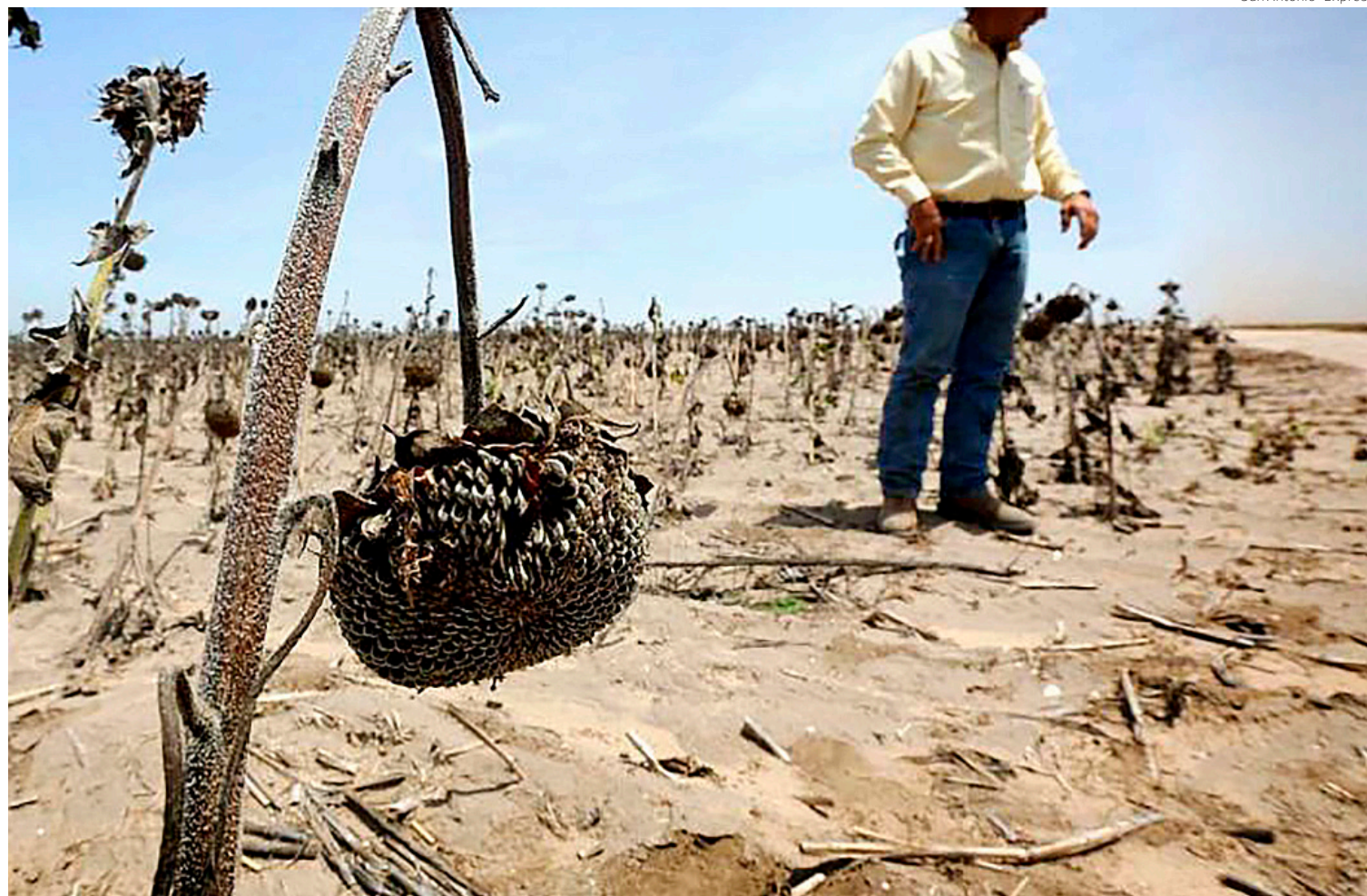
Cosechas perdidas por la sequía en el sur de Texas.

Los legisladores denunciaron que el retraso en los envíos de agua por parte de México está afectando a los granjeros del sur de Texas, en especial a la