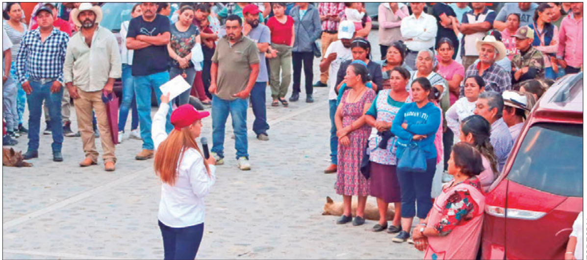
EXPLICACIÓN. Dar 5 de 5 sufragios, al partido guinda, significa apoyar en las urnas a las y los candidatos de esta expresión al senado, diputaciones federal y local, ayuntamientos y por la Presidencia de México.

Por ello, la comunidad expresó un fuerte apoyo a su candidatura, reflejando su confianza en que, bajo su liderazgo, se logrará una verdadera transformación hacia un futuro más próspero y justo para Atotonilco el Grande.