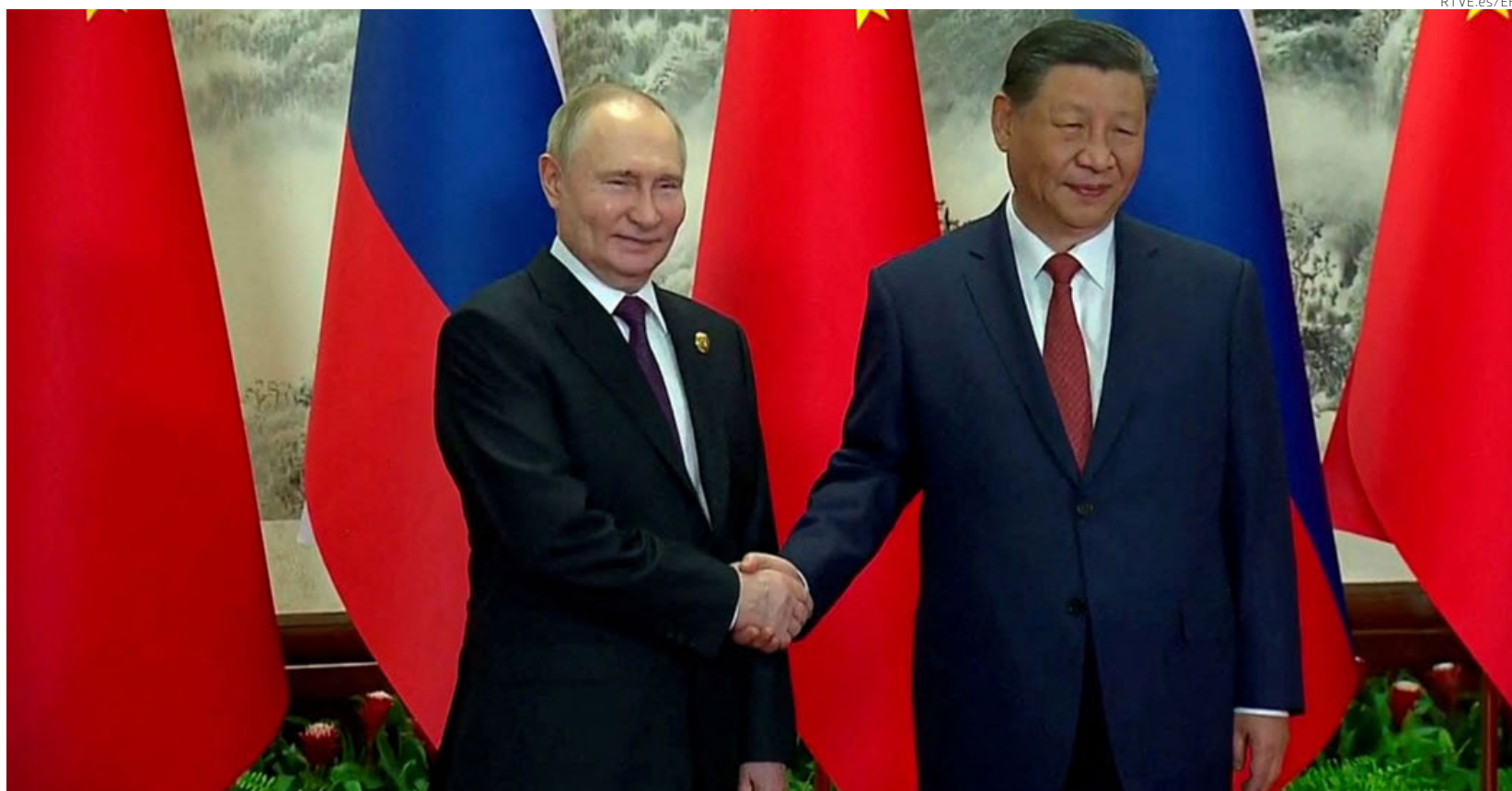
Putin y Xi participaron en una gala para conmemorar los 75 años desde que la URSS reconoció a la República Popular China.