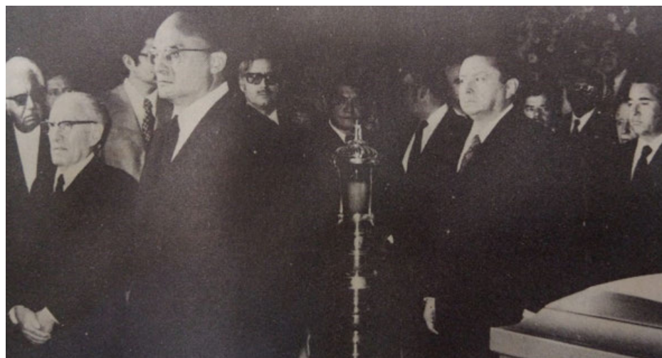
El presidente Luis Echeverría (haciendo guardia al lado del escritor Martín Luis Guzmán) suspendió su recorrido por el estado de Chiapas para acudir a las honras fúnebres de Jaime Torres Bodet.

de manera notoria. Otros indagarían en otras fuentes y aseguraron que nada hacía pensar que Torres Bodet elegiría convocar a la muerte.