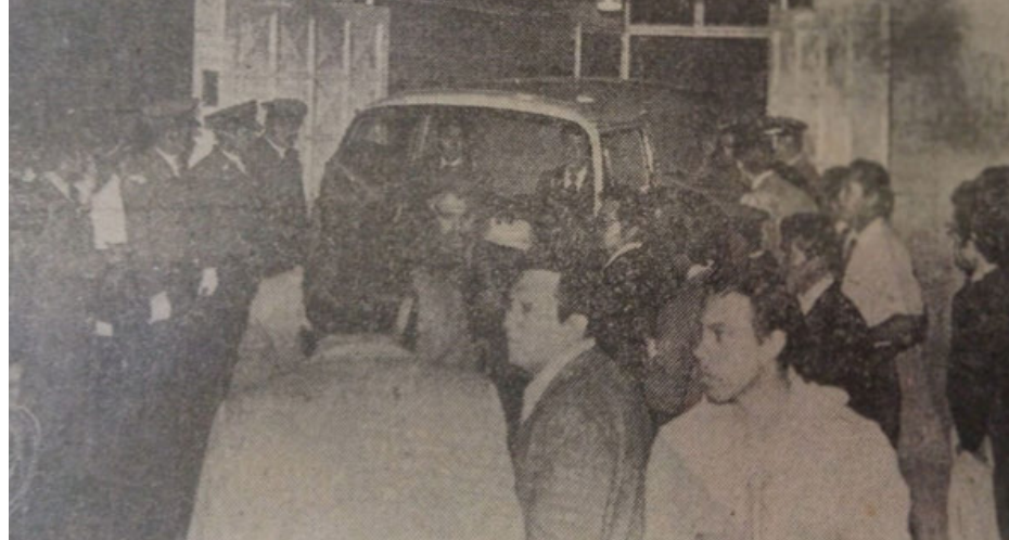
Docenas de curiosos, reporteros y funcionarios públicos de alto nivel se agolparon ante la casa del 228 de Vicente Güemes, en Lomas Virreyes, donde Jaime Torres Bodet, dos veces titular de la SEP y una de la SRE, se había suicidado.

El cuerpo de Torres Bodet fue velado brevemente en la colonia del Valle. Luego, se le trasladó al Palacio de Bellas Artes, donde hubo un homenaje que correspondía a su calidad de hombre de letras. El decano del periodismo mexicano, Martín Luis Guzmán, dio nota: comentó a los reporteros que, poco a poco, la salud de don Jaime había decaído