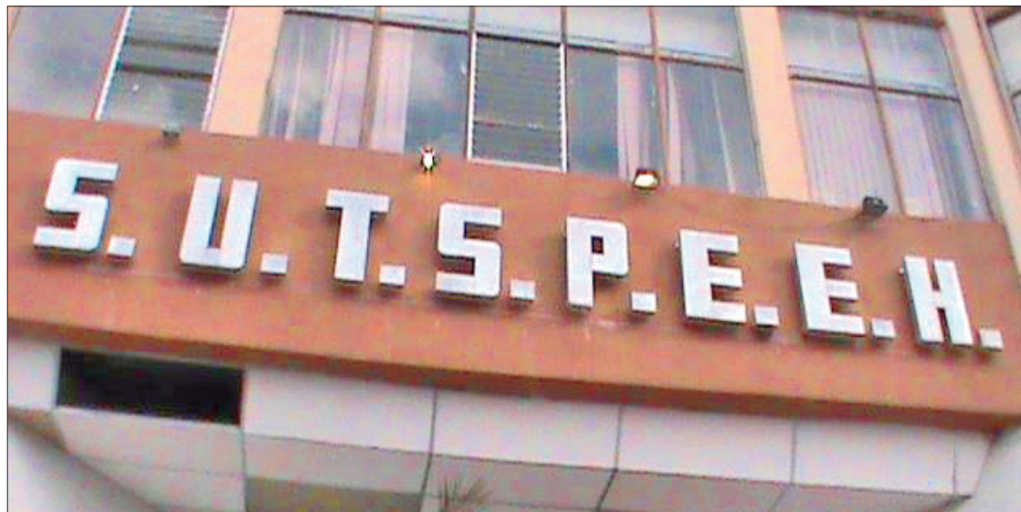
SUTSPEEH. Es muy importante que los empleados sindicalizados pidan asesoría en la Contraloría del gobierno del estado para presentar sus documentos requeridos y entregarlos antes de la fecha establecida.

Puntualizó que la declaración patrimonial es esencial para veri-