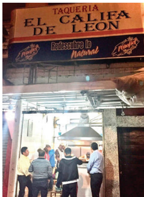
El Califa de León, uno de los galardonados.

La Guía Michelin es la guía de restaurantes y hoteles más famosa del mundo realizada por la empresa francesa de neumáticos Michelin, fundada en 1889 por los her-