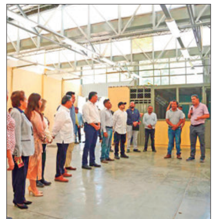
El titular del Poder Ejecutivo en Hidalgo sostuvo un encuentro con representantes de las comunidades escolares de Atitalaquia y Tepeji. .5

Renuevan infraestructura educativa; municipios