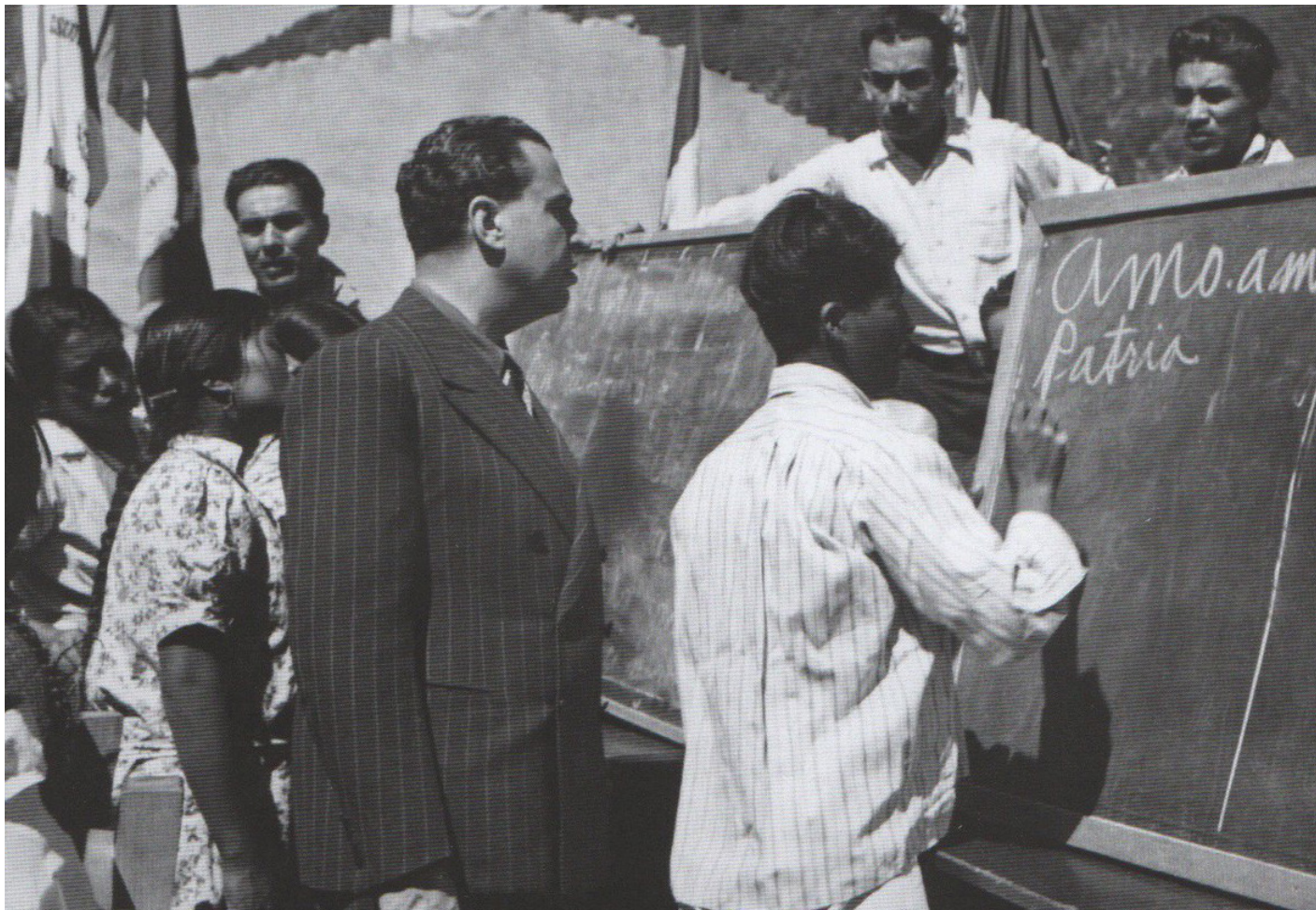
Jaime Torres Bodet fue más allá de su mentor Vasconcelos: consolidó el sistema educativo del México posrevolucionario.

rotativos, como El Universal, o semanarios como el entonces indispensable Tiempo, Semanario de la Vida y la Verdad, fueron a lo directo: don Jaime se había dado un tiro en el paladar. La bala atravesó el cerebro y lo mató de inmediato. Se decía que padecía un cáncer que amenazaba con llevarlo a una vida dolorosa y amarga. Desde los años 60 había perdido la vista de un ojo, y aún así había asumido la tarea titánica de volver a capitanear ese barco inmenso que se llama Secretaría de Educación Pública. Su primera vez como secretario de Educación fue en tiempos de Manuel Ávila Camacho: era relativamente joven y vigoroso: inventó escuelas, campañas de alfabetización. Todo eso, y los títulos de sus libros de poemas, su corta obra en prosa, fueron citados en todas partes; se recordaron los doctorados honoris causa, las numerosas condecoraciones. Era eso, un hombre ilustre que ponía al país entero en el brete de anunciar su suicidio.