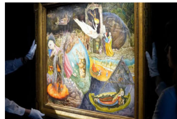
Su cuadro Las distracciones de Dagoberto rompió su récord de venta.

berto' se sumará a la colección del Malba junto a las creaciones de otras grandes pintoras como Remedios Varo y Frida Kahlo.