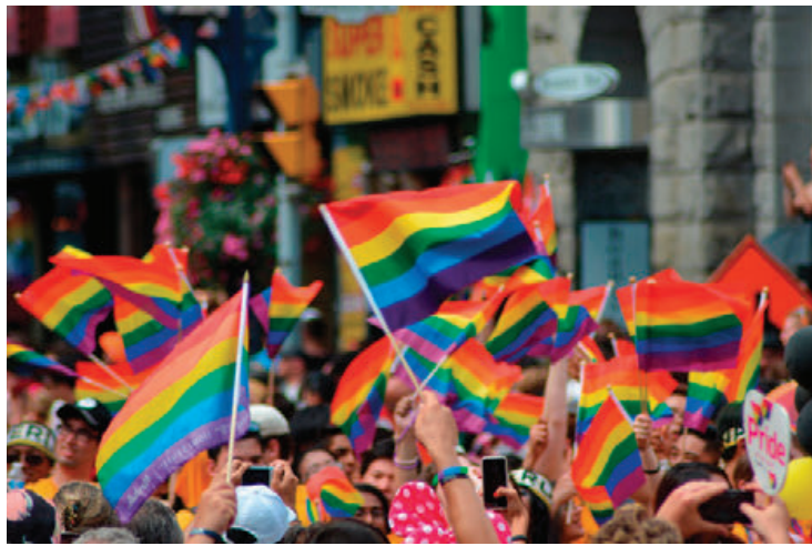
Marcha LGBT+ México.

Además, el informe destaca que el 18 por ciento de las atenciones son solicitadas por menores de edad pertenecientes a la generación alfa, y un 5 por ciento por miembros de la generación X, con edades entre 45 y 60 años. El porcentaje restante no especificó su edad.