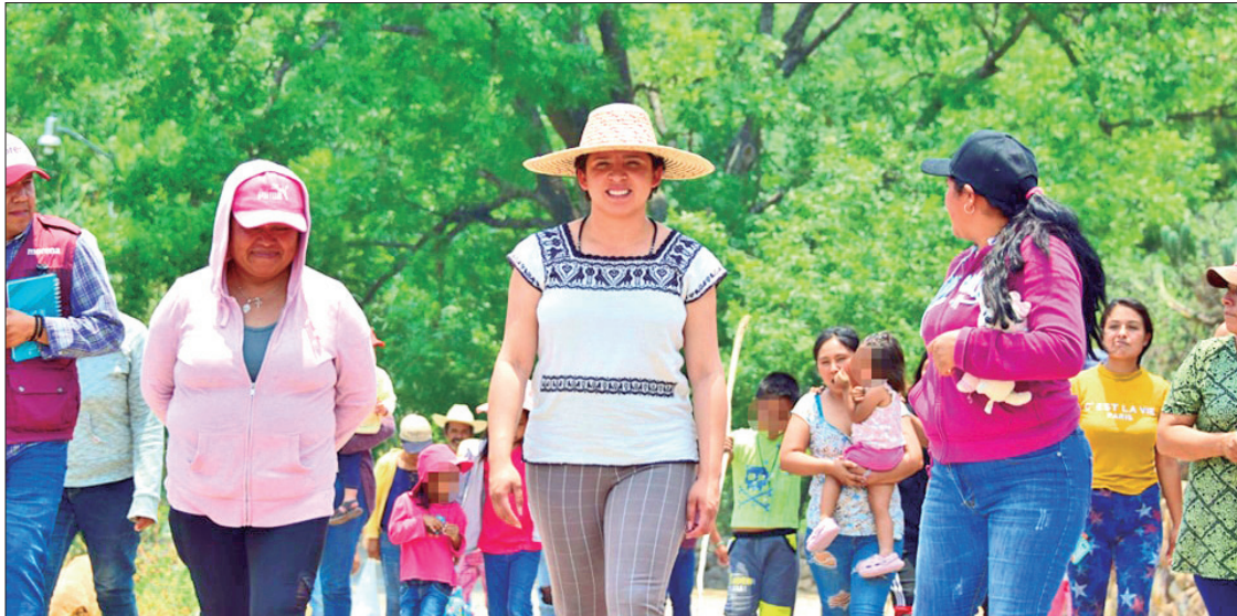
BASES. Ha caminar al lado de grandes líderes de izquierda que hoy son reconocidos por sus aportaciones.

► Sobresale su historia de vida y desarrollado dentro de las organizaciones sociales; ánimo