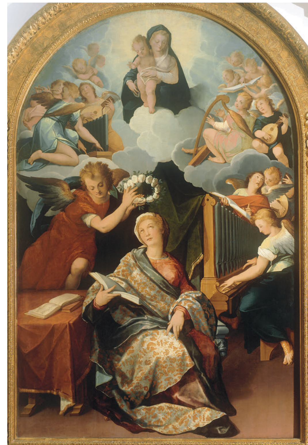
El cuadro “Santa Cecilia”, de Andrés de la Concha.

“Esta pieza hoy vuelve a las salas del Munal con una luz espectacular a su-