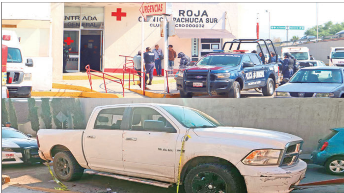
Un grupo de personas, fueron atacadas con arma de fuego en Tlapacoya, comunidad en Pachuca, lo cual movilizó a integrantes de los cuerpos de emergencia, la mañana de este jueves.

■ Trabajadores del gobierno de Hidalgo tienen hasta el 31 de mayo para cumplir con esta responsabilidad, recuerda el SUTSPEEH