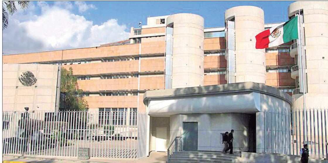
ADEMÁS. La metodología que utilizó el TEEH imposibilitó el análisis del contenido específico de los hechos para detectar si alguna actualizaba los elementos de las infracciones denunciadas, ya que fue de manera genérica, sin advertir el contenido y naturaleza de los mismos.

Asimismo, actos anticipados de campaña, vulneración a la prohibición de difusión de propa-