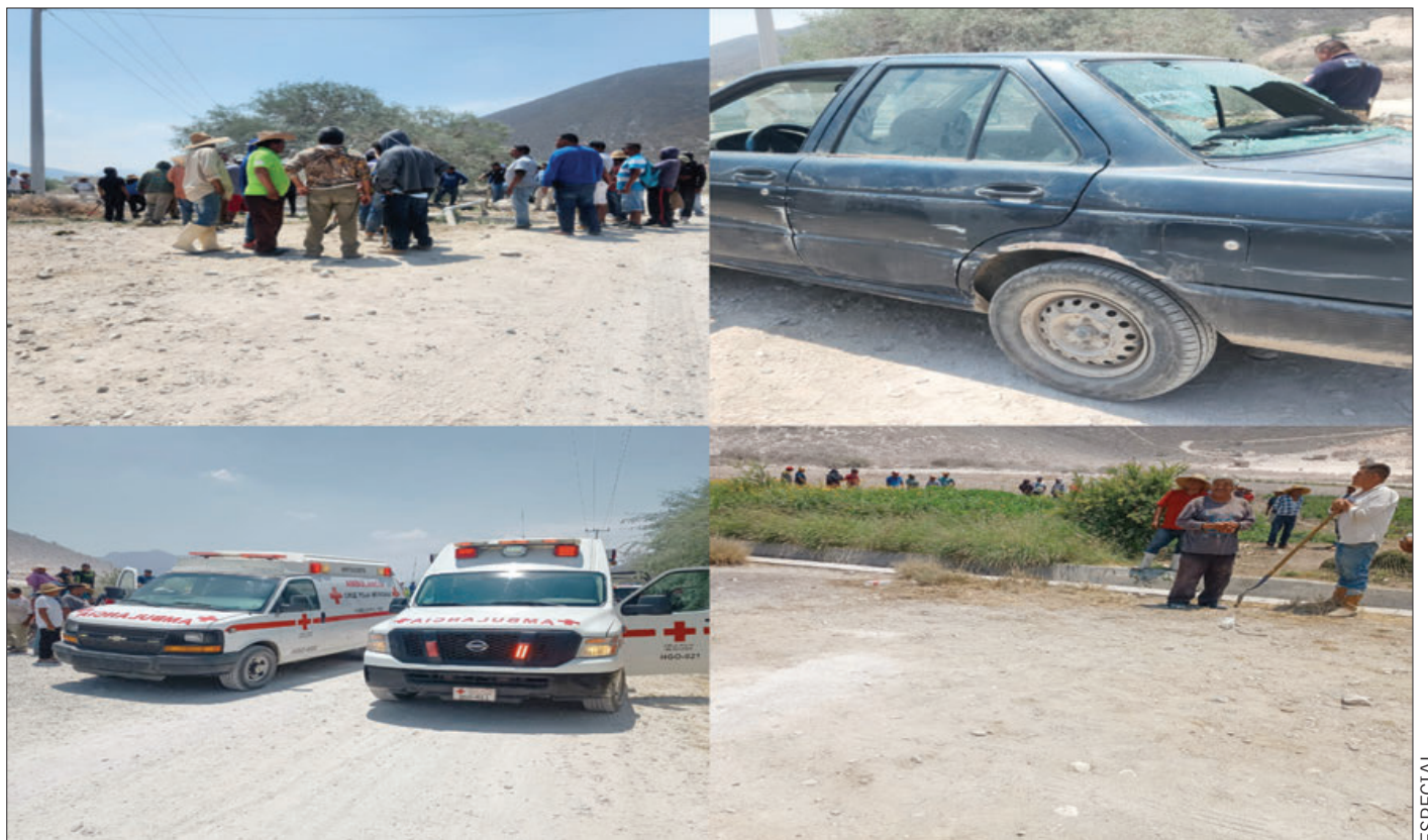
Vecinos de Ixmiquilpan se vieron involucrados en un enfrentamiento por la distribución de agua, esto en las comunidades de Bangandho y Pueblo Nuevo, de manera extraoficial, se indicó que diez personas resultaron lesionadas.

Un total de nueve personas lesionadas, fue el resultado de una riña entre pobladores Pueblo Nuevo y Puerto Bangandho en Ixmiquilpan, mismo quienes derivado de una acalorada discusión y al no llegar a acuerdos pasaron a las agresiones físicas. Se precisa que en la mayoría de los casos, los lesionados fueron atendidos en el sitio de la riña, pues sus lesionados eran menores, ya seas por golpes y descalabros, no obstante, algunos otros sí requirieron de atención médica por los que fueron trasladados a una clínica. De acuerdo con declaraciones, ayer antes del mediodía, campesinos de la comunidad de Pueblo Nuevo y Puerto Bangandho, discutían por el tandeo de agua para irrigar las parcelas, pues sus siembras estaban en peligro de perderse debido a la falta del líquido. 3