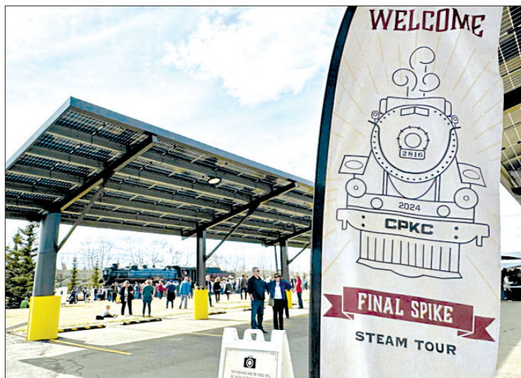
COMIENZO. El Final Spyke Steam Tour inició el miércoles 24 de abril desde Calgary, Canadá.

Este viaje conmemora el primer aniversario de la unión entre Cana-