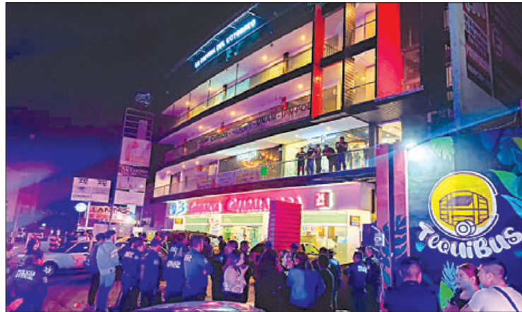
INCUMPLIMIENTOS. Se mencionó que los bares que no superaron la supervisión fueron Terraza Rabbit, Combi Beer, Terraza Bacardí y Tequibus, donde se encontraron envoltorios con drogas, como marihuana, cocaína y un nuevo estupefaciente nombrado Tusi.

Durante conferencia de prensa en conjunto entre autoridades de procuración de justicia, protección civil y derechos humanos, el secretario de Seguridad Pública de Hidalgo informó que los operativos derivan del incremento de denuncias correspondientes a venta de droga al interior de este establecimientos que