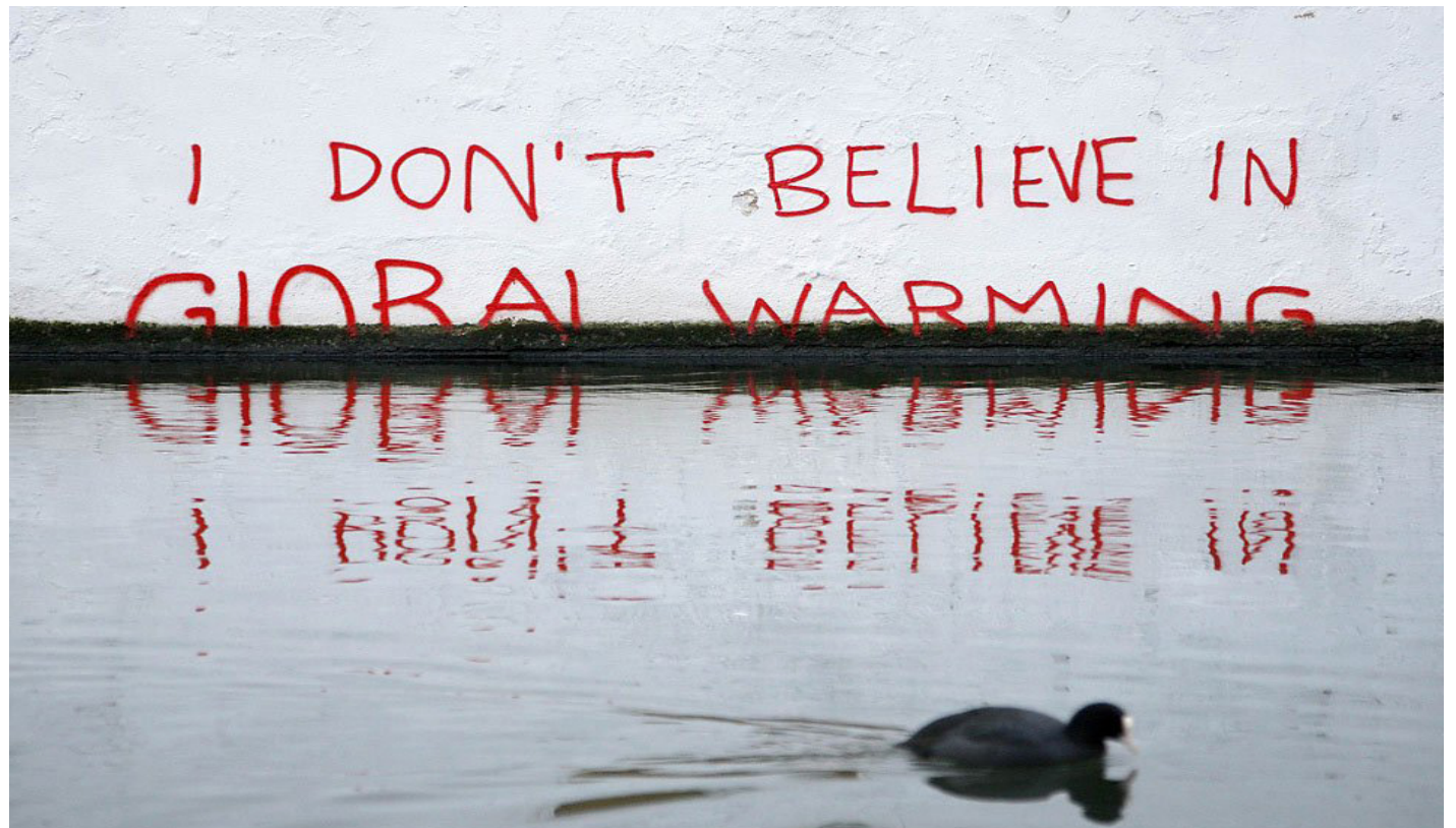
Graffiti de Banksy para denunciar a los que niega el cambio climático.

cano borró de toda documentación oficial la palabra “cambio climático!”, como si así dejara de existir el problema, Florida sufría una ola de calor con temperaturas récord, como en Cayo Largo, donde la combinación de humedad y calor creó una sensación térmica de 46.6° centígrados, un récord histórico.