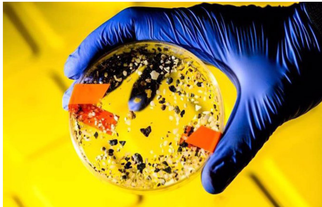
MATTHEW MODONO/NORTHEASTERN UNIVERSITY

Pero la investigación muestra que los microplásticos en el océano están ralentizando el