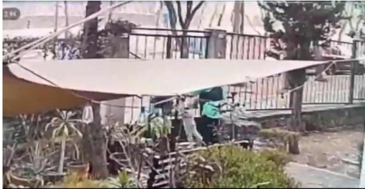
Todo lo ocurrido respecto al secuestro el 16 de mayo quedó grabado en la cámara de seguridad de la casa.

En ese momento, se abrió la carpeta de investigación número CI-FICOY/CU/UI-1 S/D/00046/05-2024 por el delito de sustracción de menores o incapaces y la alerta fue difundida en distintos medios de comunicación, lo que viralizó el