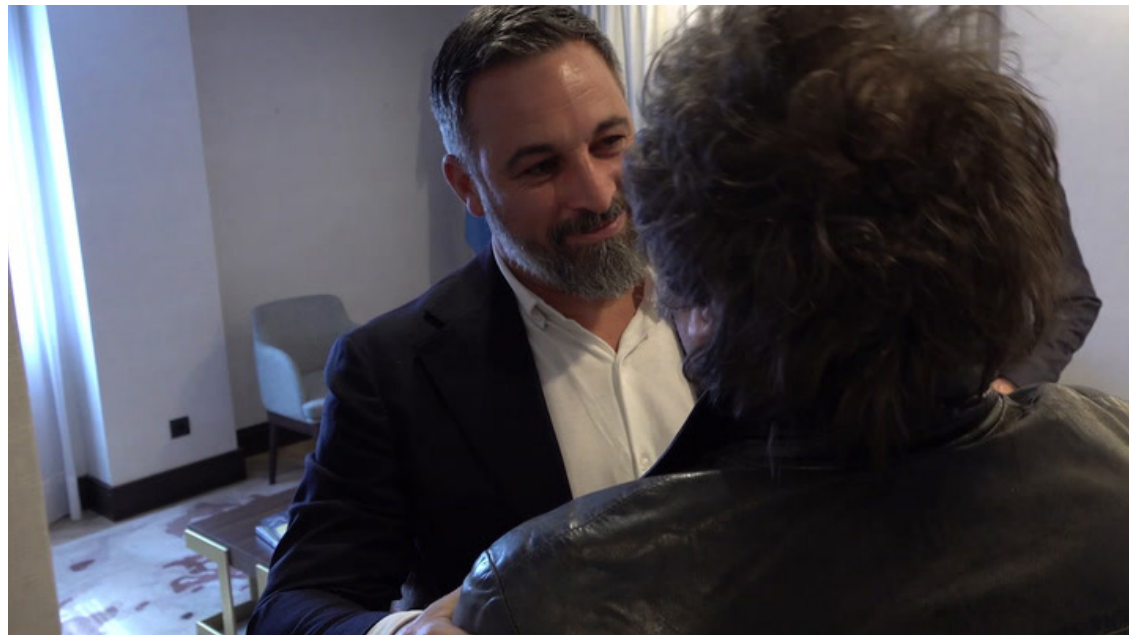
El líder de Vox, Santiago Abascal, abraza al presidente argentino Javier Milei.

Al tratarse de una especie de reunión internacional de las fuerzas vivas de la extrema derecha, sus simpatizantes se movilizaron desde diversos puntos del continente y, por supuesto de España, hasta Madrid para escu-