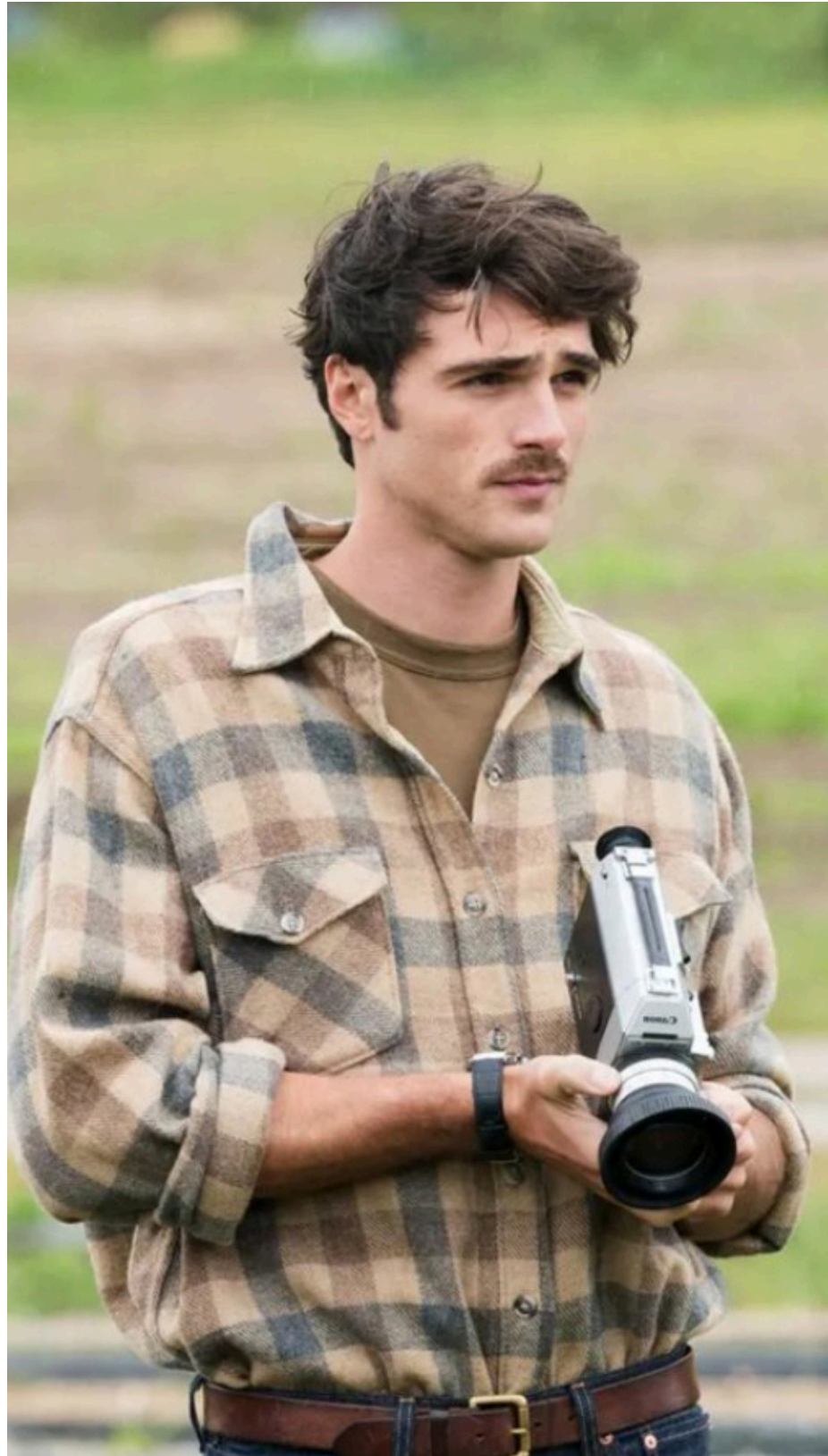
Fotograma del filme.

Richard Gere, de 74 años interpreta al mucho mayor, Leonard Fife, quien sorprendentemente acepta ser entrevistado por dos exalumnos (Michael Imperioli y Victoria Hill) para un documen-