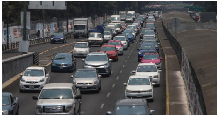
Se activa la contingencia ambiental en la CDMX por mala calidad del aire.

Este domingo no circulan los vehículos de uso particular con holograma de verificación 2, 00 y 0, engomado rojo, terminación de placa 3 y 4