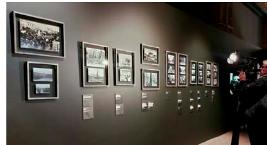
Una vista de la muestra.

Túmulos de cadáveres, cuerpos tirados en la calle, famélicos