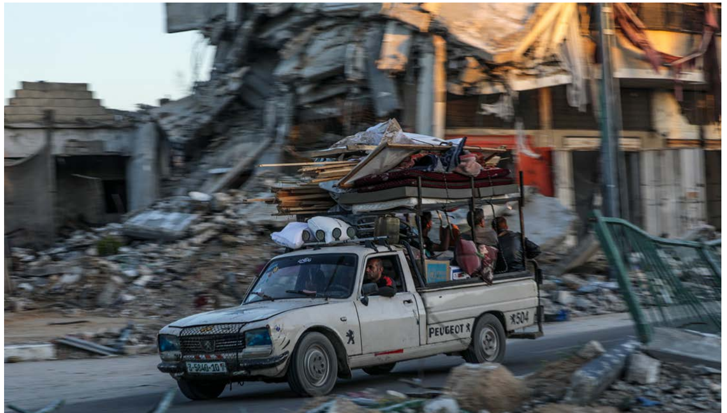
Palestinos refugiados en el este de Rafah, obligados a evacuar de nuevo y reinstalarse en la costa de la Franja de Gaza.

“La situación de los enfermos y heridos en los hospitales de la Franja de Gaza ha sido muy difícil desde el comienzo de la guerra a causa de la pérdida de dispositi-