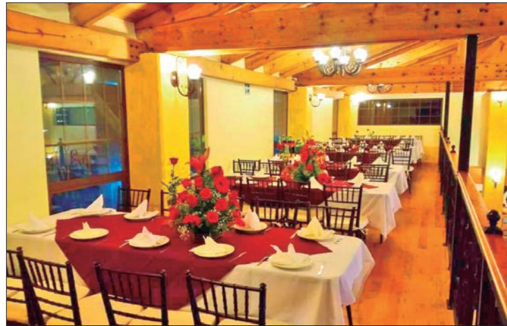
MARKETING. Para impulsar las ventas, los empresarios aplican descuentos y promociones para que los clientes se beneficien de manera directa.

De acuerdo con estadísticas del Instituto Nacional de Estadística y Geografía (Inegi) en el estado hay 13 mil 500 puntos de negocios activos desde una fonda hasta un restaurante y