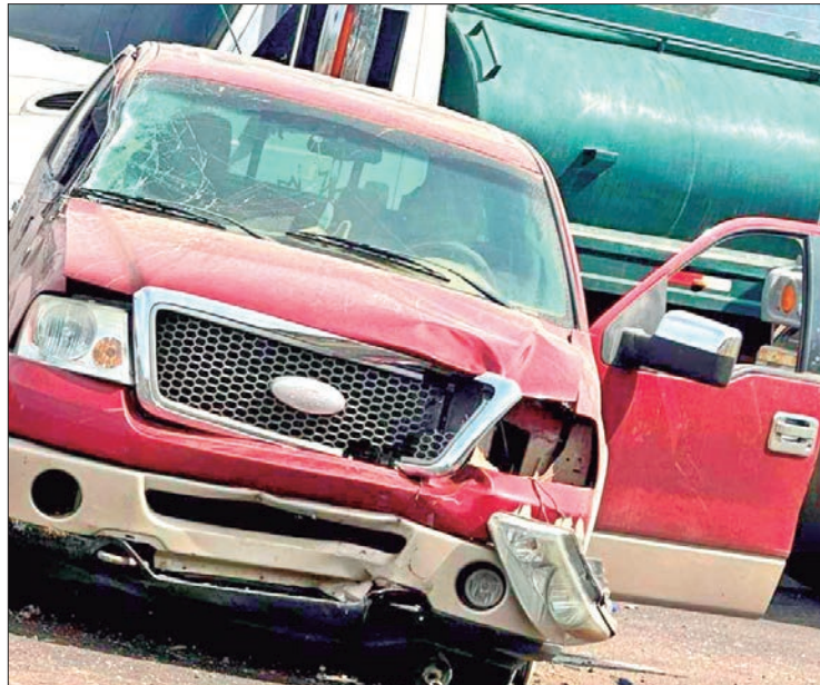
LLAMADO. Las autoridades federales exhortaron a los conductores manejar con precaución respetar los límites de velocidad.

Indicaron que actualmente se ejecutan trabajos de rehabilitación y mantenimiento en el