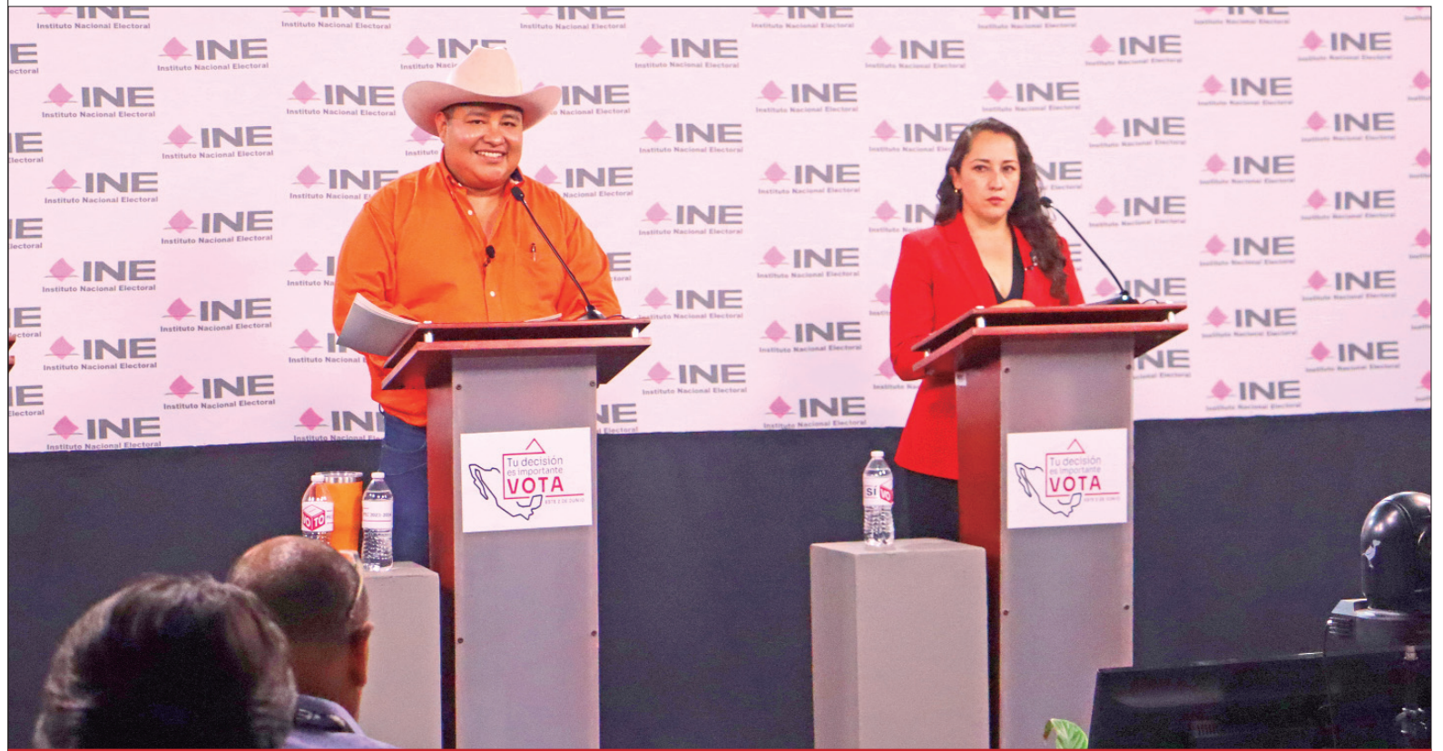
IDEAS. En los bloques de preguntas, plantearon temas como federalismo, pacto federal, agua, salud y seguridad.