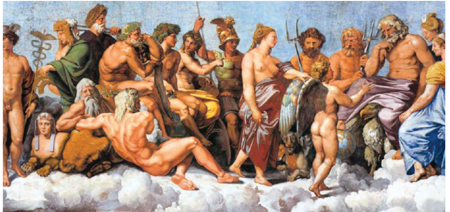
Detalle de 'El consejo de los dioses', Rafael Sanzio, 1517-1518, Villa Farnesina, Roma.

En una versión Mesopotámica del mito de la creación del hombre, se dice que los dioses están artos de trabajar por lo que Enki, dios del agua, le pide a su madre Nammu que traiga barro del océano primigenio. Luego le ordena a Ninursag, la diosa de la tierra, que modele ese barro para crear figuras semejantes a la de los dioses. Así surgen los hombres que hacen el trabajo del que renegaban las deidades. El relato señala que Ninursag, ya bajo los efectos del vino, sigue formando figuras de barro defectuosas y desafía a Enki a darles vida. El dios acepta el reto y es así como surgen