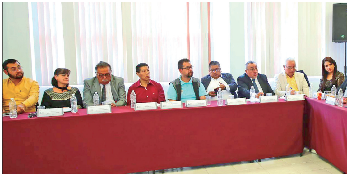
PATRONES. Es importante la participación de todos para lograr llegar a las escuelas de todos los niveles educativos, principalmente a las y los docentes, ya que son ellos los primeros que tienen que recibir la información.

Asimismo, pidió a los presentes seguir trabajando en la construcción de una cultura de la paz, con la participación activa y el involucramiento interinstitucional, lo que generará agentes de cambio en las niñas, niños y adolescentes, promo-