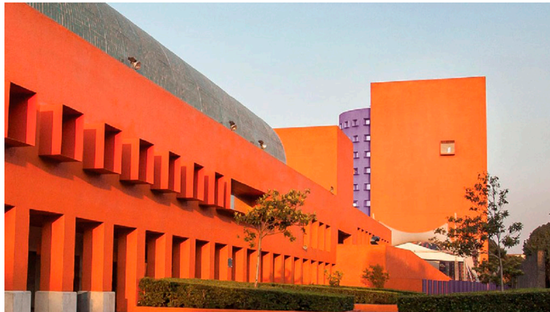
Del 11 al 26 de mayo se llevarán a cabo los conciertos y presentaciones en el auditorio Blas Galindo.