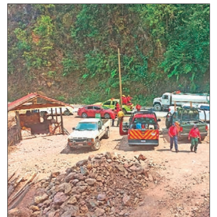
TENANGO DE DORIA. Este 7 de mayo, las llamas sobrepasaron la brecha corta fuego, lo que llevó a una reunión de emergencia. 4