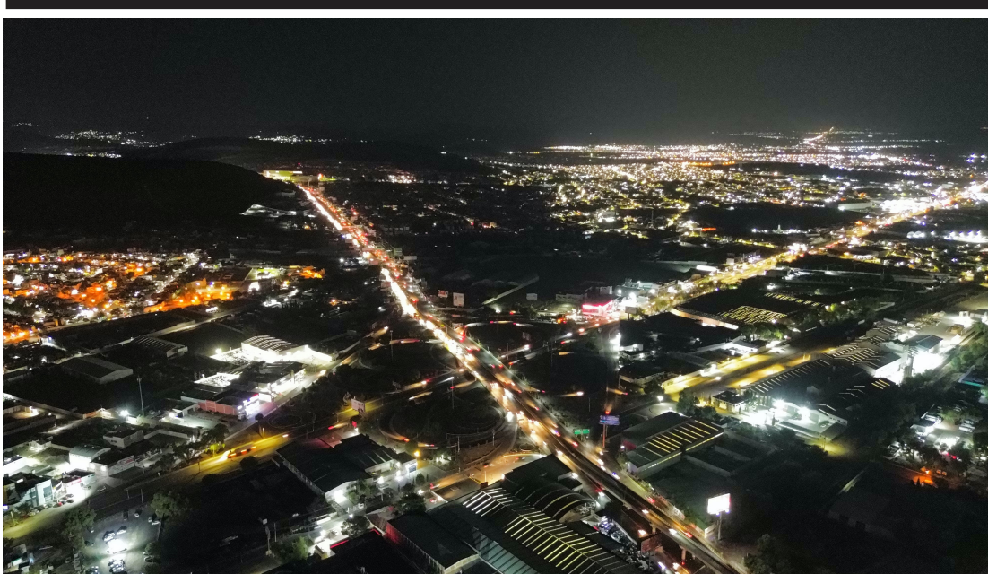
El Centro Nacional de Control de Energía (Cenace) emitió una alerta por el aumento en el consumo de energía eléctrica, lo que originó apagones en gran parte del país, incluidos algunos municipios de la zona metropolitana de Pachuca.

■ Tras revocaciones del TEEH para que el IEEH concediera registros de aspirantes, reconocieron que hubo procedimientos indebidos; reglas y plazos